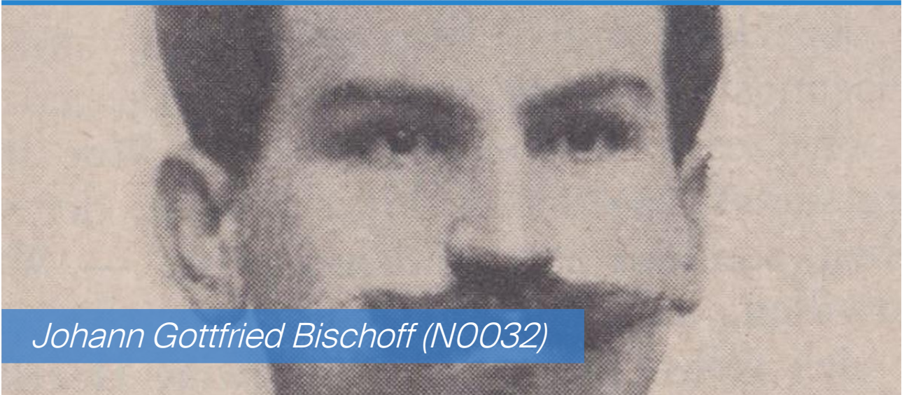
Johann Gottfried Bischoff (N0032)