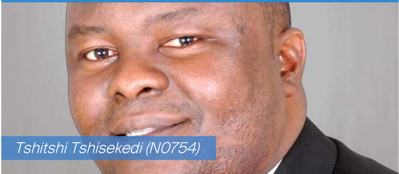
Tshitshi Tshisekedi (N0754)