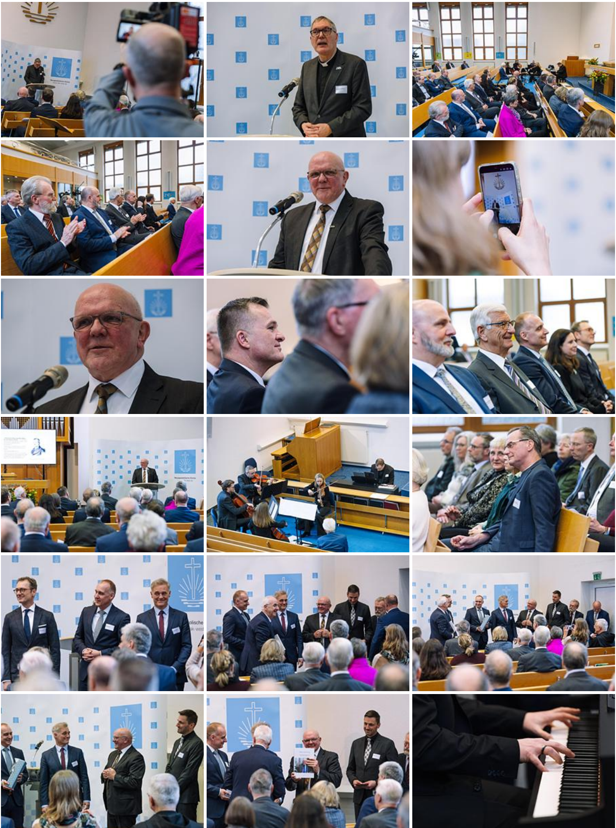
30. Januar 2026 - Feierstunde in Frankfurt: Bischof i.R. Johannung aus ökumenischer Arbeit verabschiedet