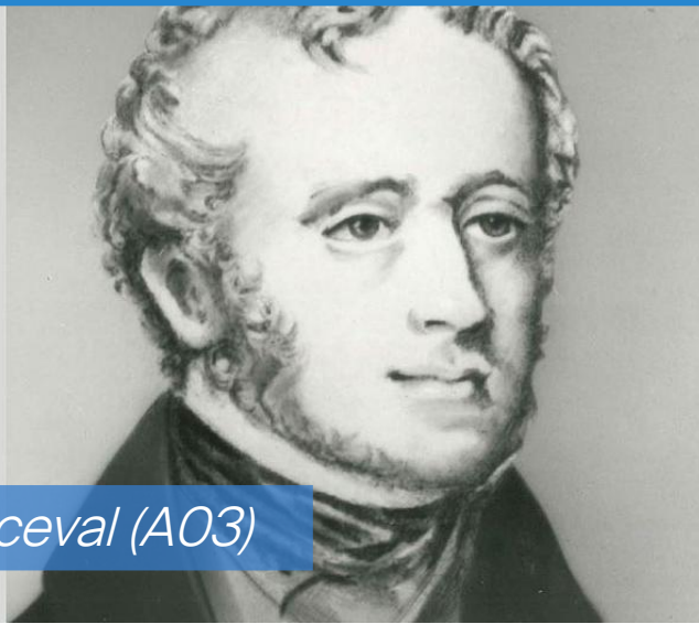
Spencer Perceval (A03)