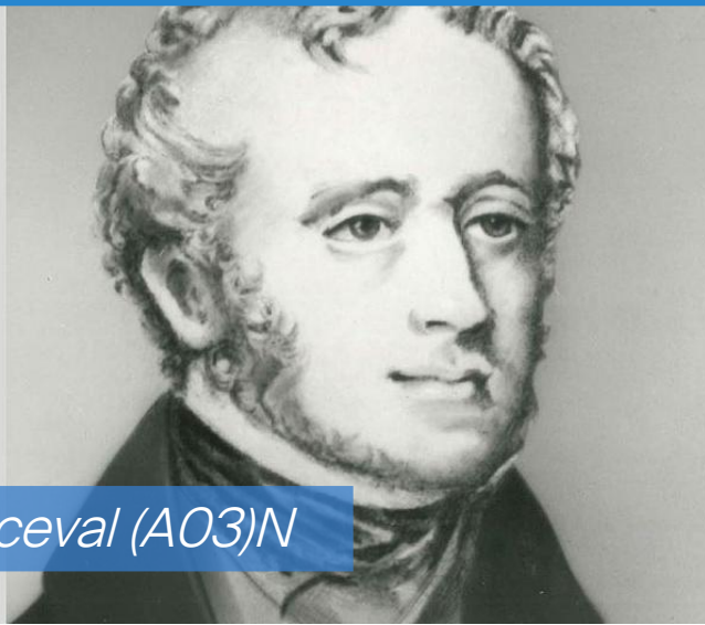
Spencer Perceval (A03)N