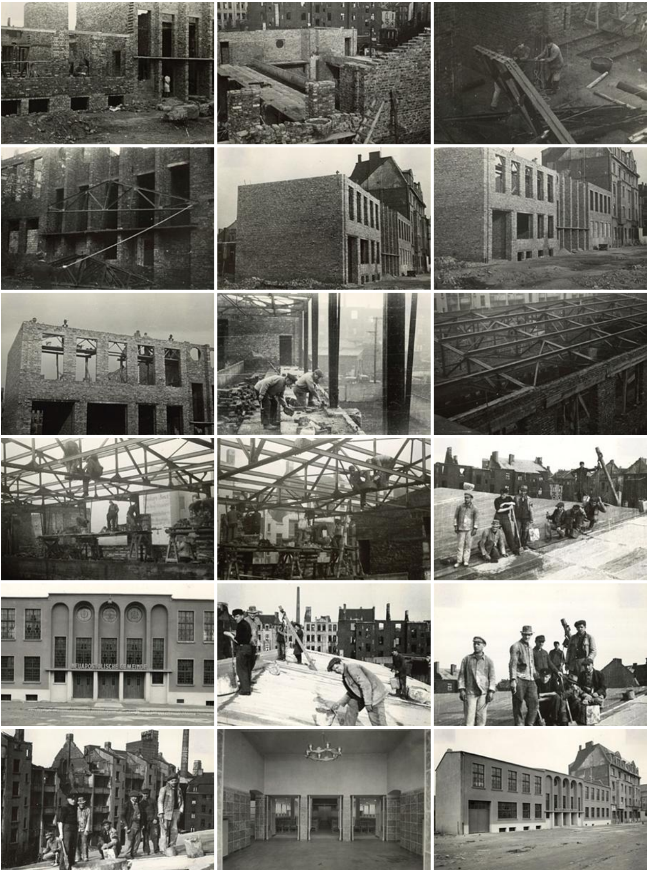
1943-1971 - Zerstörung, Wiederaufbau, Wiedereinweihung, Gottesdienste und Umbau der Kirche Dortmund-Nord (Nordrhein-Westfalen)