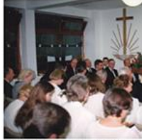
Gottesdienst an der Beethovenstraße