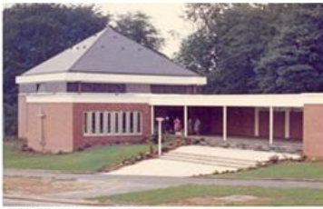
Kirchengebäude im Jahr 1976