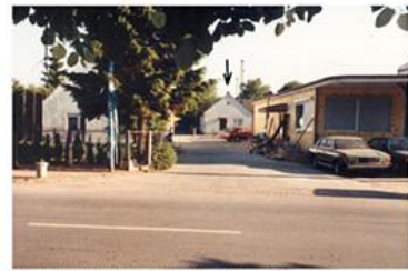
Versammlungsstätte der Gemeinde Hochdahl von 1902 bis ca. 1913