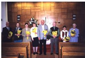
Aufnahme mit Glockenläuten im Jahr 1988