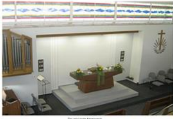
Die renovierte Altarwand