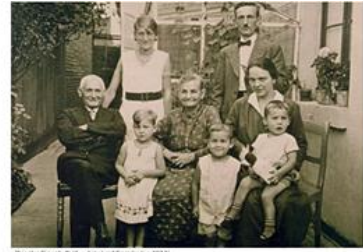
Probleme Erkrath (1. + 2. Bild) mit Familie (ca. 1971)