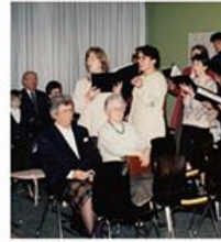
Gottesdienst in der Fröbel-Schule