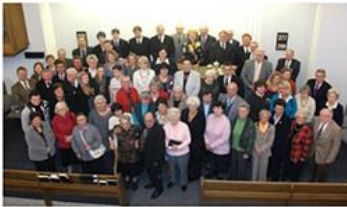
Die Gemeinde Erkrath - Hochdahl im Jahr 2010