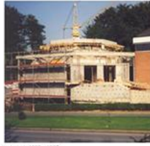
Bau der Jugendbegegnungsstätte 1983 - 1985