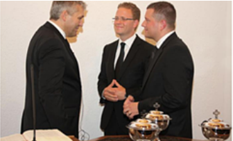
Apostel Ottien in Bonn-Nordwest - Neue Vorsteher gesetzt

Die Pfarrverwaltung ist den Pfarrmitgliedern des Bonner Stadtbezirks Bonn-Nordwest für den 17. 07. 2020 dankbar, die Gottesdienste zu feiern.