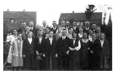
Der Gemeindechor 1931