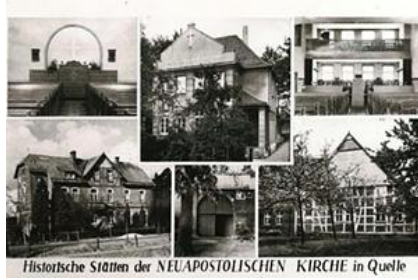
Historische Stätten der NEUAPOSTOLISCHEN KIRCHE in Quelle