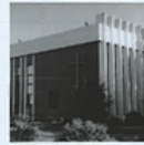
120 Jahre Gemeinde Quelle-Steinhagen am Sonntag 2. August 1998