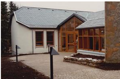
Eine Reise in die 1200-jährige Vergangenheit des Kirchengebäudes der Neuapostolischen Kirche an der Westefeldstr. 12 in Bielefeld