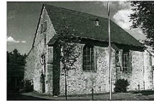
Eine Reise in die 1200-jährige Vergangenheit des Kirchengebäudes der Neupastoralischen Kirche an der Westerfeldstr. 12 in Bielefeld