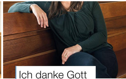
Ich danke Gott