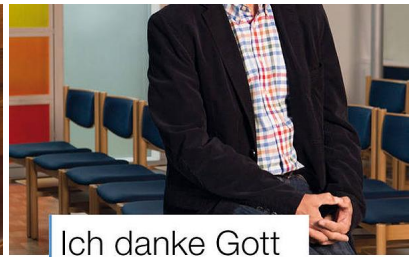
Ich danke Gott