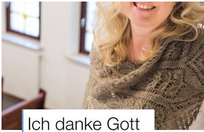
Ich danke Gott