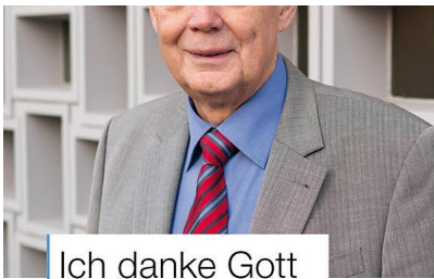
Ich danke Gott