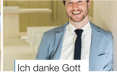
Ich danke Gott