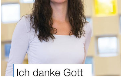
Ich danke Gott