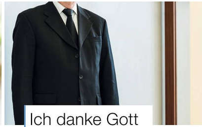
Ich danke Gott