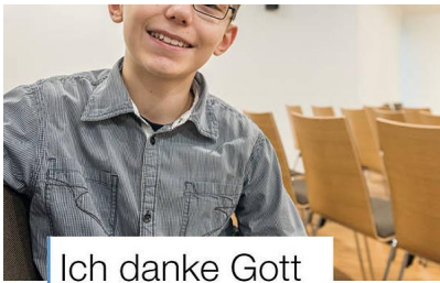
Ich danke Gott