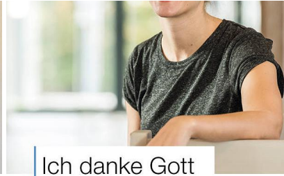
Ich danke Gott