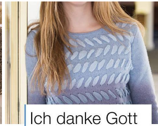
Ich danke Gott