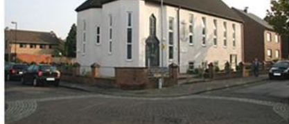
60 Jahre Kirchengebäude in Horrem