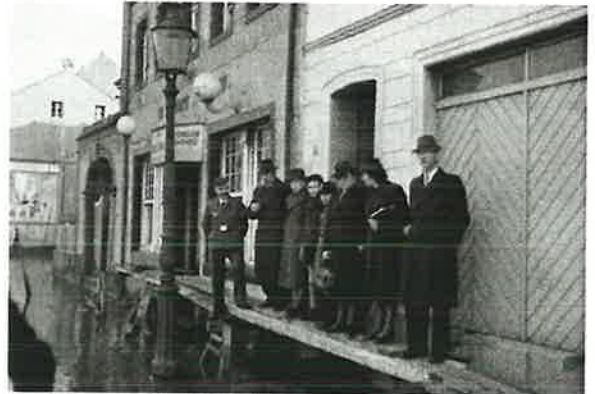
Gemeindemitglieder bei Hochwasser vor der Versammlungsstätte in Beuel