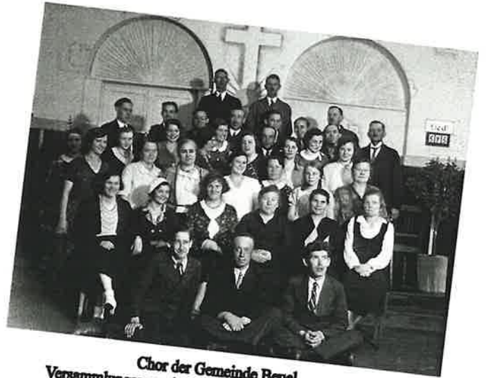
Chor der Gemeinde Beuel Versammlungsraum in der Gastwirtschaft "Zum Anker"