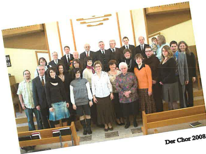
Der Chor 2008