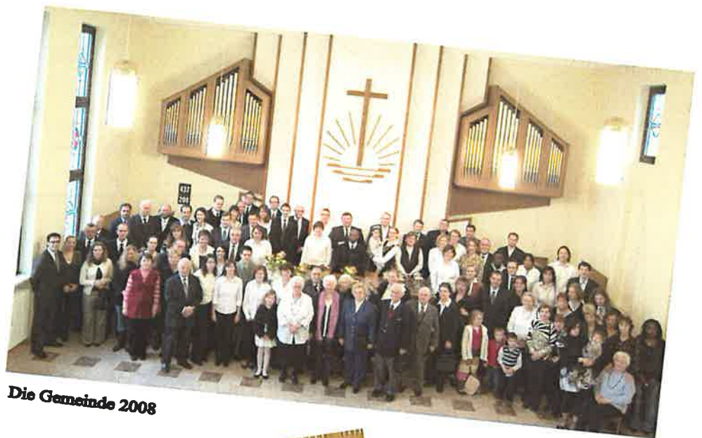
Die Gemeinde 2008