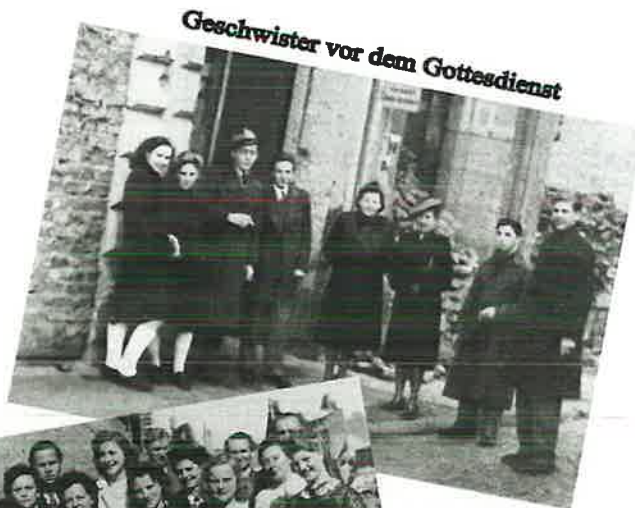
Geschwister vor dem Gottesdienst

Da die meisten Amtsträger mit Ausbruch des Zweiten Weltkriegs zum Militärdienst eingezogen werden, ist die seelsorgerische Arbeit in den Gemeinden schwierig