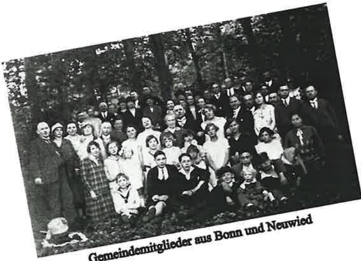
Gemeindemitglieder aus Bonn und Neuwied

Es entsteht eine weitere Gemeinde in Bad Godesberg. Die Muttergemeinde bezieht eine neue Versammlungsstätte in Beuel, Rheinstraße 5.