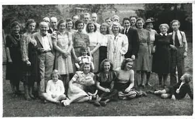
Bonner Geschwister Anfang der 50er Jahre (ganz rechts: Bruder Leinen)

Eine Woche später erhält die Gemeinde mit Priester Wilhelm Göpel einen neuen Vorsteher.