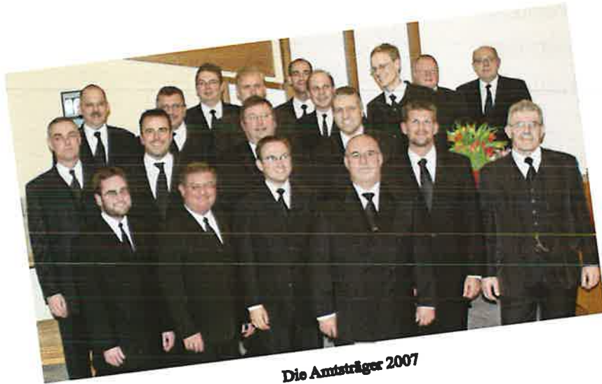
Die Amtsträger 2007