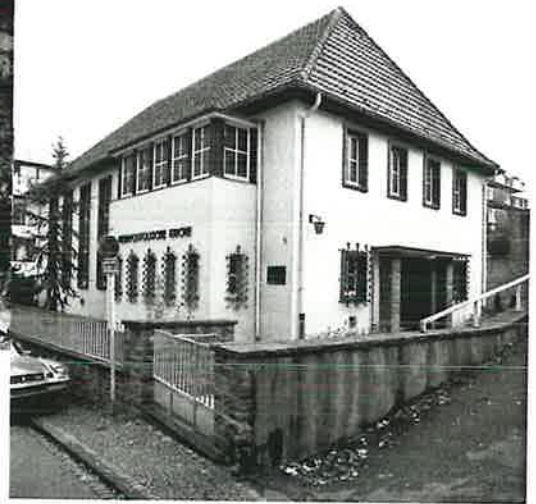
Kirchengrundstück "Erste Fährgasse" nach dem Krieg (oben) und nach dem Bau der Kirche (rechts)