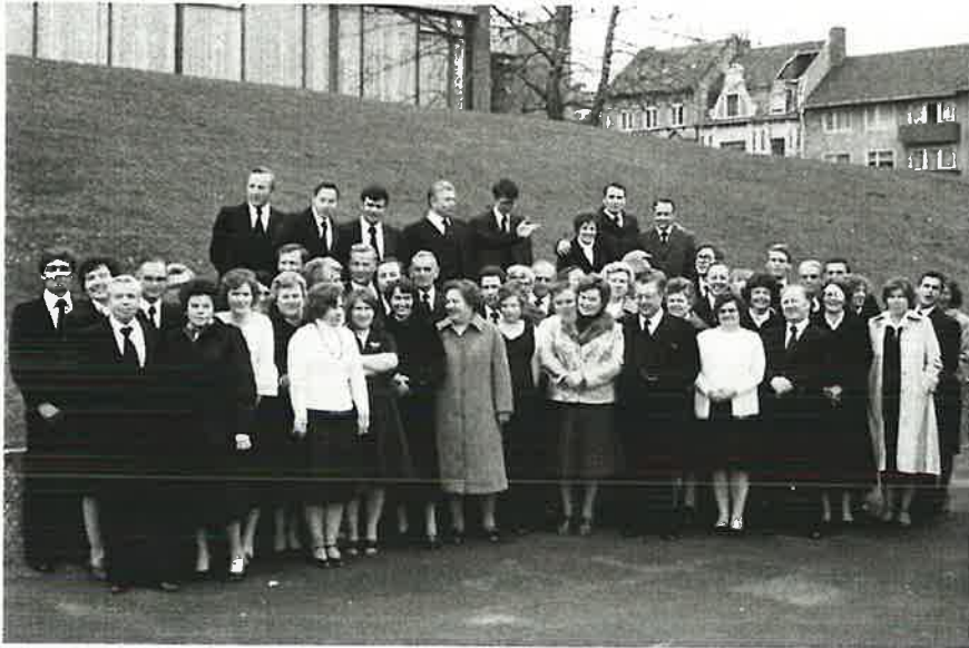
Bonner Amtsträger und ihre Frauen