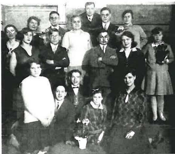
Bonner Jugend um 1930