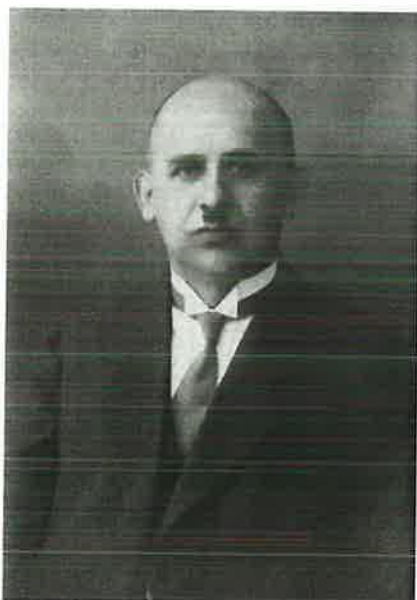
Bischof Heinrich Otto (links); Chor während des Einweihungsgottesdienstes (unten)

An diesem Tag wird das erste eigene Kirchengebäude der neuapostolischen Gemeinde Bonn, Erste Fährgasse 4, von Bischof Heinrich Otto eingeweiht (Psalm 84, 2.4.11).