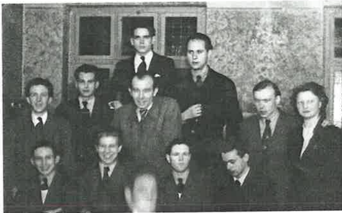
Bonner Jugend nach dem Krieg