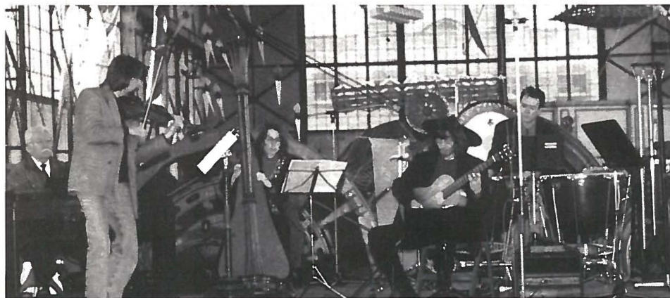
„Flieg mein Drachen flieg“ ist der Titel eines Kinderkonzertes in der evangelischen Kirche an der Märtmannstraße

16 Uhr: Haus Rodenberg, Offenes Volkliedersingen, Unter Beteiligung der Posaunenchorre aus Aplerbeck, Berghofen, Schüren und Sölde, Leitung Landesposaunenwart Saretski.