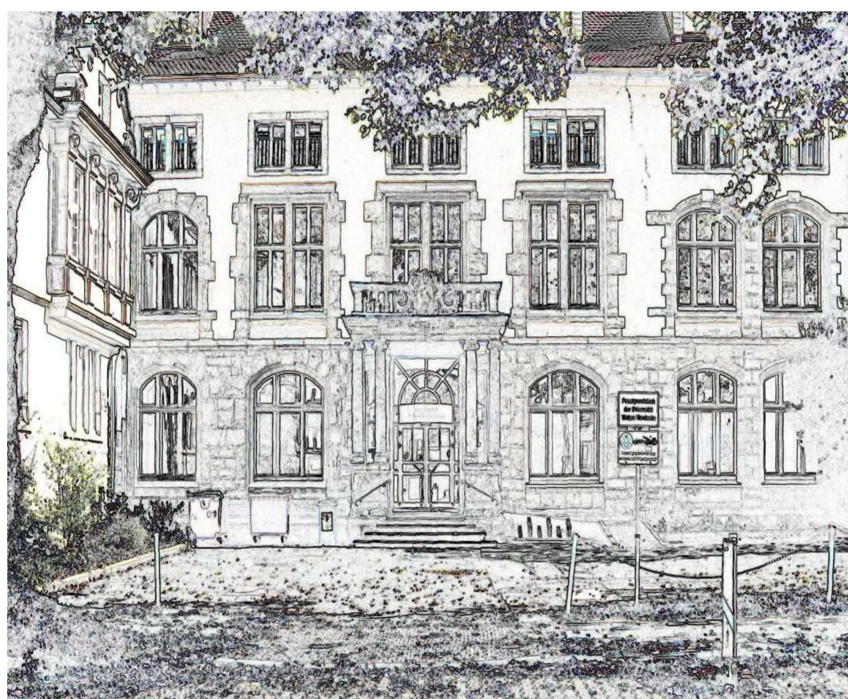
Annener Amtshaus 1917