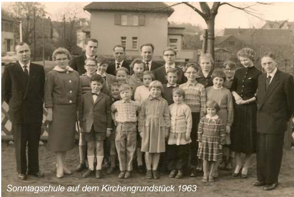
Sonntagschule auf dem Kirchengrundstück 1963