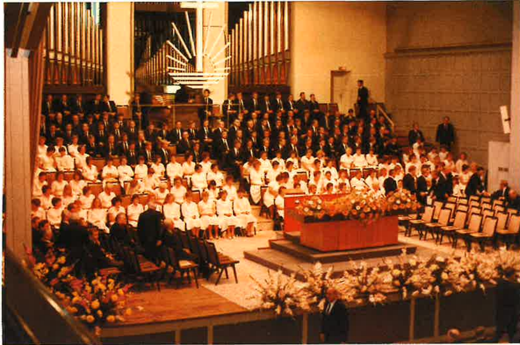
Gottesdienst in der Stadthalle Kassel am 21. 9. 1980