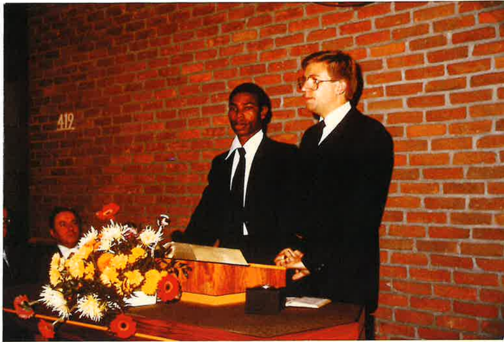
Hirte Dekor am Altar in Neuenbrunslar, Pr. M. Wolff übersetzt