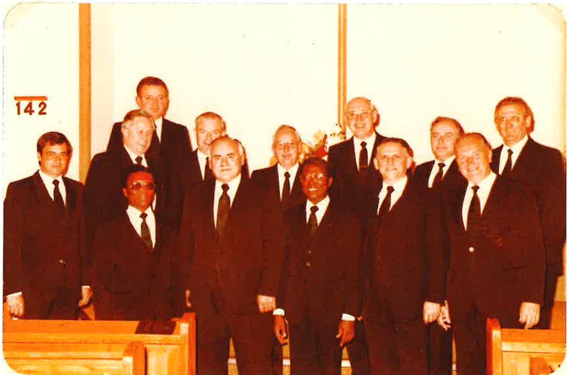
Im Kreis der Vorsteher