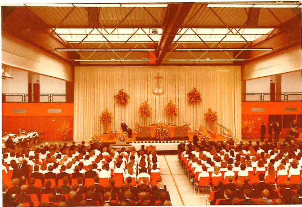
Blick in die Hinterlandhalle