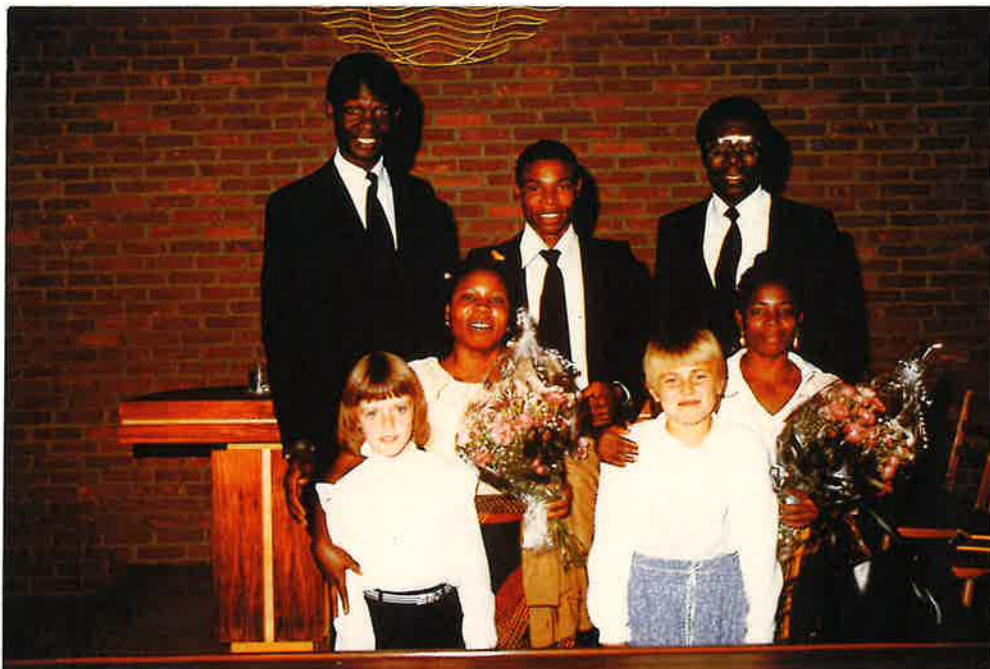
Nach dem Gottesdienst in Neuenbrunslar