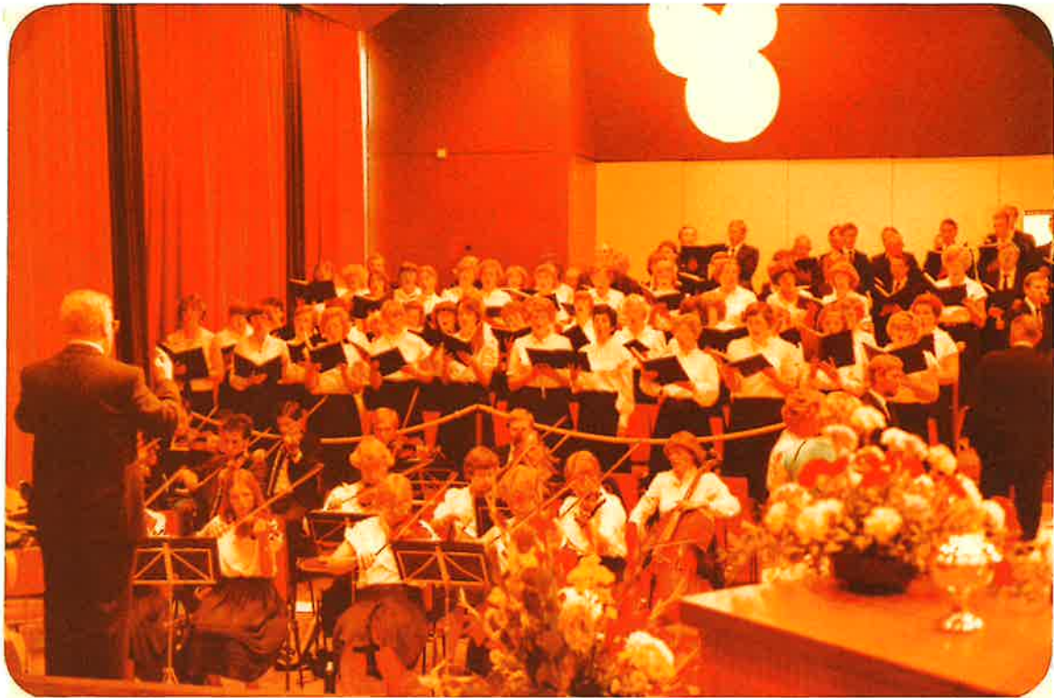
Kulturzentrum Warburg Ein Teil des Instrumental- und gemischten Chores