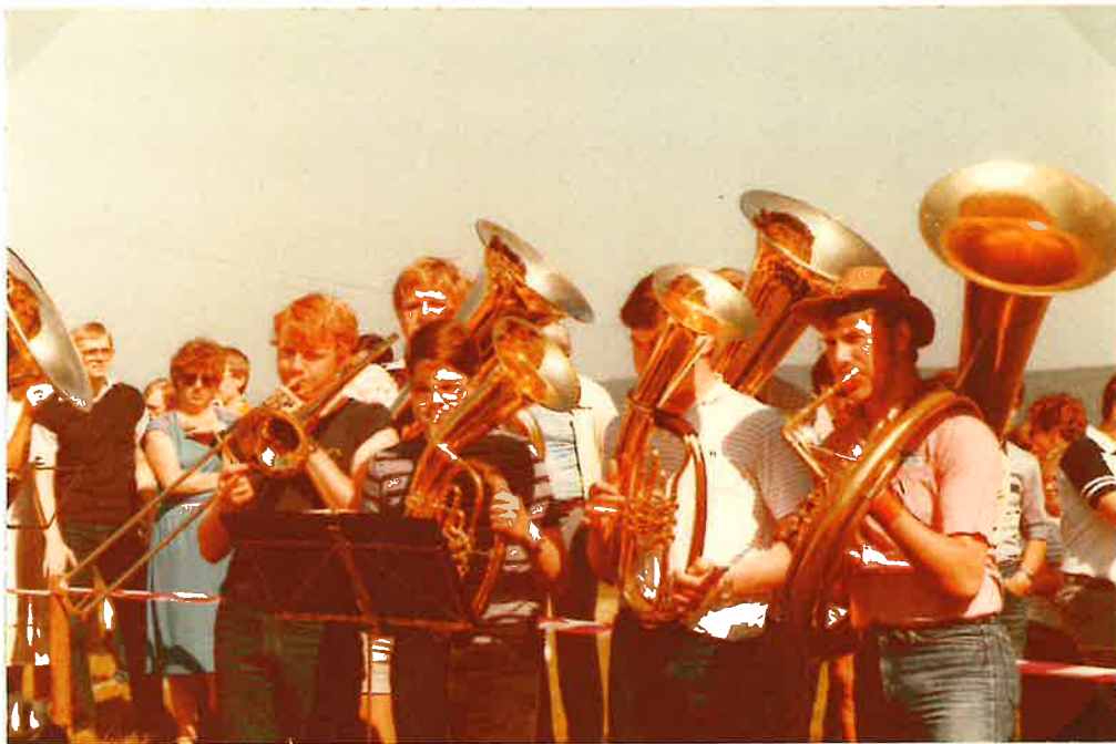
Jugendtreffen der Bezirke Kassel, Bad Hersfeld, Lau- terbach und Korbach Pfingsten 1982 auf dem Hirschberg bei Helsa