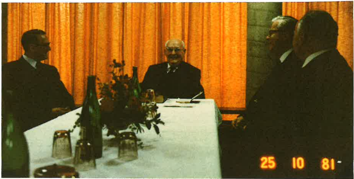
Im Ämterzimmer des Bürgerhauses Borken