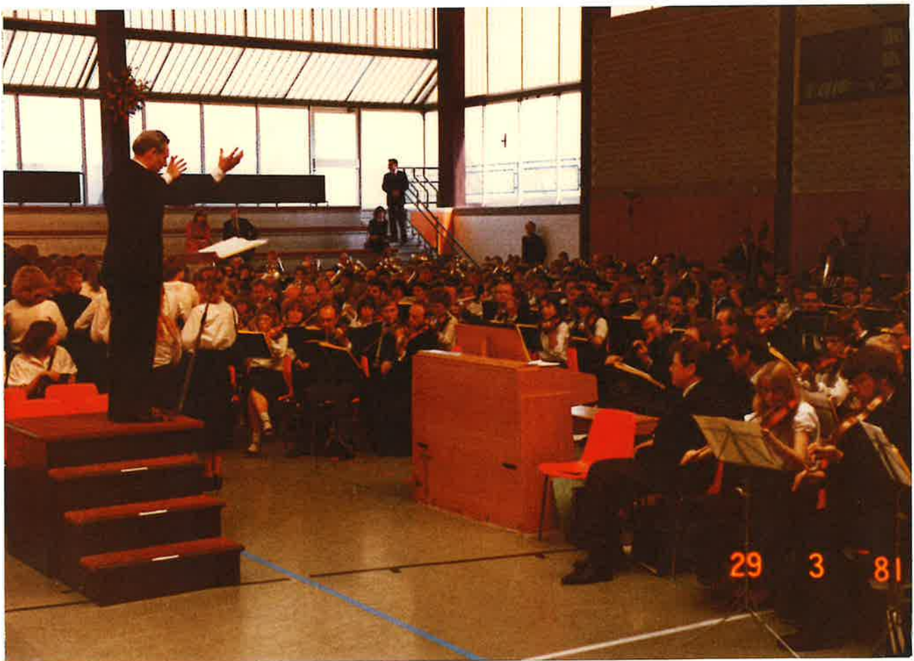
Jugenddienst am 29. 3. 1981 in der Hinterlandhalle Instrumentalchor