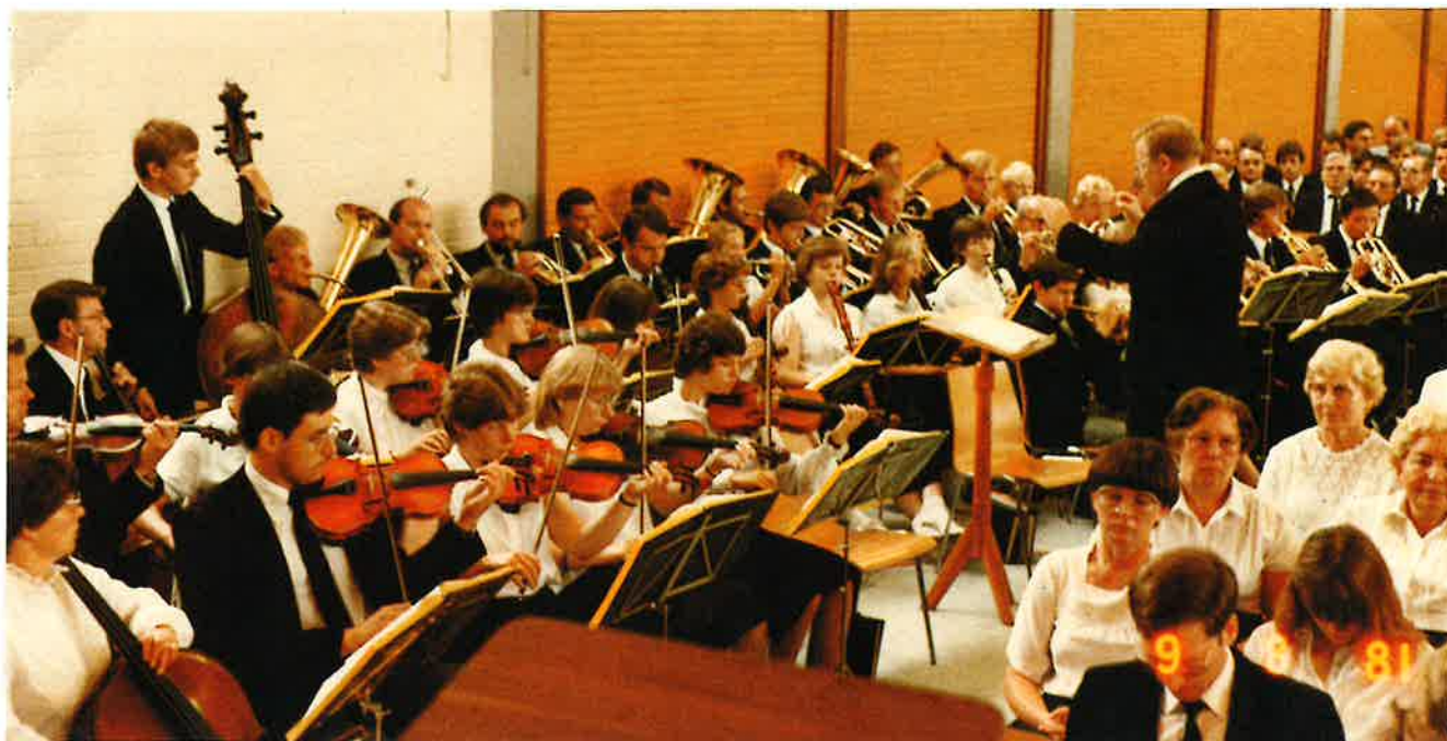
Der Instrumentalchor des Unterbezirkes