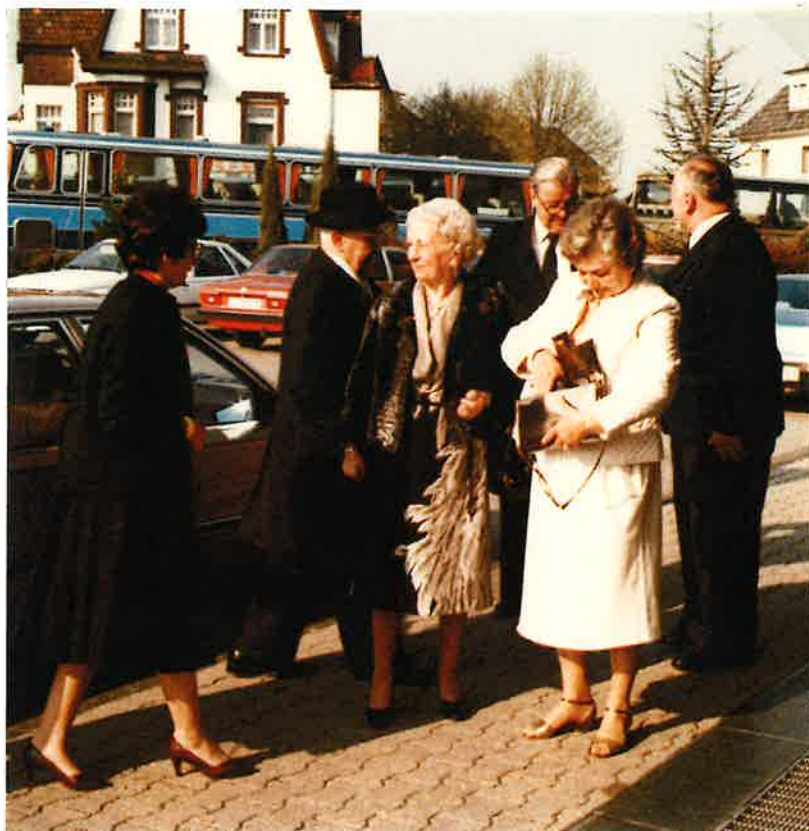
Ankunft des Bez.-Ap. am 9. 5. 1982 vor dem Bürgerhaus Borken