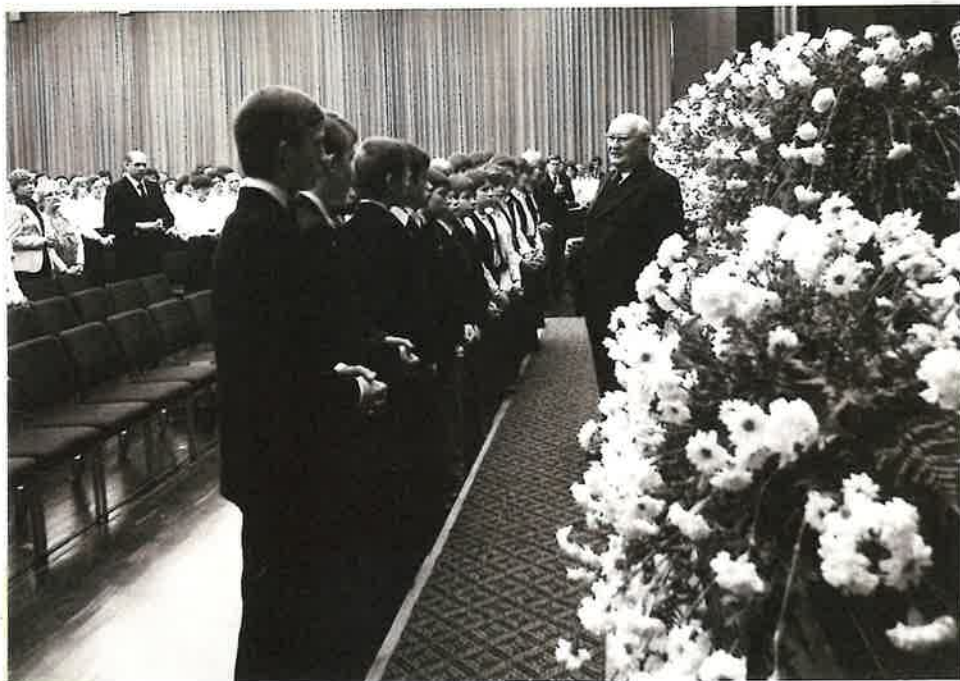
Nach dem Konfirmationssegen