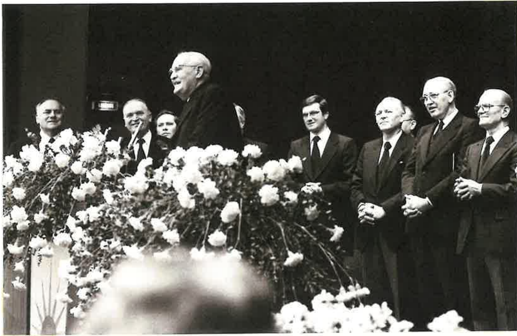
Konfirmation am 8. 4. 1979 in der Stadthalle Korbach Der Bezirksapostel am Altar