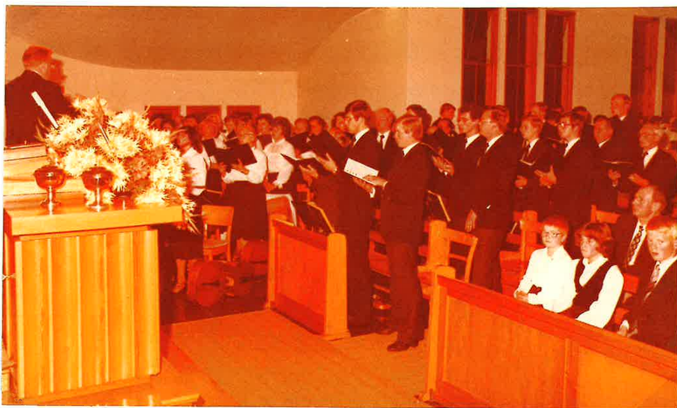
Ein Teil des Männerchores (r.)