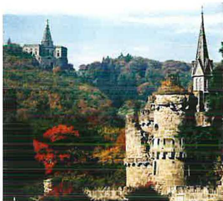
Löwenburg und Herkules

Mit heute etwa 200.000 Einwohnern ist Kassel drittgrößte Stadt Hessens. Sie ist Sitz des Bundessozialgerichts und Universitätsstandort mit etwa 24.000 Studierenden und 5.0000 Beschäftigten und zählt heute zu den jungen aufstrebenden Universitäten Deutschlands. Bedeutende Firmen wie unter anderem Daimler-Benz, Kali+Salz AG, Winterhall AG und Bombardier haben hier ihren Standort. Größter Arbeitgeber in der Region Kassel ist das VW-Getriebewerk im angrenzenden Baunatal mit etwa 15.000 Beschäftigten.