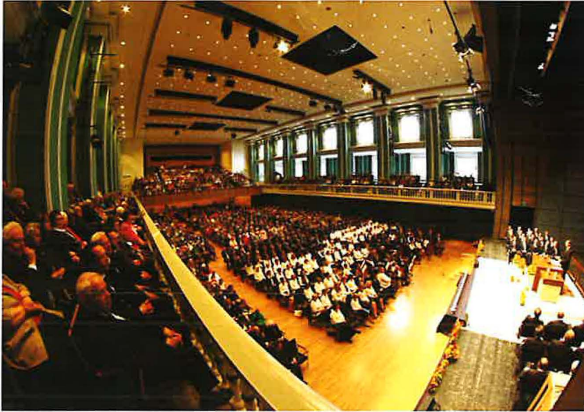
Foto: Geschwister in der Stadthalle Kassel

Die Anfänge beider Ursprungsbezirke reichen zurück bis zum Anfang des 20. Jahrhunderts und obwohl der Bezirk Korbach als selbstständiger Ältestenbezirk erst im Jahre 1976 gegründet worden ist, haben beide Bezirke auch in den davor liegenden Jahren viele Gemeinsamkeiten.