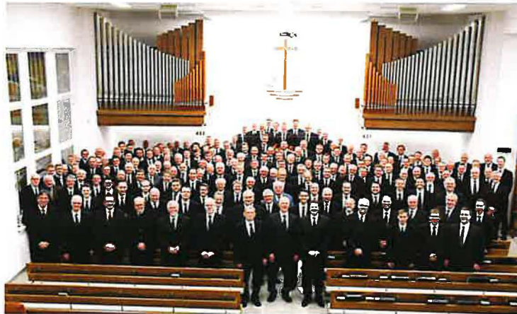
Amtsträger und Amtsträger i.R. des Bezirks nach einem Ämtergottesdienst im Januar 2015 in Kassel-Nordost

Dies wird auch in den folgenden Chroniken der jeweiligen Bezirke deutlich.