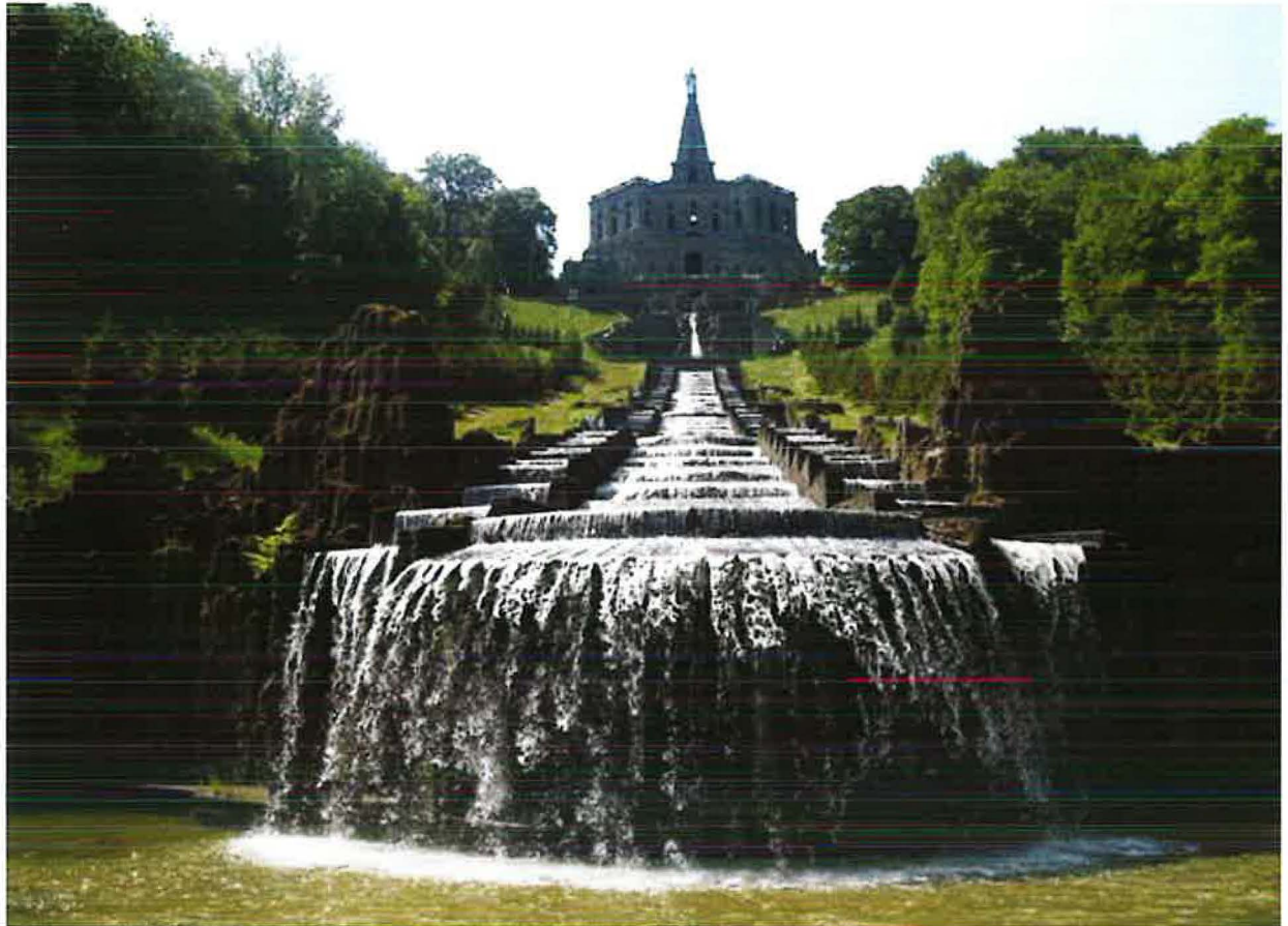
Herkules mit Kaskaden © Stadt Kassel; Foto: Elke Bremer