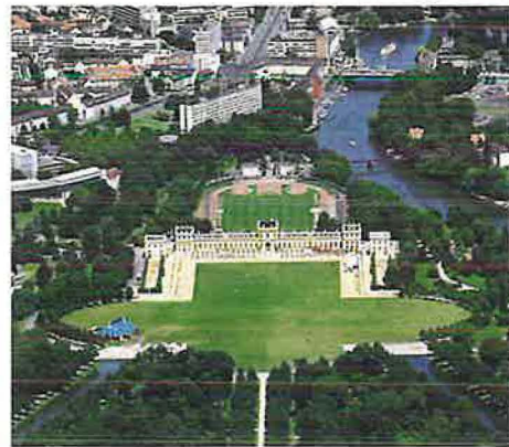
Karlsaue mit Orangerie