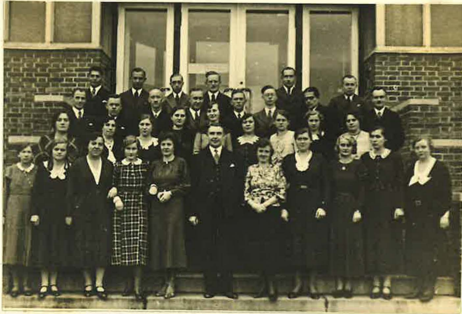
Chor der Gemeinde Bettenhausen

Im Laufe der Jahre nahm die Gemeinde einen starken Aufschwung, zählte sie doch im Jahre 1936 ungefähr 185 Seelen und im Jahre 1943 war die Zahl von 66 bereits auf 210 gewachsen. Apostel Buchner bezeichnete die Gemeinde während eines Dienstes, den er in Bettenhausen hielt, als Bethanien. Nachdem im Herbst 1941 das Lokal Nord-Ost beschädigt war, zeigte sich die große Gastfreundschaft von Bettenhausen. Da konnte man wirklich sagen: Geduldige Schafe gehen viele in den Stall. Genauso war es, als in Nord-Ost nach dem 3.10.1943 wegen schwerer Beschädigung keine Gottesdienste mehr gehalten werden konnten.