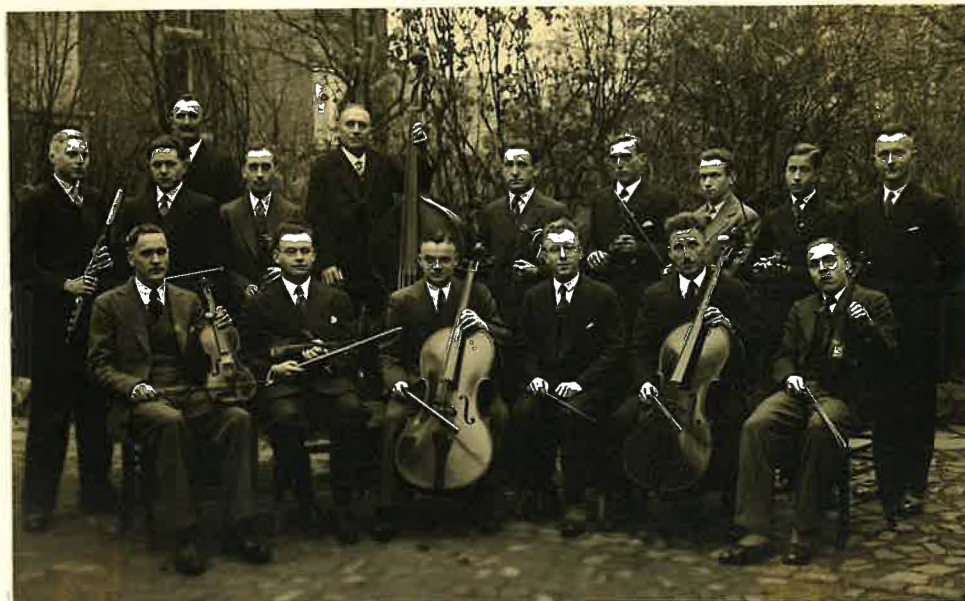
Streichchor Gemeinde Mitte

etwa 20 Spieler. Jedoch wurden die Chöre laufend geschwächt, einmal durch Amtseinzetzungen, die fast alle aus den Chören heraus erfolgten und zum anderen auch durch Teilungen der Stammgemeinde wegen der andauernden Raumfrage.