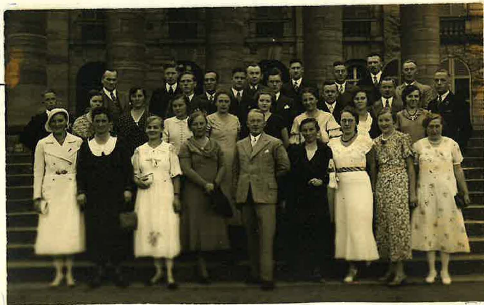
Chor der Gemeinde Wilhelms- höhe