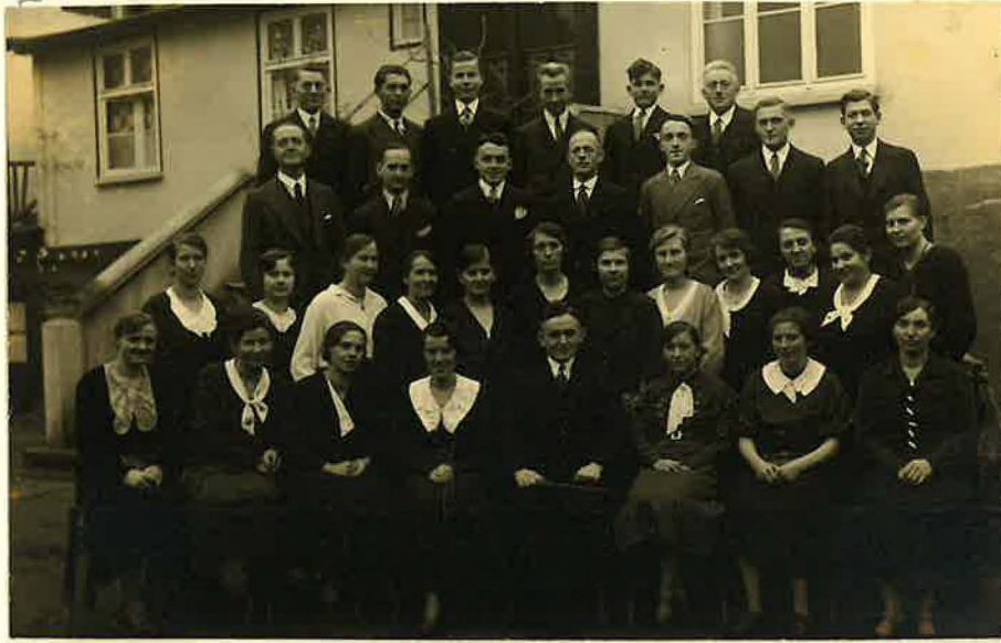
Chor der Gemeinde Rothenditmold