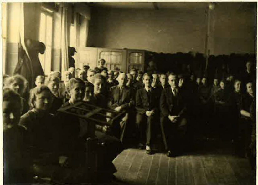
Innenansicht der Gemeinde Bettenhausen

Im Laufe der Jahre nahm die Gemeinde einen starken Aufschwung, zählte sie doch im Jahre 1936 ungefähr 185 Seelen und im Jahre 1943 war die Zahl von 66 bereits auf 210 gewachsen. Apostel Buchner bezeichnete die Gemeinde während eines Dienstes, den er in Bettenhausen hielt, als Bethanien. Nachdem im Herbst 1941 das Lokal Nord-Ost beschädigt war, zeigte sich die große Gastfreundschaft von Bettenhausen. Da konnte man wirklich sagen: Geduldige Schafe gehen viele in den Stall. Genauso war es, als in Nord-Ost nach dem 3.10.1943 wegen schwerer Beschädigung keine Gottesdienste mehr gehalten werden konnten.