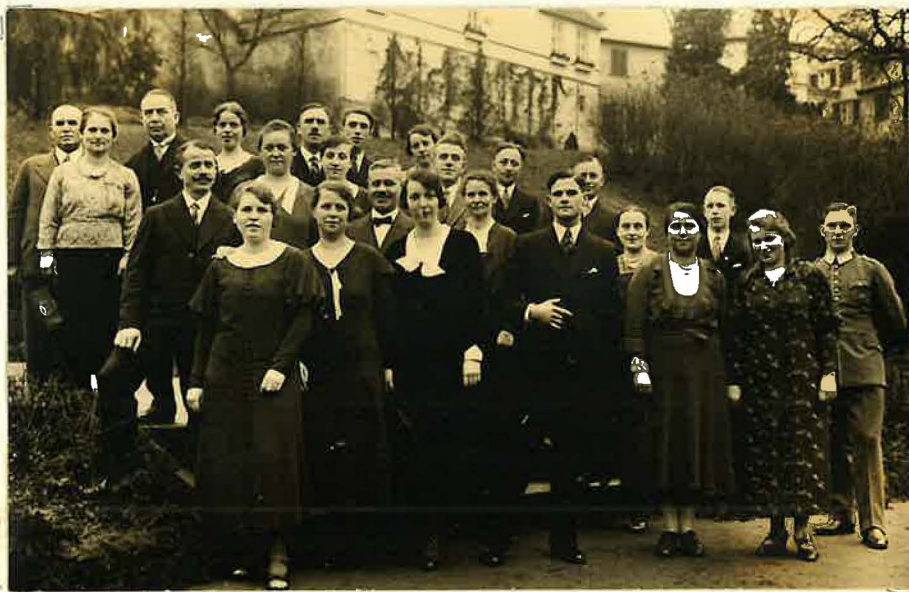
Chor der Gemeinde Niedierzwehren