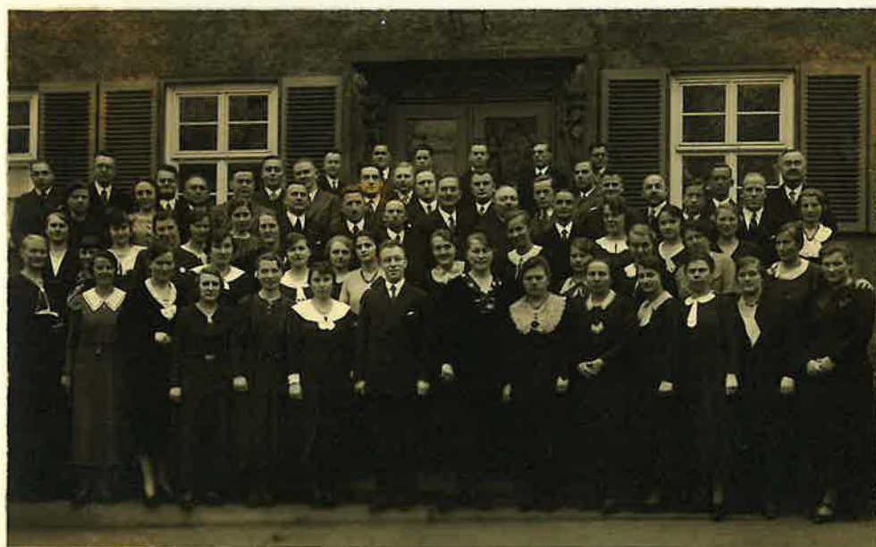
Gemischter Chor der Gemeinde Mitte

So entstanden als selbständige Gemeinden aus Kassel-Mitte neben Nord-Ost noch Wilhelmshöhe, Rothenditmold und Niederröhren und immer mußten sowohl der Gesang-, als auch der Streichchor von neuem aufgebaut werden. In mühevoller, langwieriger Arbeit, schreibt Bruder Schwarz die Noten für die Chöre und schafft die Voraussetzung für eine segensreiche Auswirkung des Gesanges auf die Gemeinde und im besonderen auf deren Gäste.