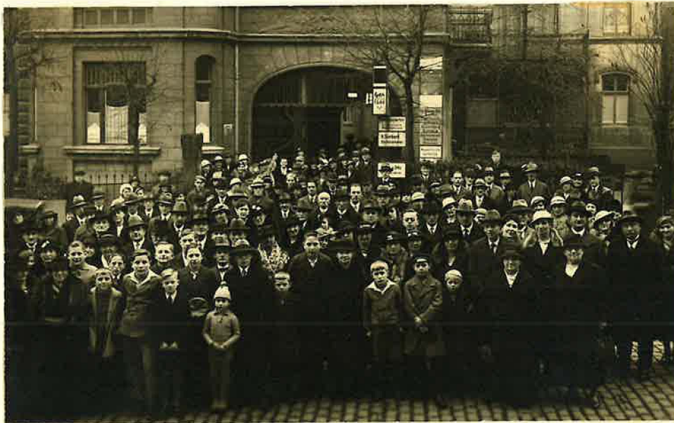
Gemeinde Mitte vor dem Lokal

Gegen Ende der 20er Jahre wurde auch eine Erneuerung des Lokales notwendig und im Rahmen dieser äußeren Verschönerung, wurde der bisherige Altar durch einen zweckmäßigeren, der auf einem Podium erhöht zu stehen kam, ersetzt. Ebenso wurde das Amterzimmer, welches bisher aus einem, vom Lokal abgeteilten hinteren Raum bestand, in die Stube oberhalb des Lokales verlegt.