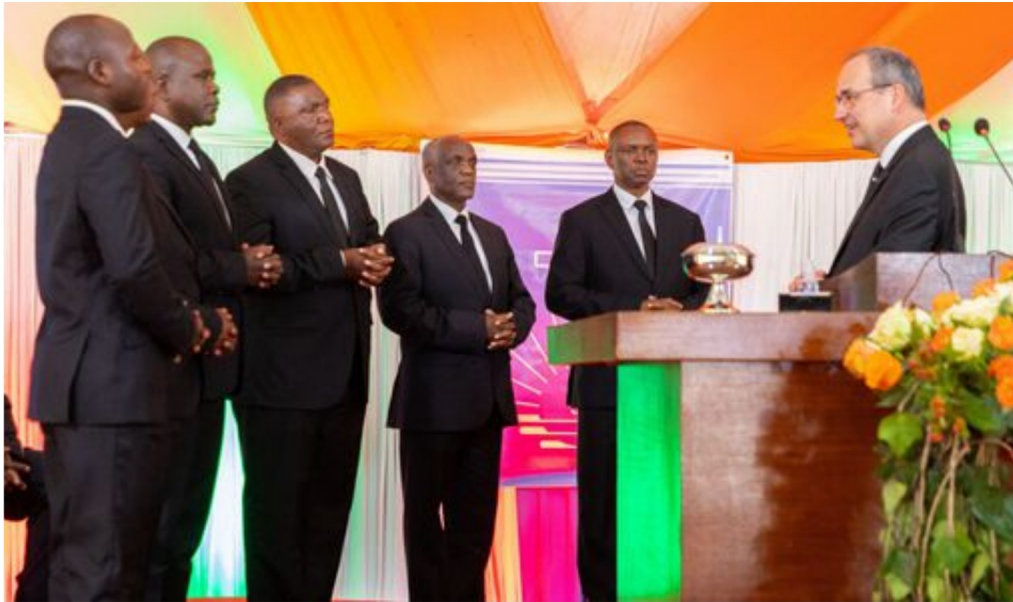
Ordinationen in Lodwar (Kenia)