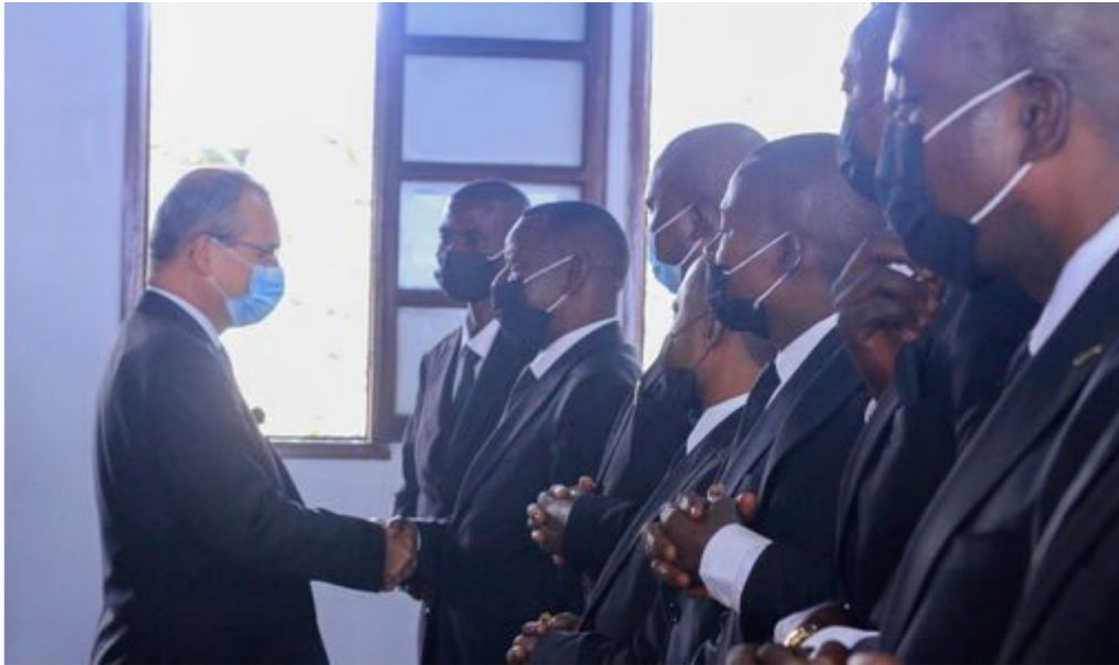
Ordinationen und Ruhesetzungen in Goma (DR Kongo Südost)