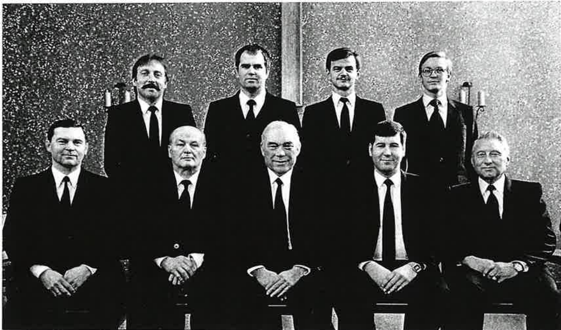
Amtsbrüder der Gemeinde Linden-Großen-Linden

Zur Zeit wirken in Großen-Linden fünf Priester und vier Diakone. Die Gemeinde besteht Anfang 1984 aus 115 Seelen.