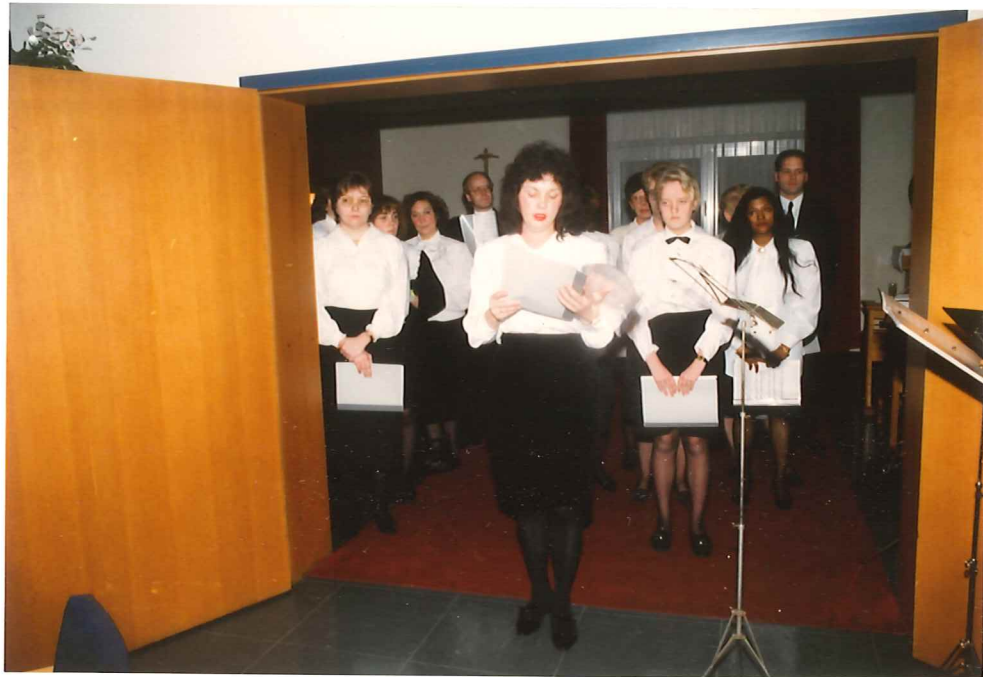
Festliches Chorsingen im Altenheim Elsdorf