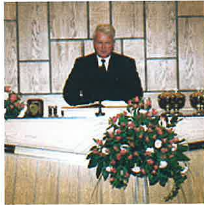
Apostel Gunter Homburg