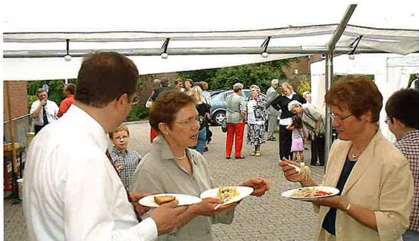
Nach dem Gottesdienst ist auch für das leibliche Wohl gesorgt