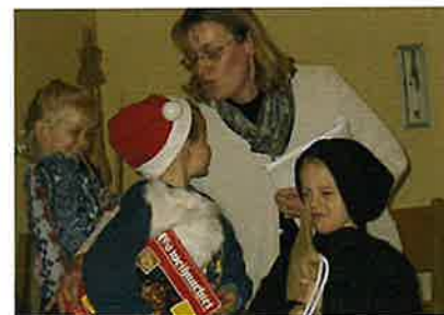
Vorsonntagsschulkinder freuen sich über die Geschenke

Anschließend werden die Kinder und die Senioren mit einer Kleinigkeit erfreut. Es haben sich 102 Geschwister eingefunden.