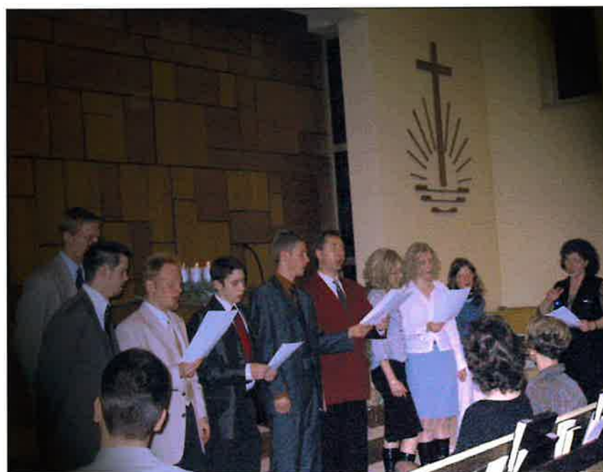
Der Vortrag durch Gesang unserer Jugend erfreut alle

Zur Weihnachtsfeier für die Geschwister haben sich Kinder der Vor- und Sonntagsschule und die Jugend ein schönes, beschauliches Programm einfallen lassen. Durch Vortrag, Flötenspiel und Gesang wird viel Freude hervorgerufen.