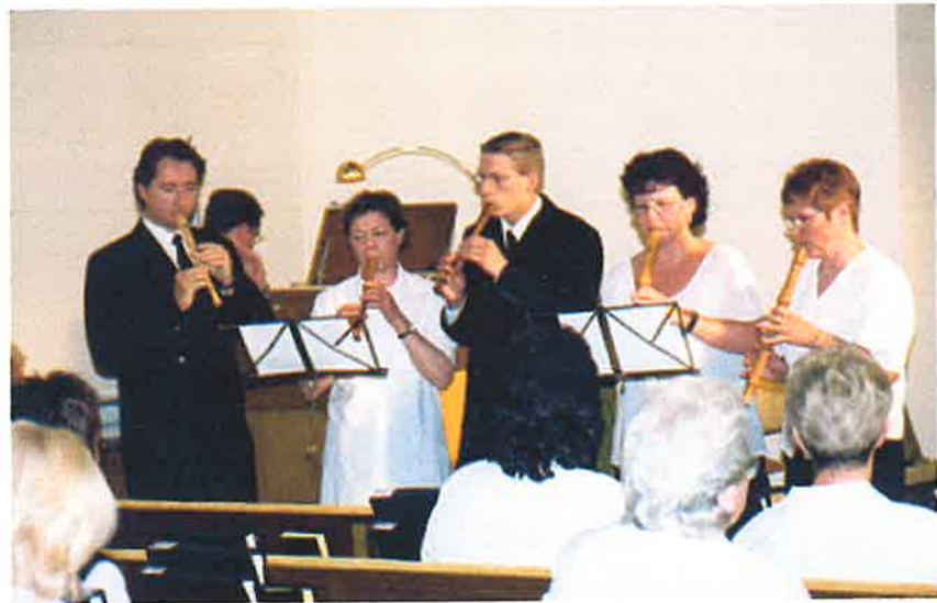
Unsere Instrumentalisten bereiten die Herzen auf den Bezirksapostel vor.

Diese Stunde leiten Brüder aus dem Bezirk Essen-Süd.