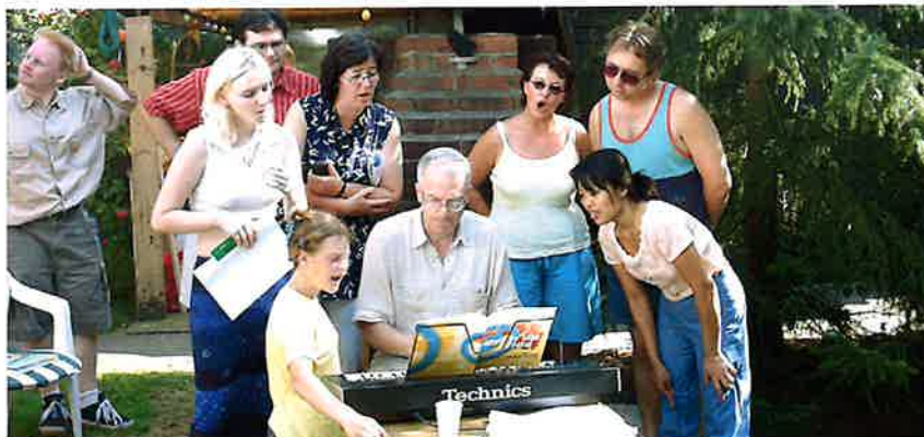
Unser Vorsteher spielt auf dem Keyboard und alle singen lustig mit