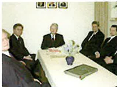
Vor dem Gottesdienst im Ämterzimmer