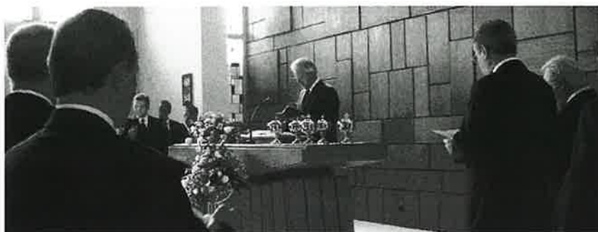
Apostel Homburg am Altar