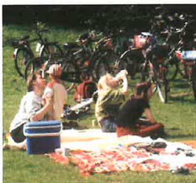
Rast auf der Grill- und Spielwiese

Dort verbringen ca. 80 Personen den Tag mit Grillen, Spielen und vielen Gesprächen.