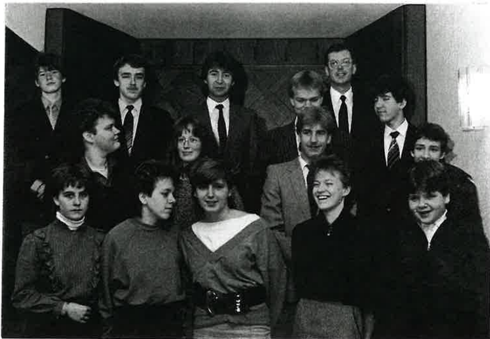
Die Jugend mit ihrem Jugendführer 1986

Das Adventssingen löste viel Freude aus. Es fand am 14.12.86 statt. Der Chor der Gemeinde, verstärkt durch den Chor der Gemeinde Bochum und die Spieler erfreuten ein volles Gotteshaus mit 135 Geschwistern und 63 Gästen. Es konnten neue Kontakte zu den eingeladenen Gästen geknüpft werden. Die Feierstunde für die älteren Geschwister und die Vorsonntagsschul- und Sonntagsschulkinder fand am Sonntag, dem 21.12.86 nachmittags statt. Die Jugend und die Kinder haben in besonders herzlicher Mitarbeit durch Spiel, Gesang und Vortrag diese Stunde mit ausgerichtet. Im Anschluß an den Gottesdienst wurden die älteren Geschwister noch mit Kaffee und Kuchen erfreut.