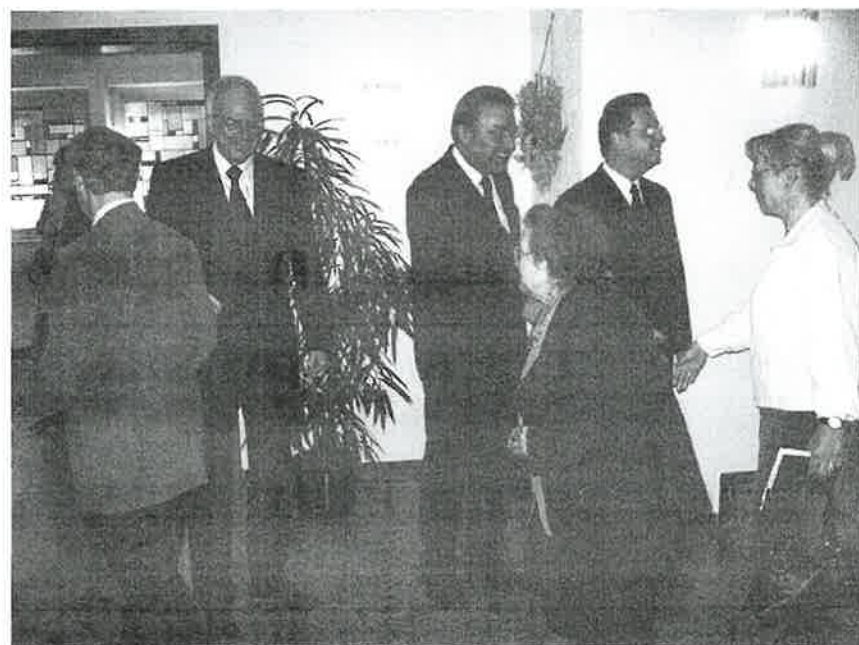
Herzliche Verabschiedung nach dem Gottesdienst