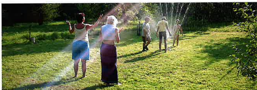
Ein Wasserschlauch sorgt für erfrischende Abkühlung