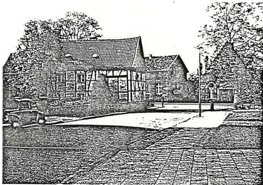
1899-1904, Langendreer, Kurze Straße