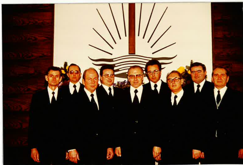
Die Brüder 1974