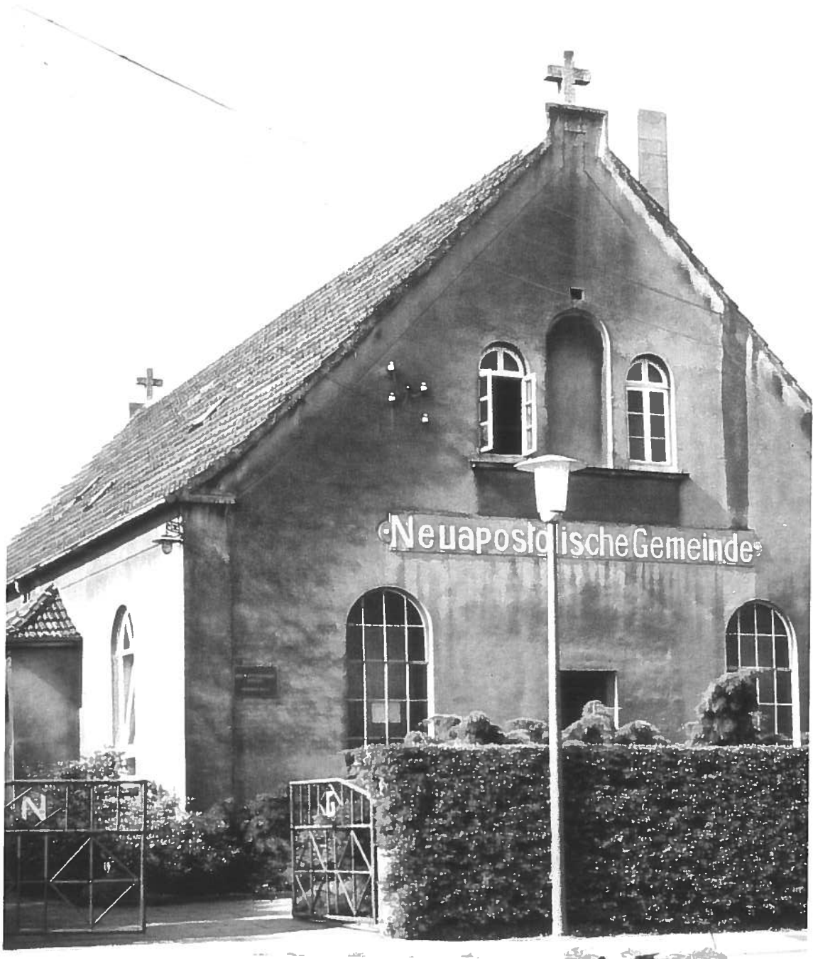
Vorderansicht der Kirche in Sieker (1924-1968)