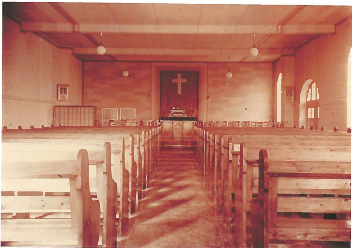
Innenansicht der Kirche in Sieker (1924-1968)