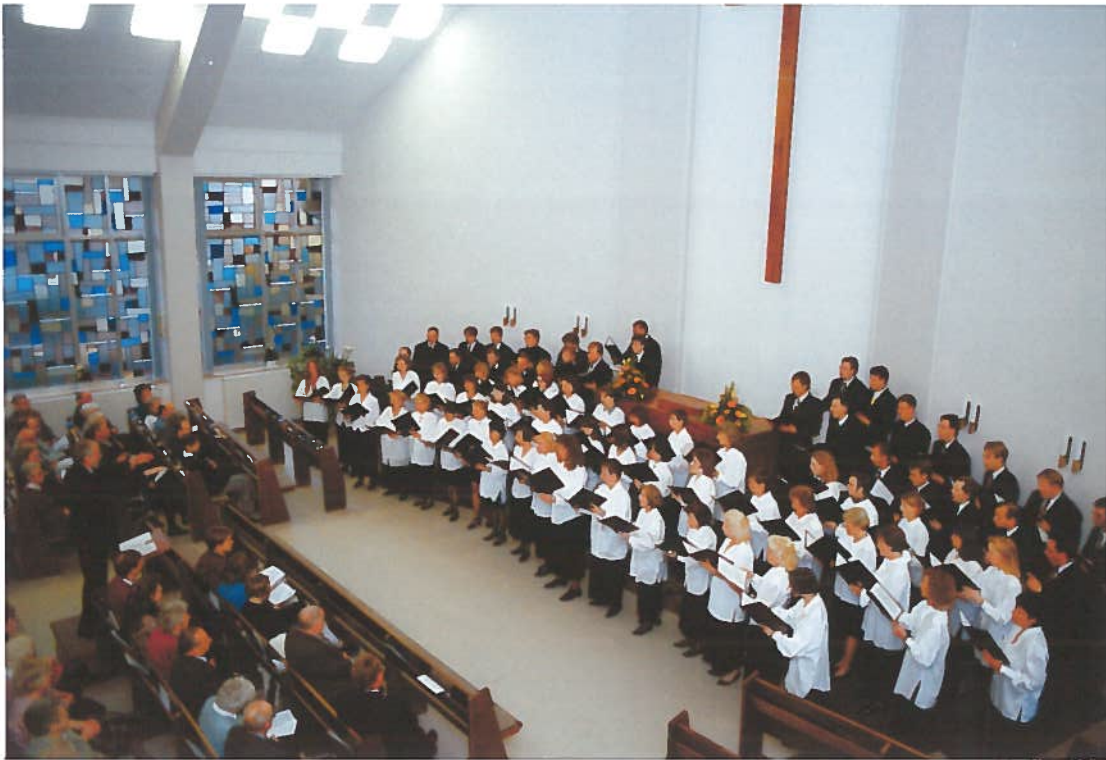
Konzert des Bezirkschores am 1. November 1998