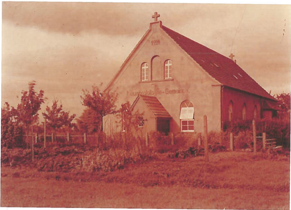
Hinteransicht der Kirche in Sieker (1924-1968)