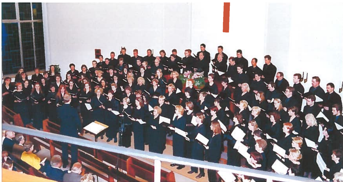
Konzert des Bezirkschores am 3. Februar 2002