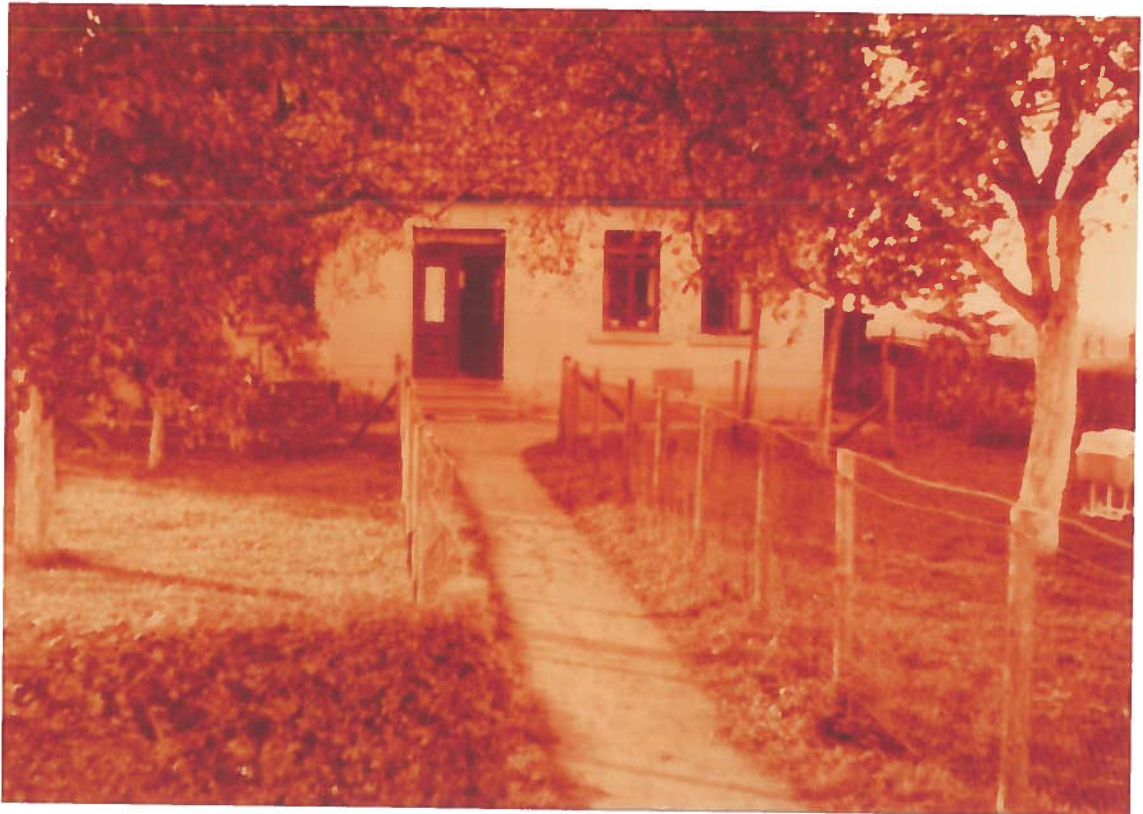
Haus Krüger ca. 1913