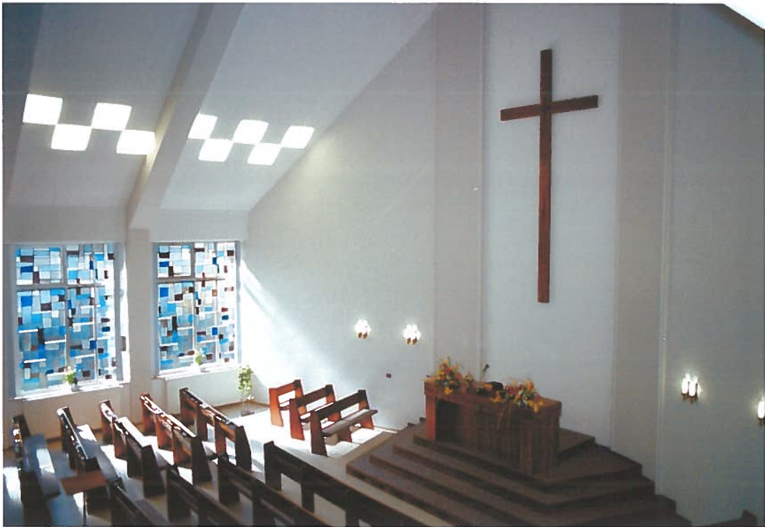
Innenansichten nach der Renovierung