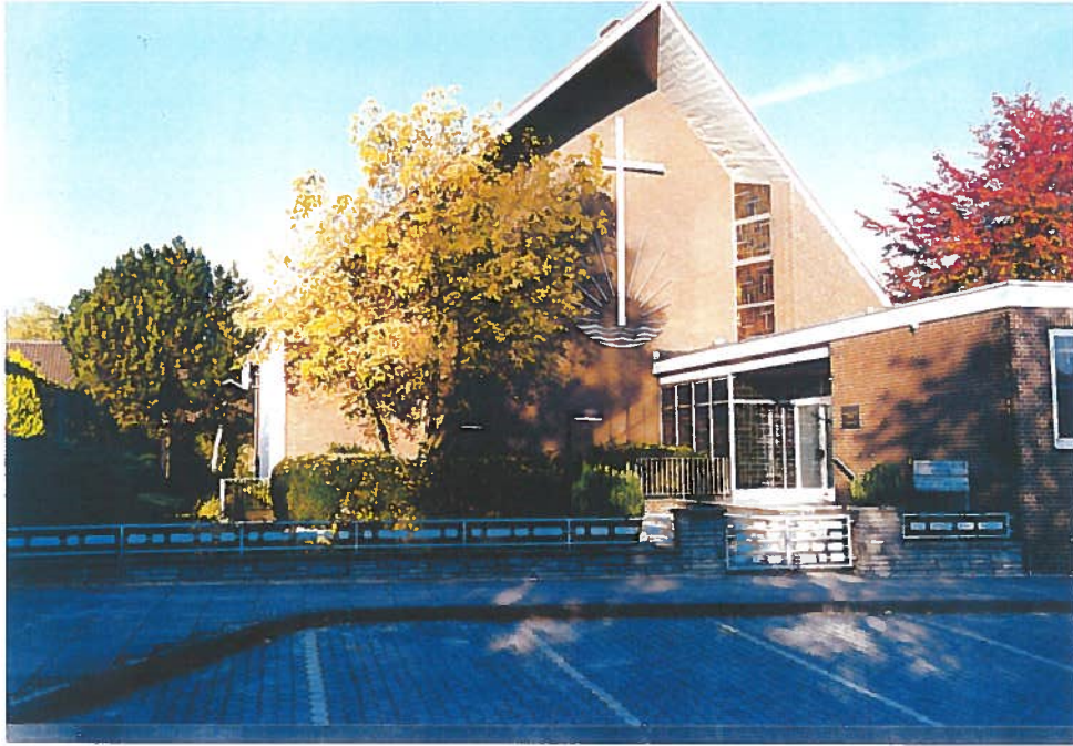
Die neue Kirche 1969