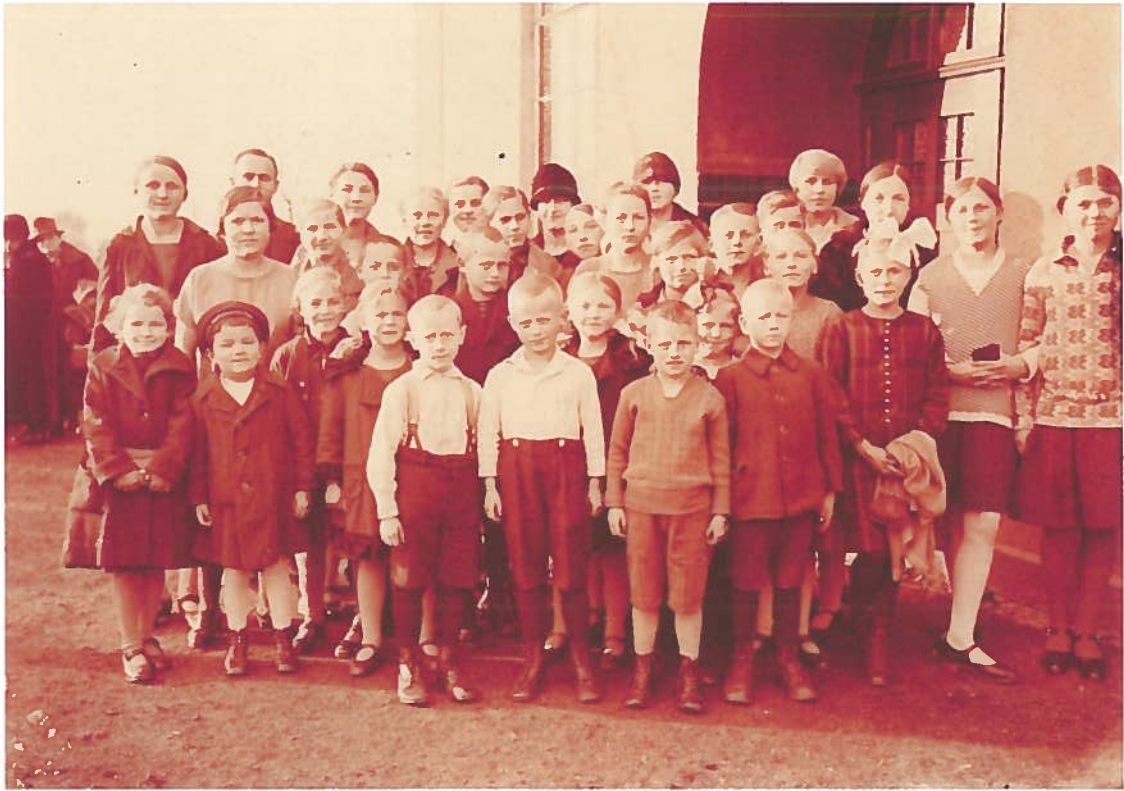
Sonntagsschule Sieker ca. 1928