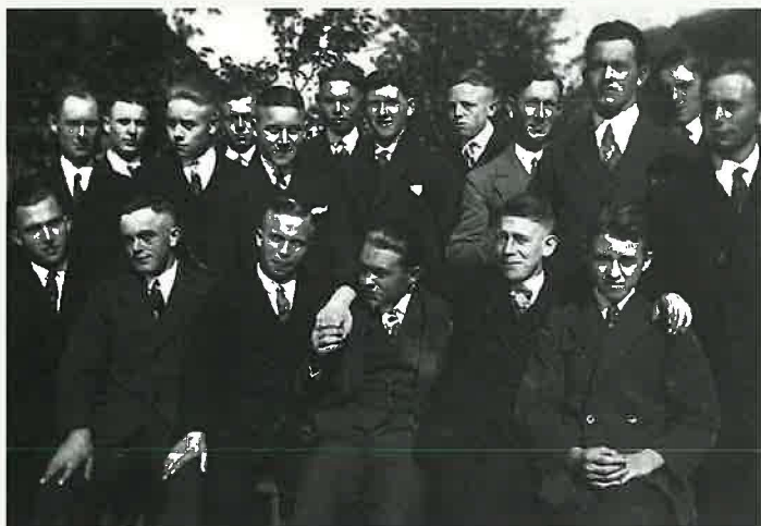
Gruppenbild der Jugend 1930