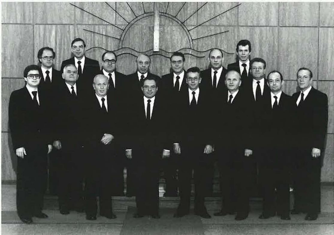
Amtsbrüder der Gemeinde im Jahre 1979