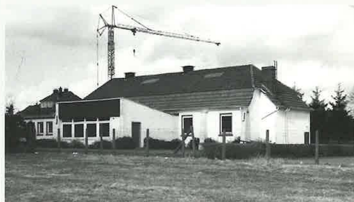
Kurz vor Abbruch des Hauses Kammerratsheide Nr. 6

Die 1926 errichtete Kirche zeigte jedoch in den letzten Jahren erhebliche Mängel, was den Bez. Apostel Engelauf veranlasste, der Gemeinde ein neues Kirchengebäude zu geben.