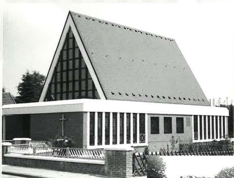
Die Neuapostolische Kirche