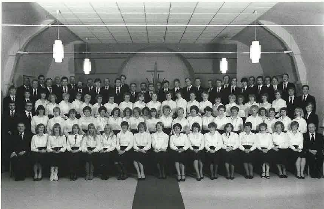
Chor 1983 der Gemeinden Kammerratsheide und Brake