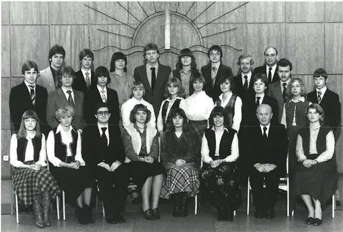
Gruppenbild der Jugendlichen 1979