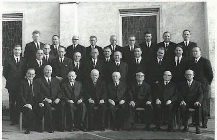
Amtsbrüder der Gemeinde einschließlich i.R.