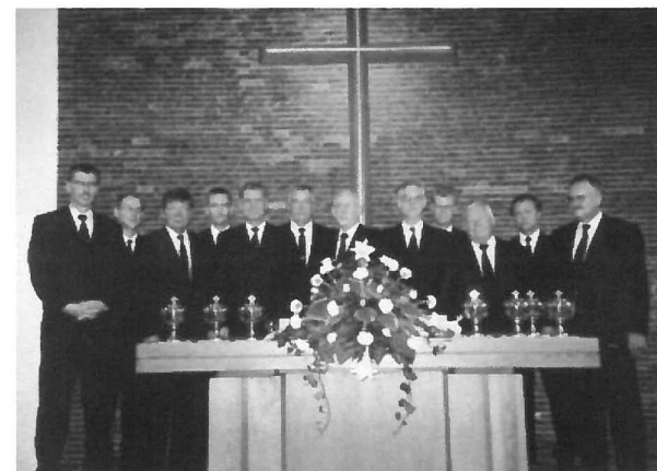
Amtsträger der Gemeinde Bad Hersfeld 1996