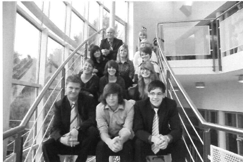
Die Jugend der Gemeinde im Jahr 2010