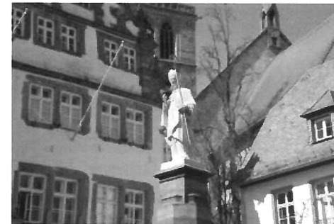
Statue des Mönchs Lullus