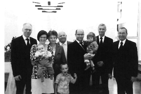
Goldhochzeit und Taufe