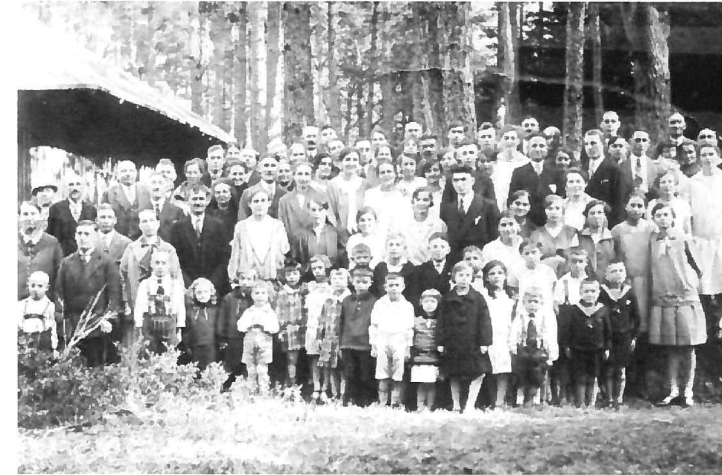
Die Gemeinde im Jahr 1928