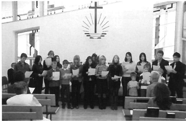
Kinder und Jugendliche im Jahr 2008