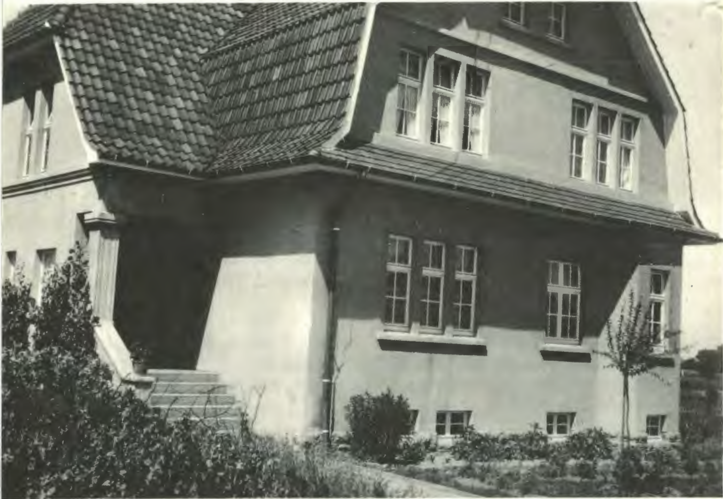
Haus Althoff, Ubbedissen, Am Bollholz 170