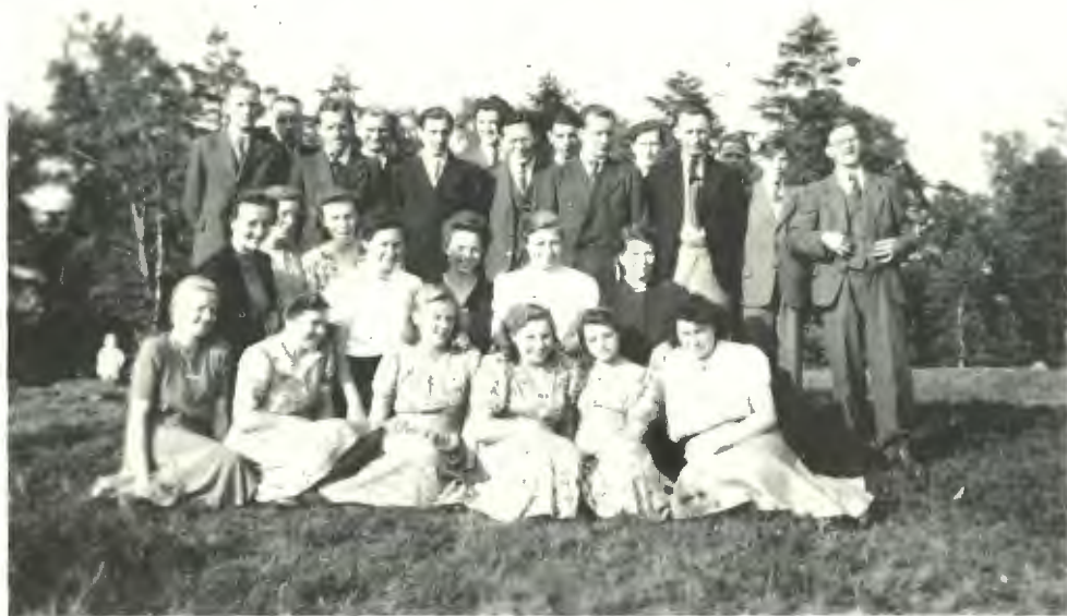
Der Bielefelder Bläserchor auf dem Tönsberg