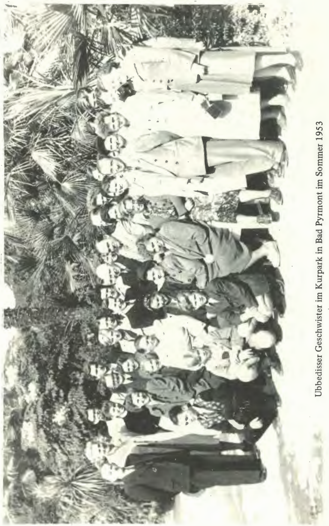
Ubbedisser Geschwister im Kurpark in Bad Pyrmont im Sommer 1953