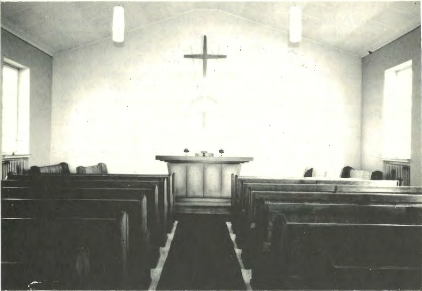
Innenansicht unserer Kirche in Asemissen (vom Eingang her gesehen)