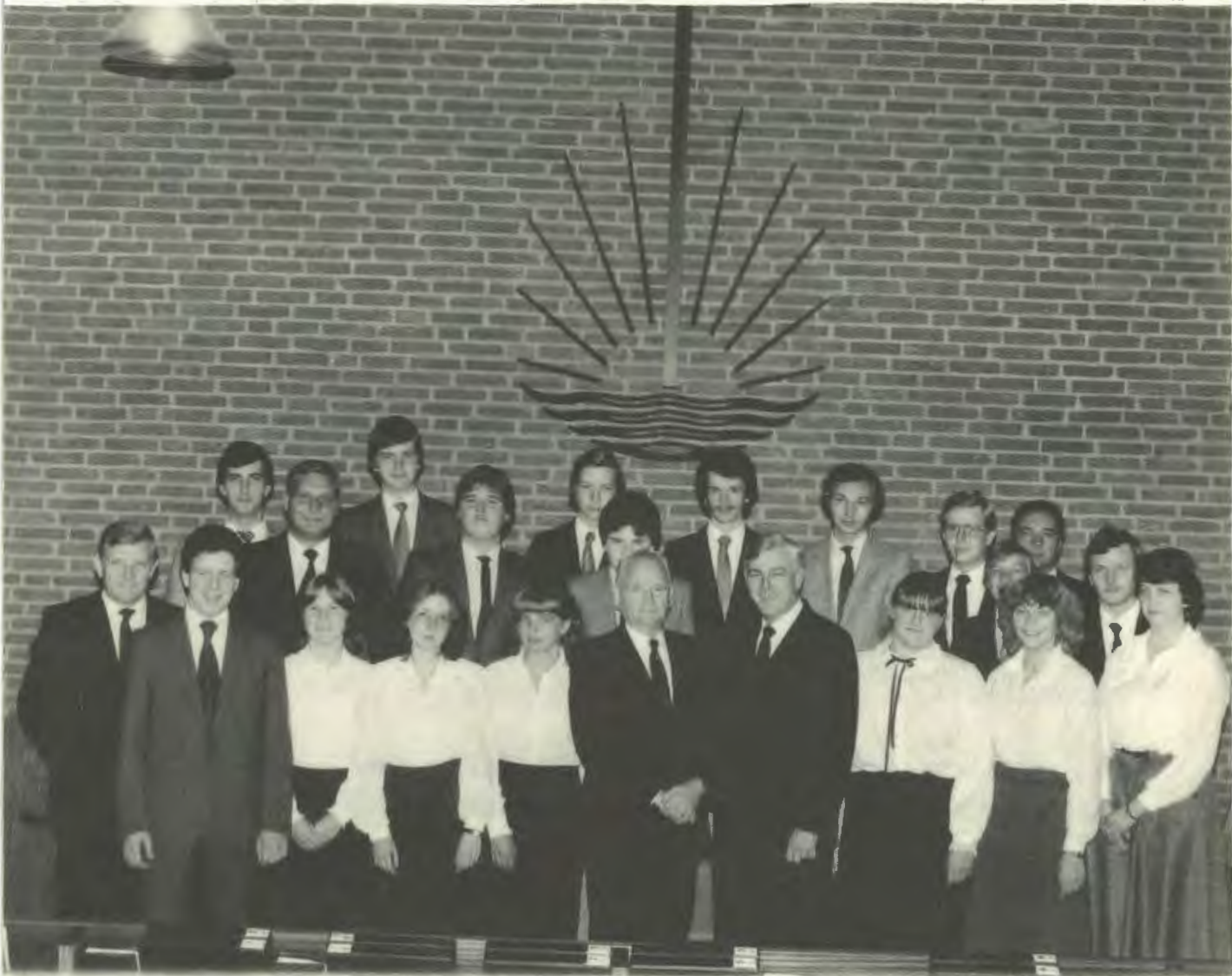
Die Jugend von Leopoldshöhe-Asemissen und Oerlinghausen mit dem Bezirksältesten und dem Vorsteher sowie den Jugendleitern im Oktober 1981