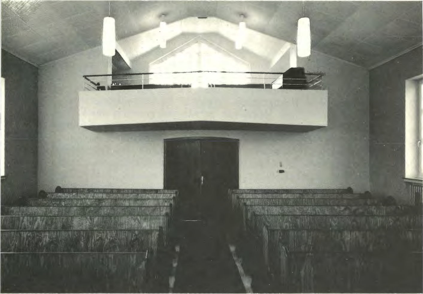
Innenansicht unserer Kirche in Asemissen (vom Altar aus gesehen)