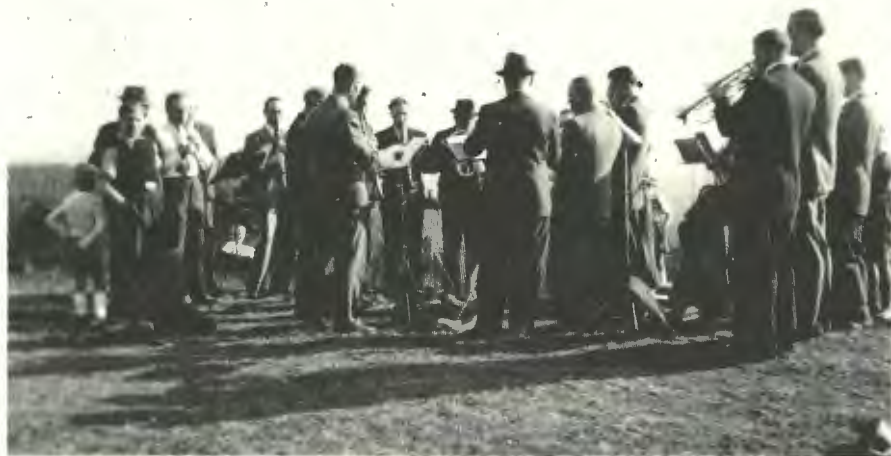
Der Ubbedisser Chor auf dem Tönsberg