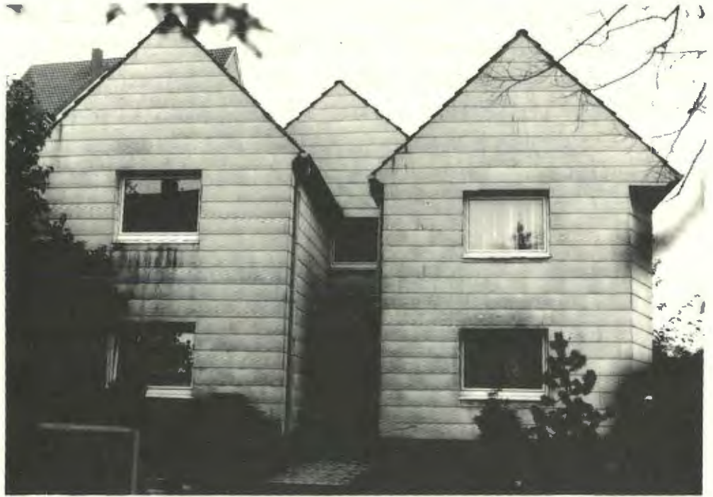
Haus der Geschwister Kramer in Oerlinghausen, Tönsbergstraße 5