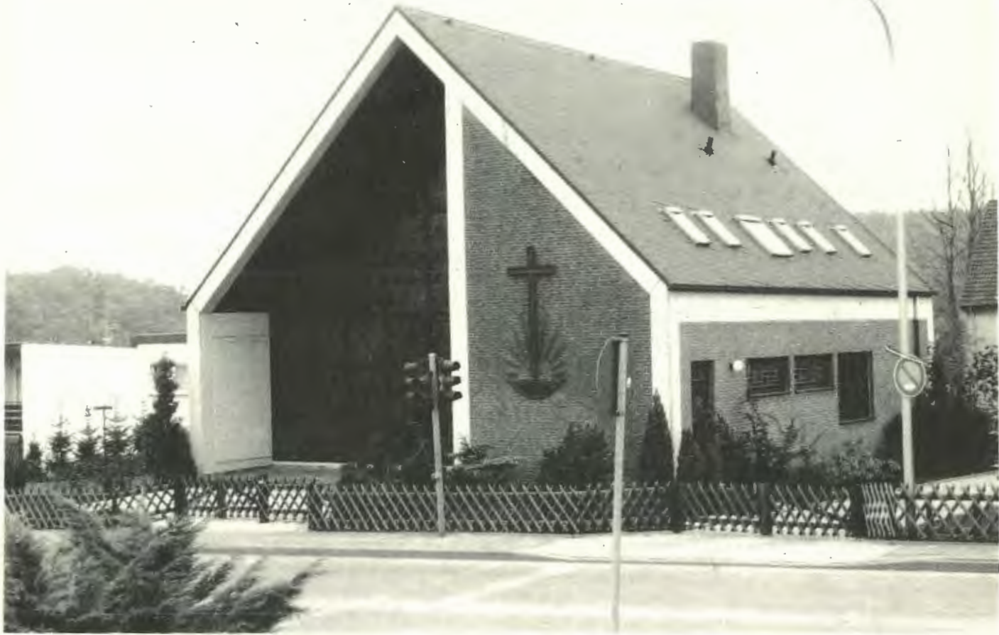
Unsere Kirche in Oerlinghausen