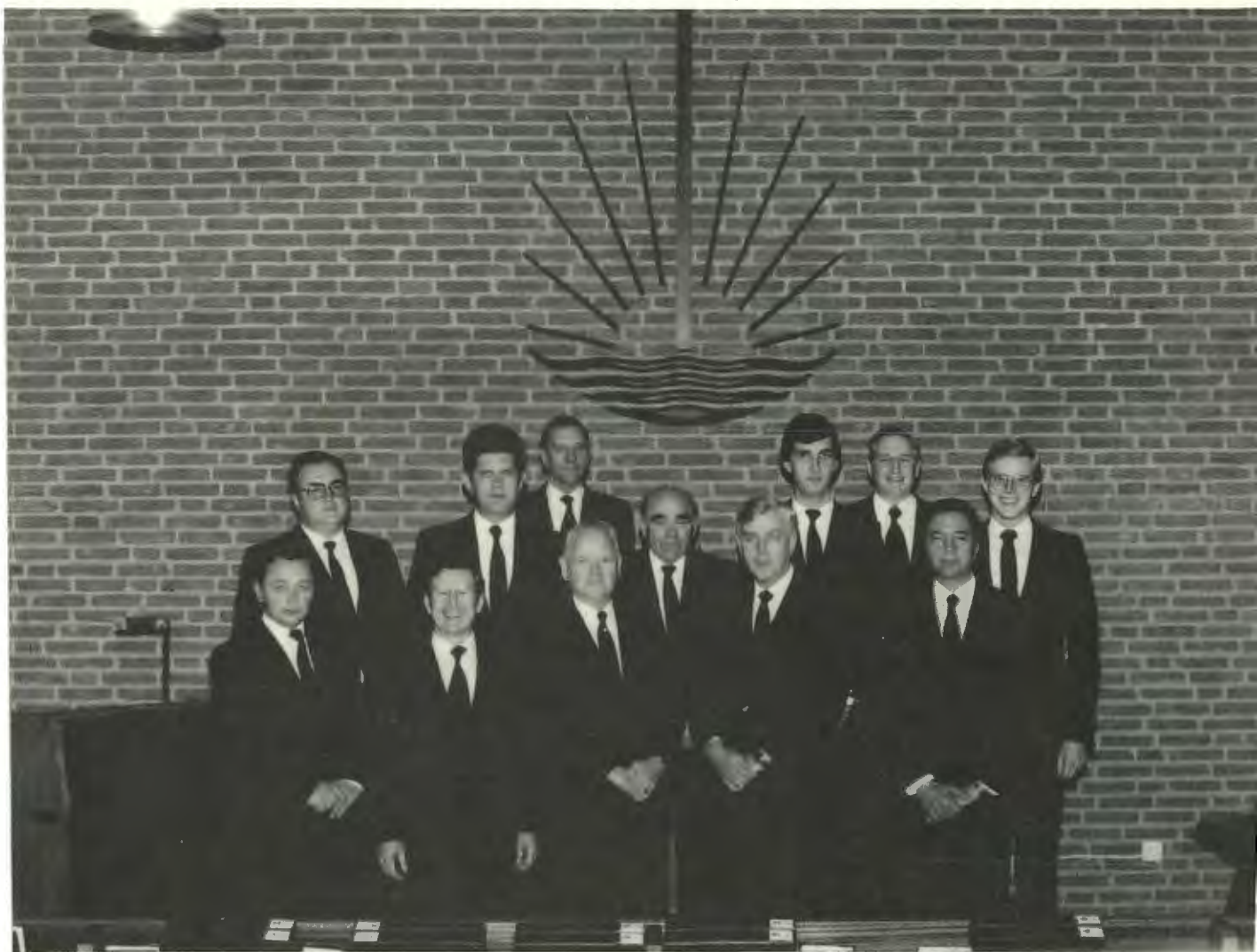
Die Amtsbrüder der Gemeinde Leopoldshöhe-Asemissen im Oktober 1981