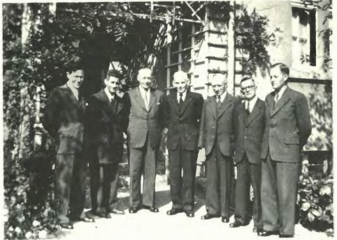
Amtsbrüder vor der Kirche in Ubbedissen