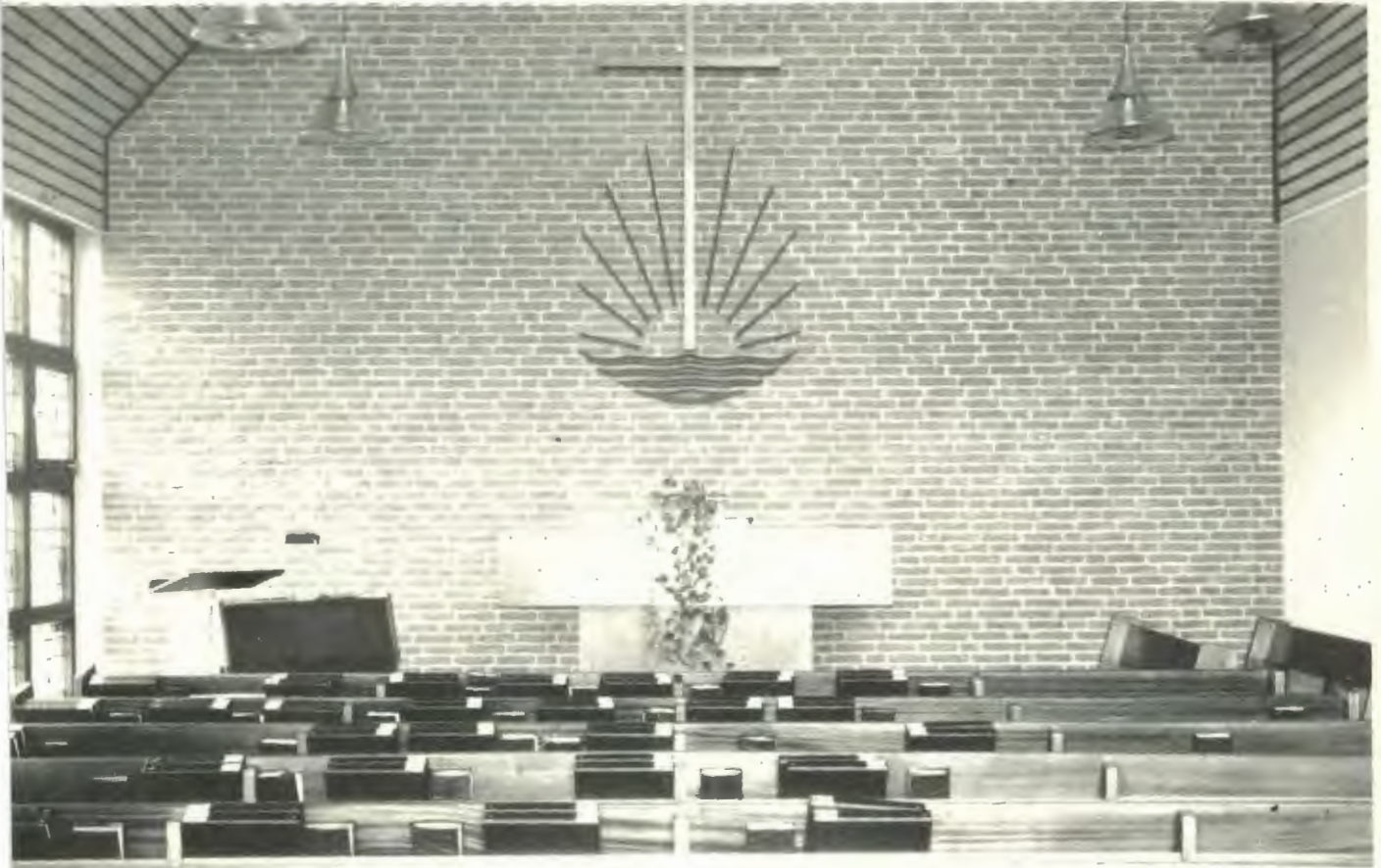
Innenansicht unserer Kirche in Oerlinghausen