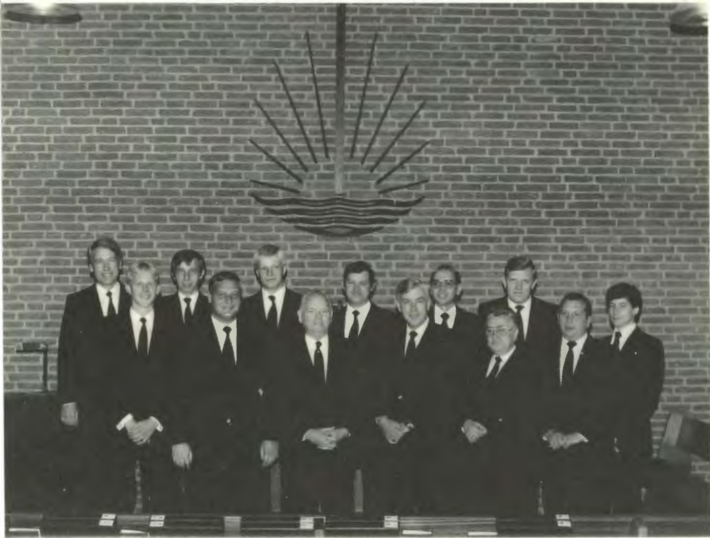
Die Amtsbrüder der Gemeinde Oerlinghausen im Oktober 1981