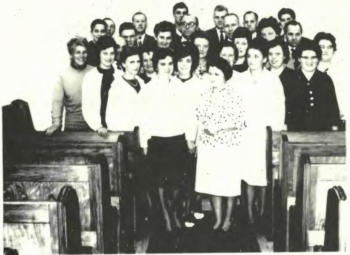
Chor in Asemissen 1964