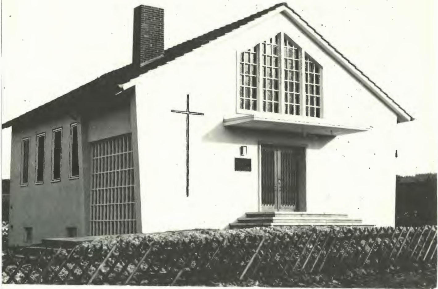
Unsere Kirche in Asemissen