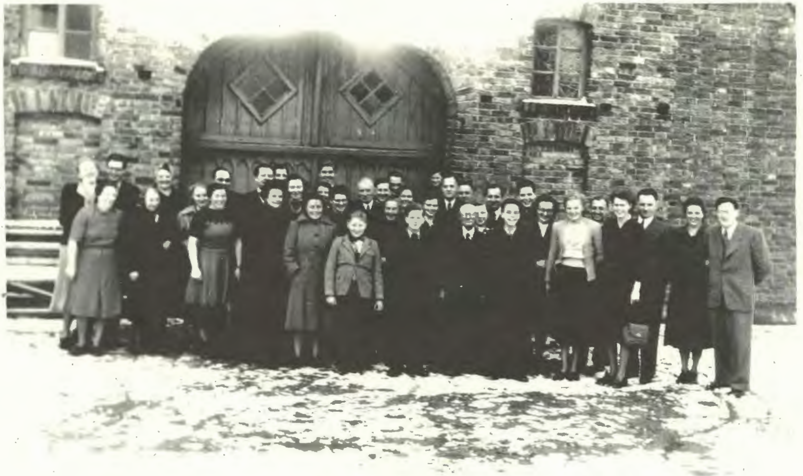
Ausflug nach Hankenberge im November 1951