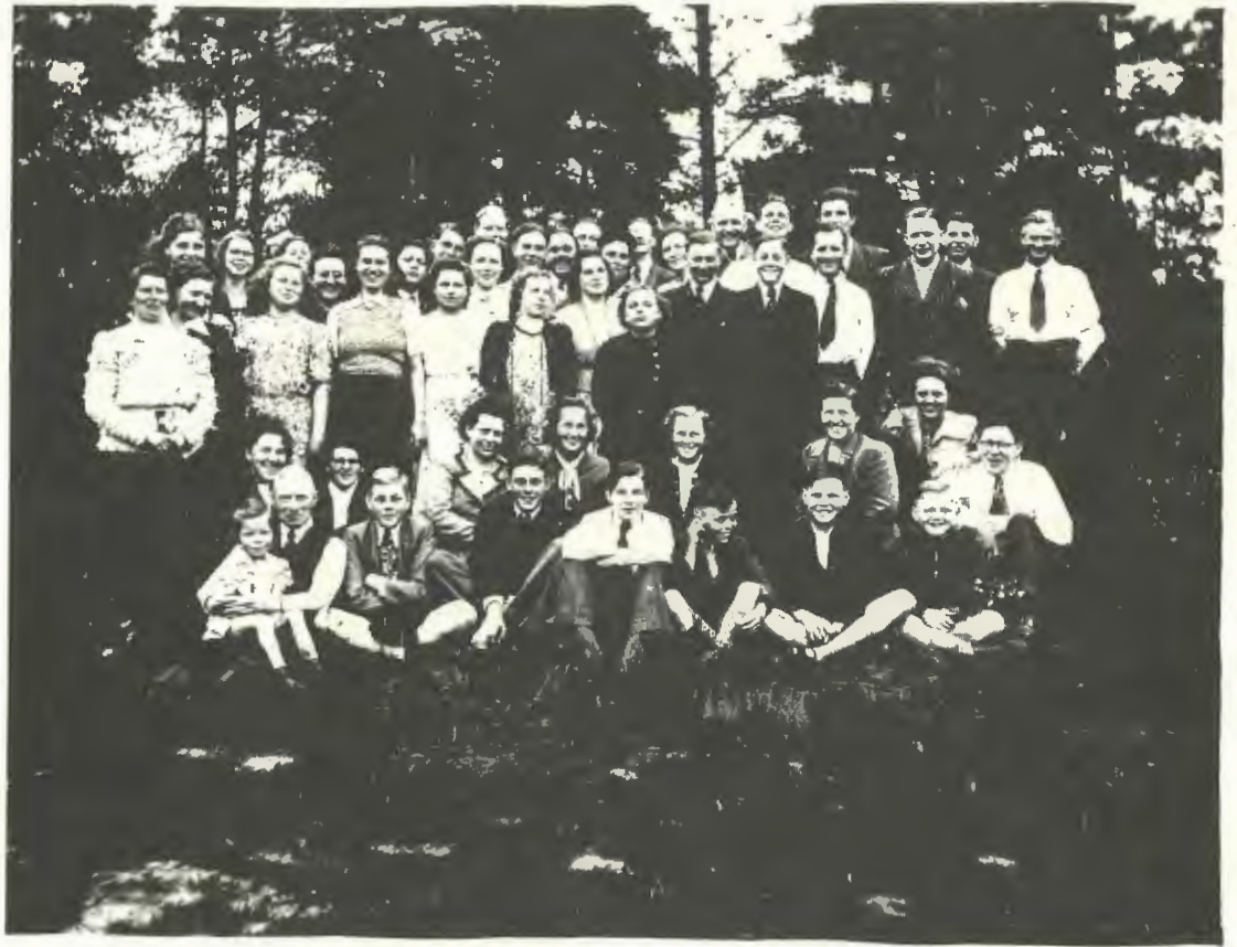
Bei den Rethlager Quellen