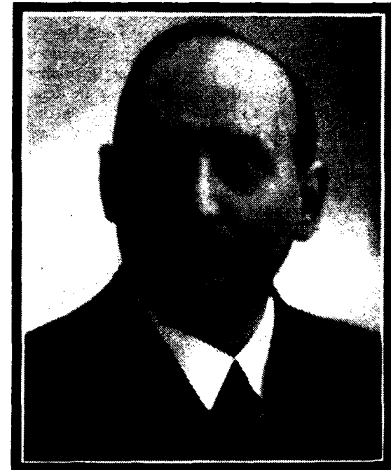
Apostel Emil Buchner +