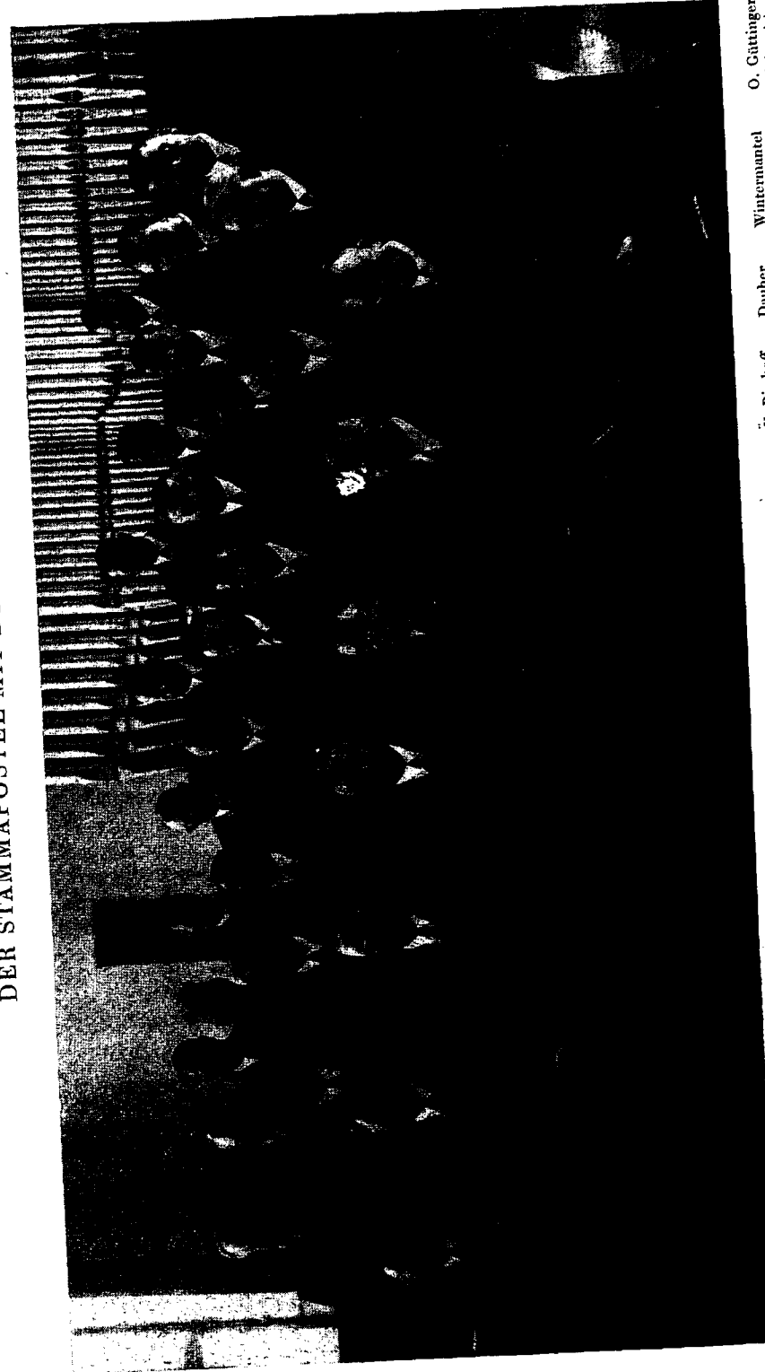
DER STAMMAPOSTEL MIT DEN APOSTELN:

Nach dem Gebet und Verlesen des Bibelwortes stellt der Stammapostel zuerst die erschienenen überseeischen Gäste der versammelten Gemeinde vor. Der vortreffliche Sängerkhor hat für alle Anwesenden: „Sei du mein Vater, sei mein Berater!“ Ja, wir sind alle gekommen, um die für unsere Zeit allein maßgeblichen Ratschläge aus dem Munde des uns von Gott gesandten Rätgebers hinzunehmen. Wir stehen vor dem größten Ereignis der Zukunft, der Stammapostel erwartet den Herrn täglich, und die aus ihm Leben und