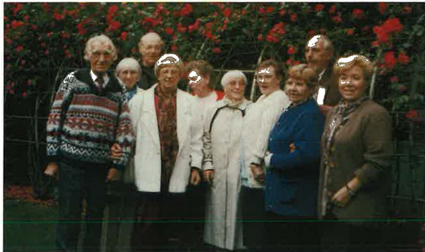
Die Senioren der Gemeinde im Jahre 1996