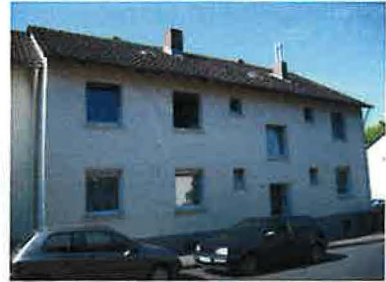
Am Jungholz 4 (Aufnahme: 2007)