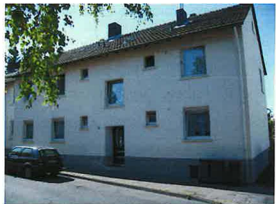
Am Jungholz 4 (Aufnahmejahr: 2007)

Das Wohnzimmer wurde ausgeräumt, die Küche zum Ämterzimmer umfunktioniert und das Schlafzimmer, nachdem die Betten abgeschlagen waren, diente als „Möbellager“. So war das nicht nur für den