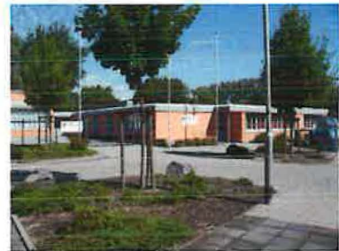
Ehemaliges Gymnasium (Aufnahme: 2007)

Im städtischen Gymnasium „Im Ruhrfeld“ hat die Gemeinde eine neue Gottesdienststätte gefunden. Die Chorproben finden in der Wohnung der Familie Hacker statt.