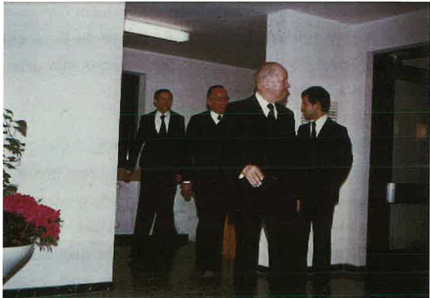
Von links nach rechts:

von der kleinen Herde, nur wenige, die es im Glauben erfasst haben. Viele haben ihn auch noch verlassen. Aber es war doch so, dass aus dem Kleinen nachher gewaltige Scharen wurden, die das Zeugnis überall hingetragen haben.