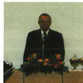
Bez. Apostel Ehlebracht

Gottes ist auch unser Vorbild, darum wollen wir von ihm lernen ( Matthäus 11, 29 ).