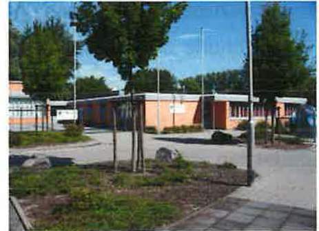
ehemaliges städtisches Gymnasium (Aufnahme: 2007)

Ab dem 1. Juni 1970 konnte dann im „Städtischen Gymnasium“ im Ruhrfeld für sonntags Vormittags und mittwochs Abends ein Raum für die Gottesdienste angemietet werden. Zu diesem Zeitpunkt war die Gemeinde auf 47 Mitglieder angewachsen. Für den Nachmittagsgottesdienst war wieder die Fahrt nach Bonn-Bad Godesberg angesagt. Damit nicht auch noch für die Chorproben die weiten Wege bewältigt werden mussten, stellten bis April 1977 die Geschwister Hacker hierfür ihre Wohnung in Wachtberg-Adendorf zur Verfügung.