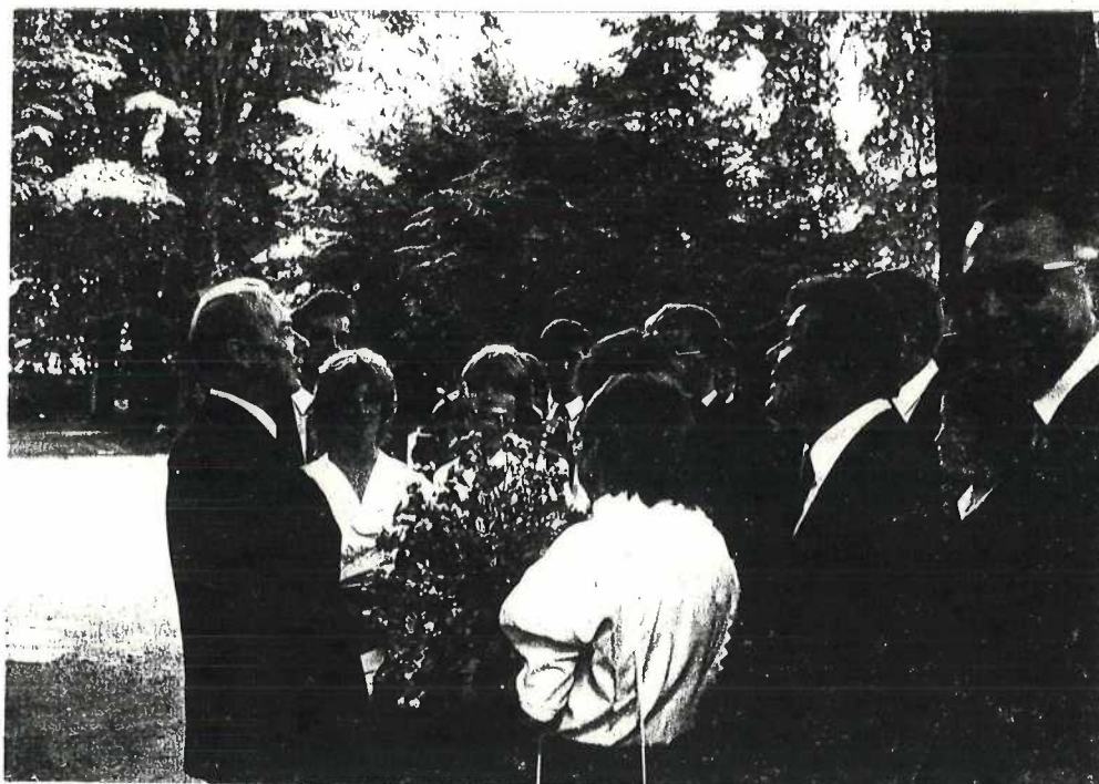
Der Bezirksevangelist mit der Jugend auf dem Westfriedhof