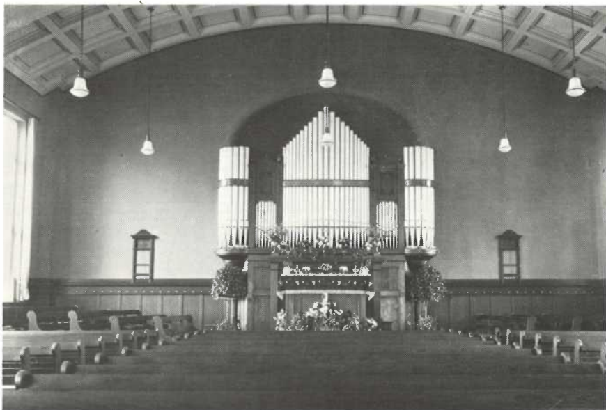
Der Altar und Orgel in Frankfurt-West am 16. 10. 1927