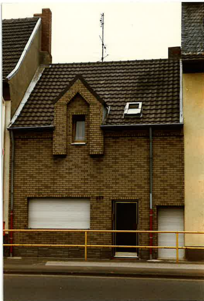
Neue Vorderansicht von 1986