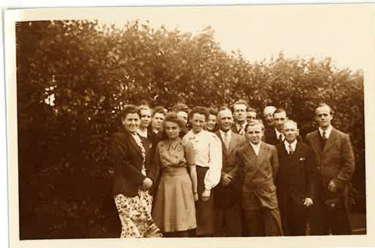
Jugend von Worringen 1947