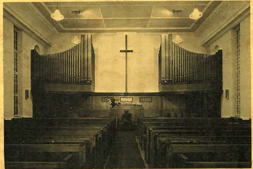
Innenansicht der Kirche in der Birresborner Straße (1955)

Anfang der fünfziger Jahre wurden Pläne für einen Kirchenneubau entwickelt. An der Kreuzung Birresborner Straße / Kermeterstraße konnte ein geeignetes Grundstück käuflich erworben und ein großzügiges, für damalige Zeitverhältnisse repräsentatives Kirchengebäude errichtet