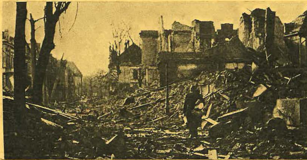
Das zerstörte Lindenthal, in unmittelbarer Nachbarschaft des Gotteshauses