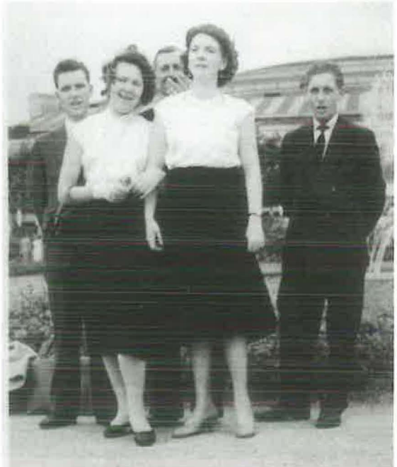
Jugendtag 1958 in Dortmund