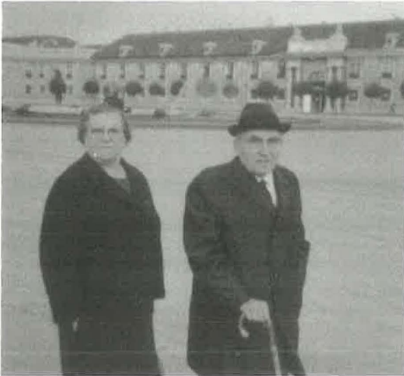
1971: Evangelist Mieves mit seiner Gattin während eines Kuraufenthalts