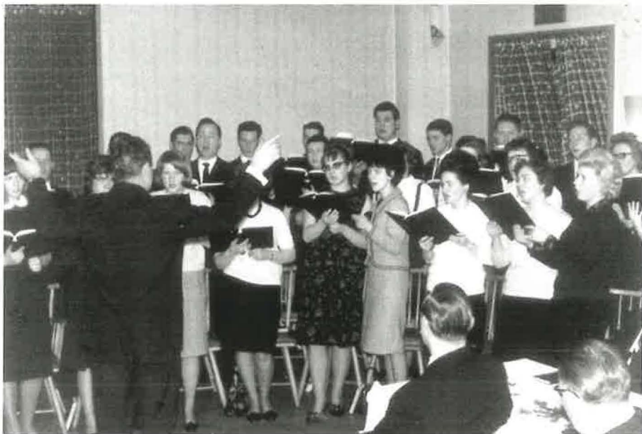
1965: Gemeinsame Weihnachtsfeier der Gemeinden Balkhausen und Frechen