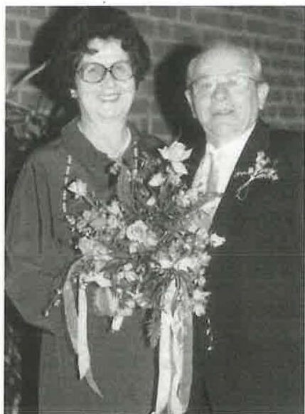
1984: Geschwister Wilden feiern Goldene Hochzeit