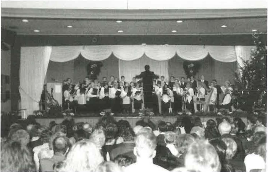
1993: Weihnachtssingen in der Mehrzweckhalle Horrem