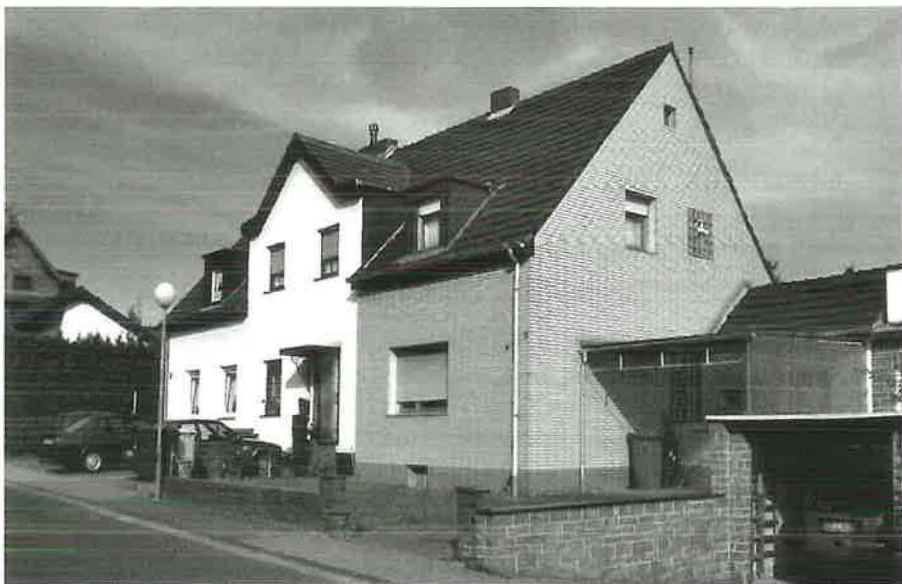
Das ehemalige Haus der Geschwister Maselter