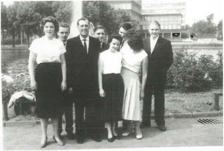
1959 Jugendtag in Dortmund