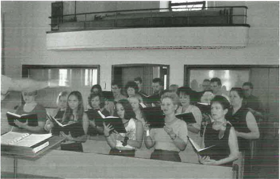
2001: Während der Chorprobe