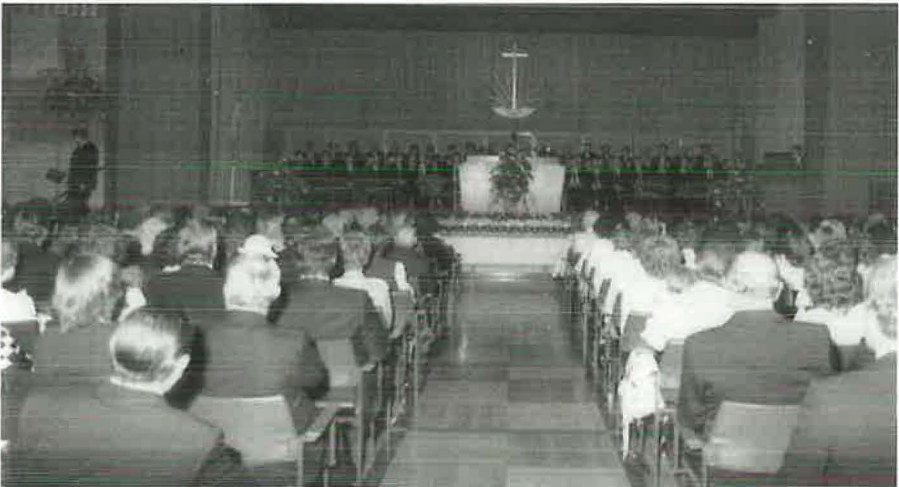
13. November 1983: Ein Blick in die vollbesetzte Erfthalle