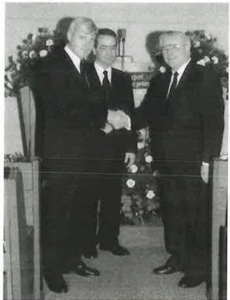
Der alte und der neue Vorsteher