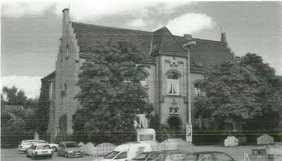
Ein Saal der ehemaligen katholischen Schule in Türnich diente den Geschwistern in den Jahren 1948 bis 1959 als Versammlungsstätte