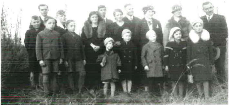
Jugend und Kinder im Jahre 1936

einstündige Marsch bei sengender Hitze auf dem baumlosen Weg als großes Opfer der Familie zu werten ist, dürfte wohl kaum zu verkennen sein.