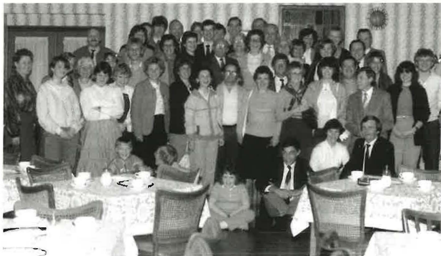
1984: Die Gemeinden Balkhausen und Lechenich besuchen den Verlag Friedrich Bischoff