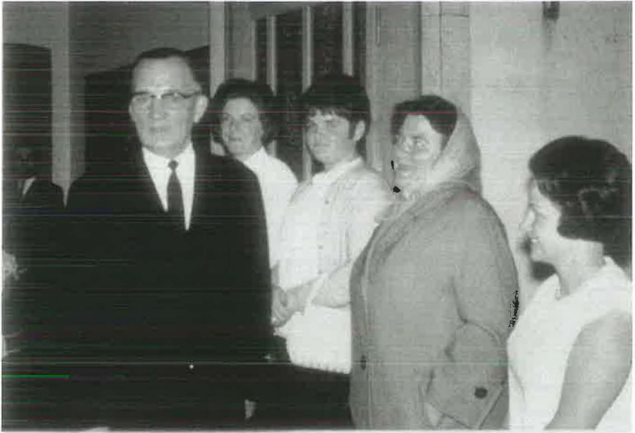
1965: Apostel Dicke besucht die Gemeinde Balkhausen und verabschiedet sich von den Geschwistern und Kindern