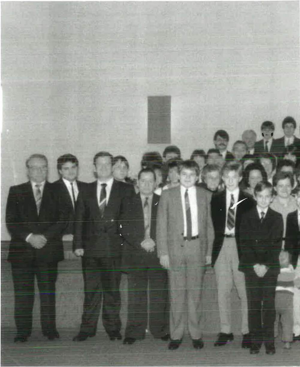
1987: Die Gemeinde stellt sich zum gemeinsamen Foto auf