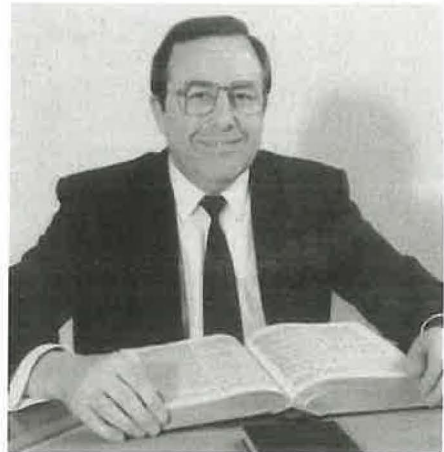
Bischof Helmut Bör aus Bonn