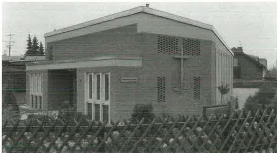
Unsere Kirche in Ertstadt-Lechenich