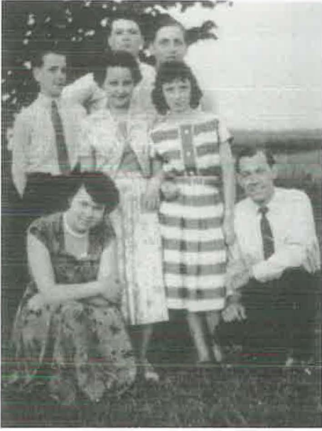
1957: Im Jugendkreis