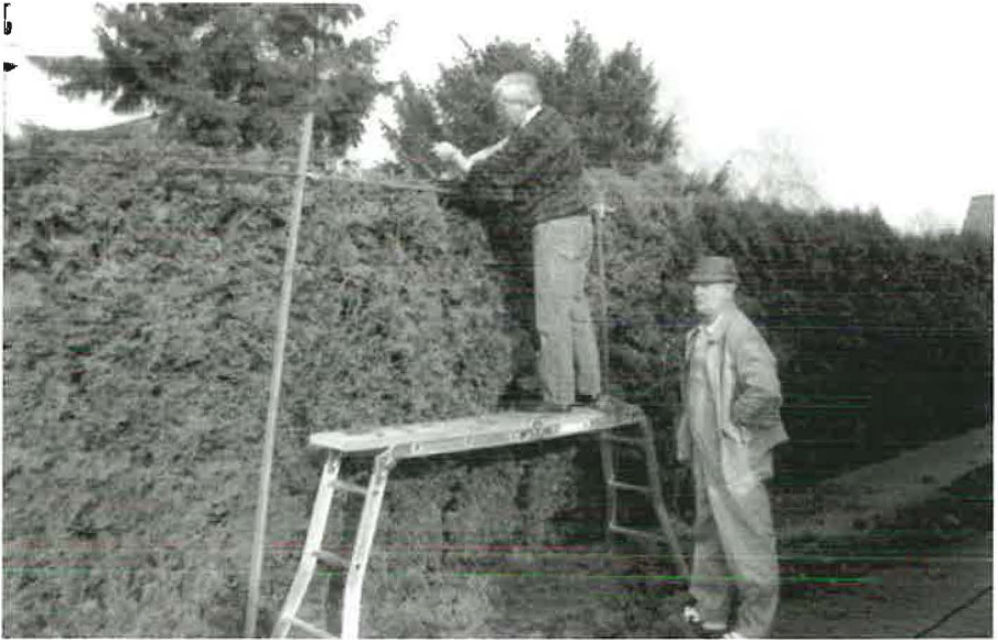
1998 Beim alljährlichen Heckenschnitt auf dem Kirchgrundstück