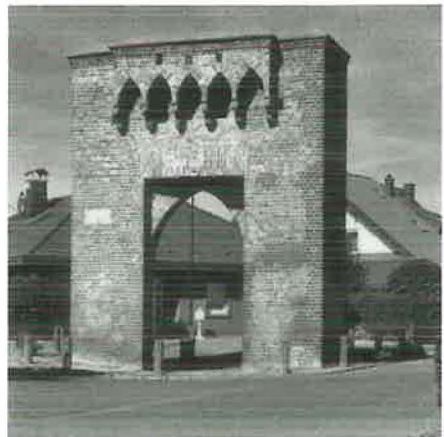
Das Burgtor in Brügggen

In Brügggen war seit dem 14. Jahrhundert eine Familie von Brügggen bezeugt. Von ihrem Sitz ist heute nur noch der