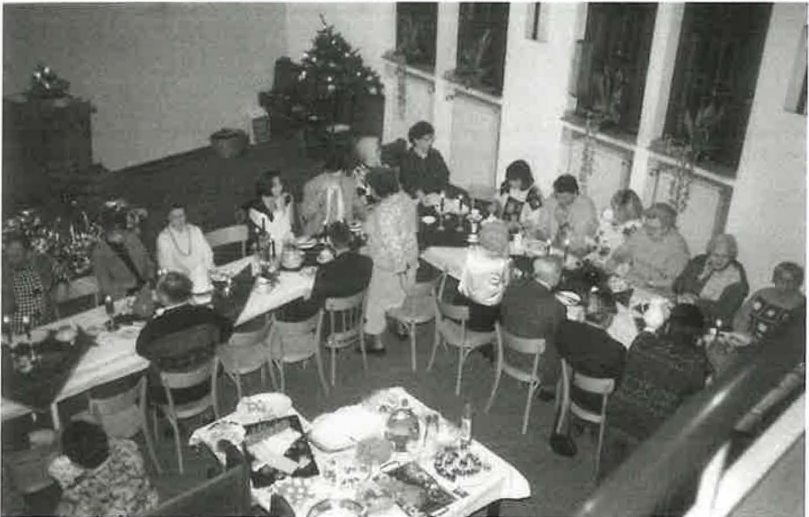
1994: Auf Anregung des Bezirksapostel sind die Putzgruppen zu einer Weihnachtsfeier zusammengekommen, zu der die ganze Gemeinde eingeladen ist