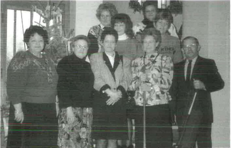
1995: Die Putzgruppen stellen sich zum gemeinsamen Bild auf