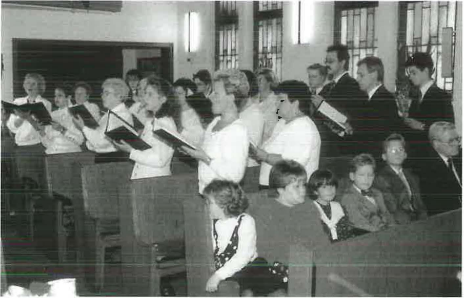
Der Chor singt zum Apostelgottesdienst