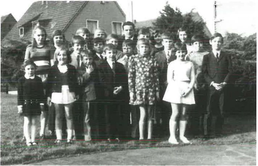
Die Sonntagschüler des Jahres 1972 mit ihrem Lehrer, Priester Wien