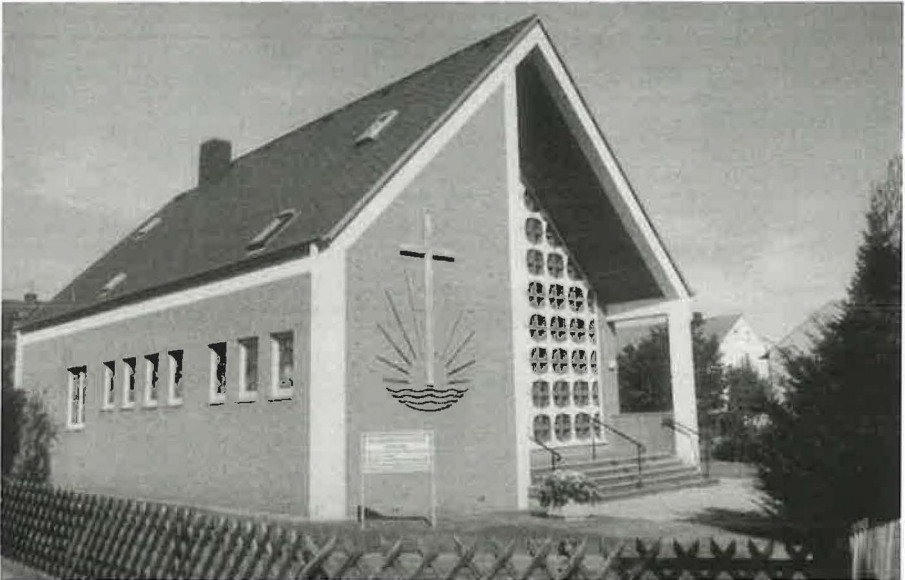
Die Kirche der ehemaligen Gemeinde Kerpen