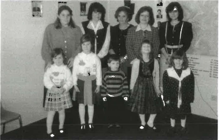
1996: Die Vorkonntagsschüler mit ihren Lehrerinnen