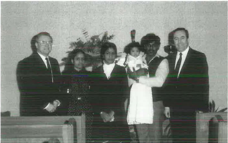
1985: Taufe bei den Tamilen mit Bezirksevangelist Bör