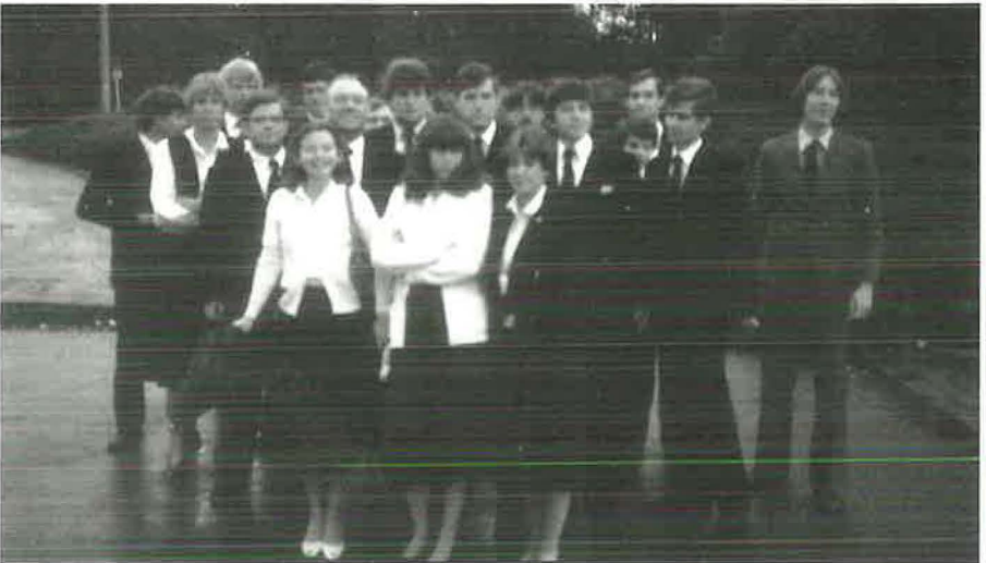
1981: Die Jugendtagsteilnehmer der Gemeinde Balkhausen