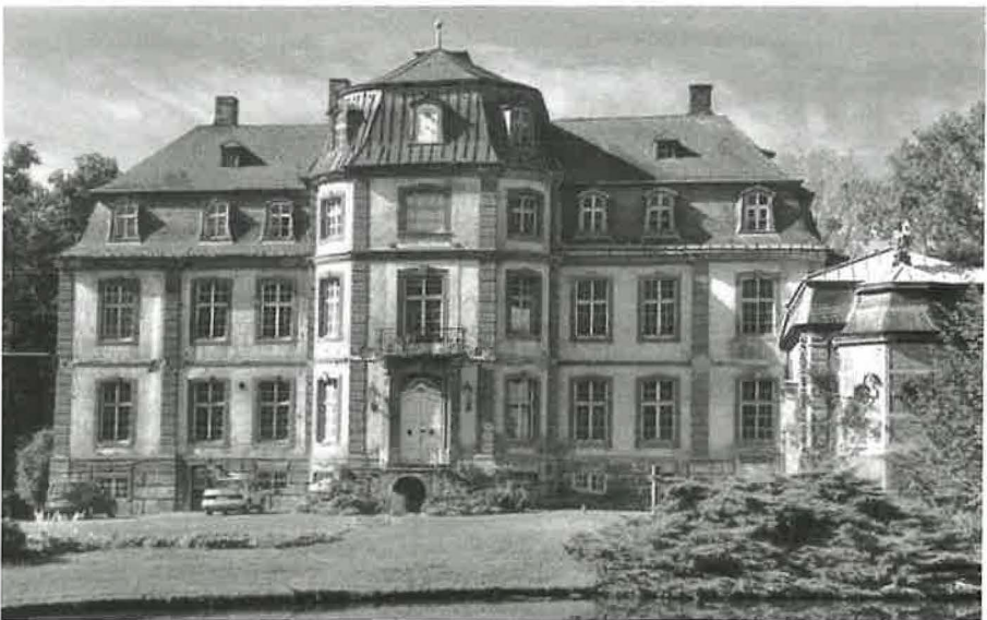
Das im 18. Jahrhundert neu errichtete Schloss Türnich

1233 erhielt der Graf von Jülich die Vogtei Türnich als pfalzgräfliches Lehen. Seit dem 13. Jahrhundert erscheint auch ein nach Türnich benanntes Rittergeschlecht. Als frühester Grundherr galt das adelige Damenstift Essen, das in Türnich einen Hof hatte, der seit seiner Verpfändung 1532 mit dem Hause Türnich verbunden blieb. Im 15. Jahrhundert oblag die Verwaltung der Fami-