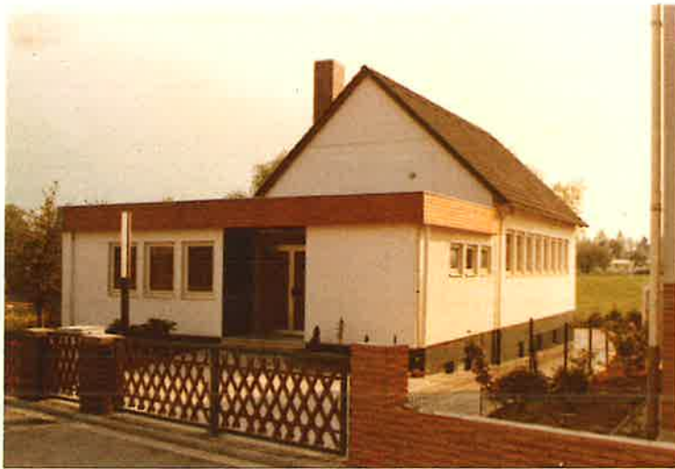
Die Kirche in Steinbach/Taunus, Wiesenau 13

der neuapostolischen Kirche in Steinbach/Taunus