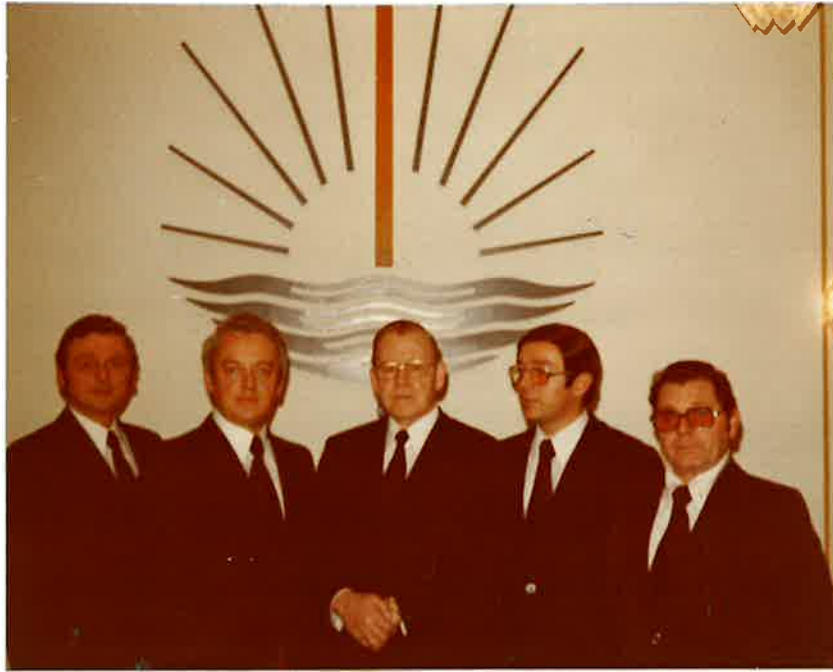
Amtsbrüder der Gemeinde Habblinghausen 1982