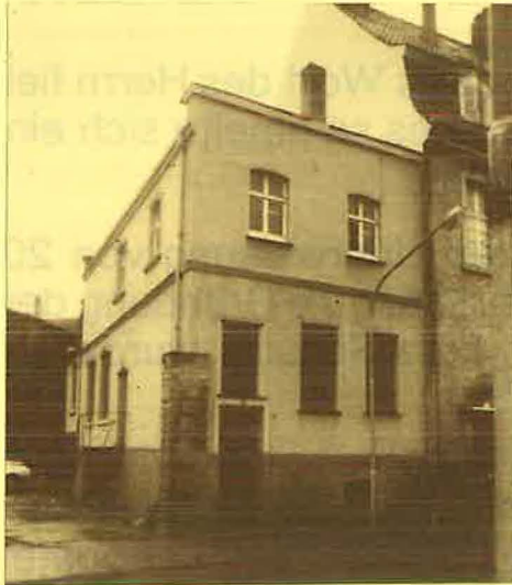
Gemeindelokal Thomästraße 2

In der Thomästraße wurde auch bald ein besserer Raum gefunden, in dem die Gottesdienste stattfinden konnten.