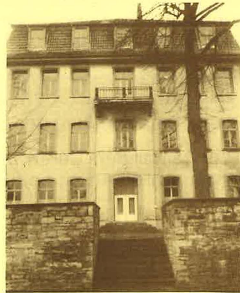
Schule, Hoher Weg