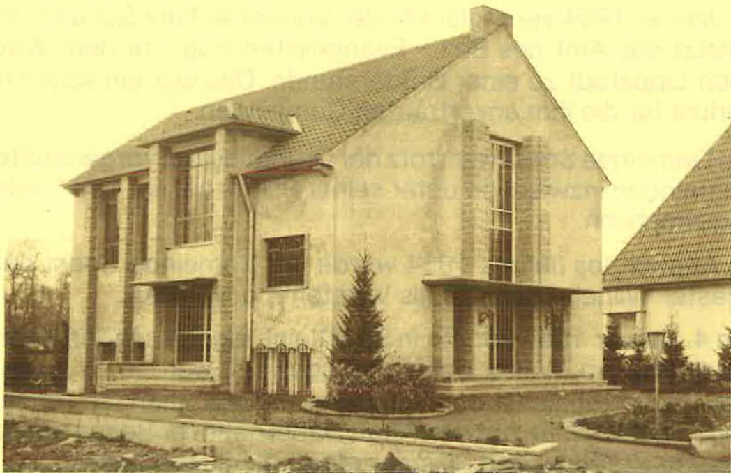
Kirche zum Zeitpunkt der Einweihung