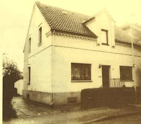
Wohnhaus am Meiningser Weg

Recht bald konnten dann in der Küche des Br. Wilhelm Schulze am Sonntag nachmittag die ersten Gottesdienste gehalten werden. Hierzu wurden auch unermüdlich Gäste eingeladen.