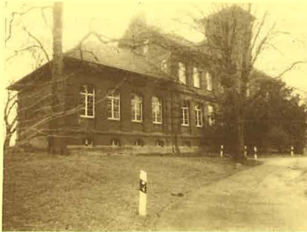
Landwirtschaftsschule Niederbergheimer Straße

Nach Kriegsschluß konnten wir in die öffentlichen Schulen ausweichen.