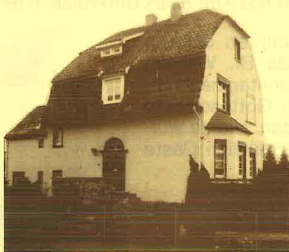
Angemieteter Raum in der Pagenstraße 7