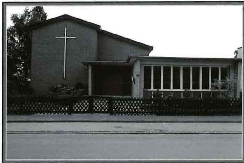
Außenansicht der Kirche am Krumpfen Kamp ( 1961 )

Im Jahre 1961 konnte die Gemeinde, die inzwischen auf 341 Mitglieder angewachsen war, zu ihrer großen Freude eine eigene Kirche am Krumpfen Kamp beziehen.