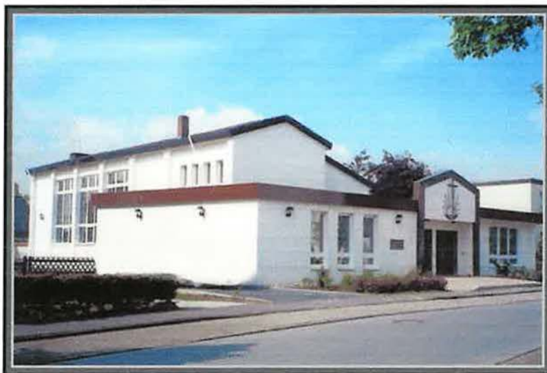
heutige Außenansicht der erweiterten Kirche

1994 erfolgte eine Erweiterung des Gebäudes, so dass jetzt größere Räume für die Sonntagsschule, für Jugend- und Seniorenzusammenkünfte vorhanden sind.