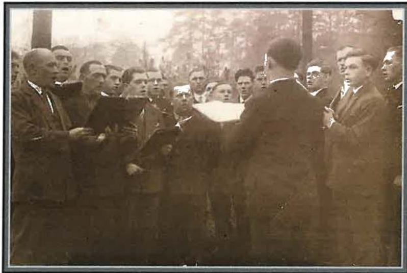
Männerchor der Gemeinde Selm um 1934

Im Jahre 1930 zählte die junge Gemeinde bereits über 200 Mitglieder. Ein gemischter Chor, ein Männerchor und ein Musikensemble trugen zur Verschönerung der Gottesdienste bei.