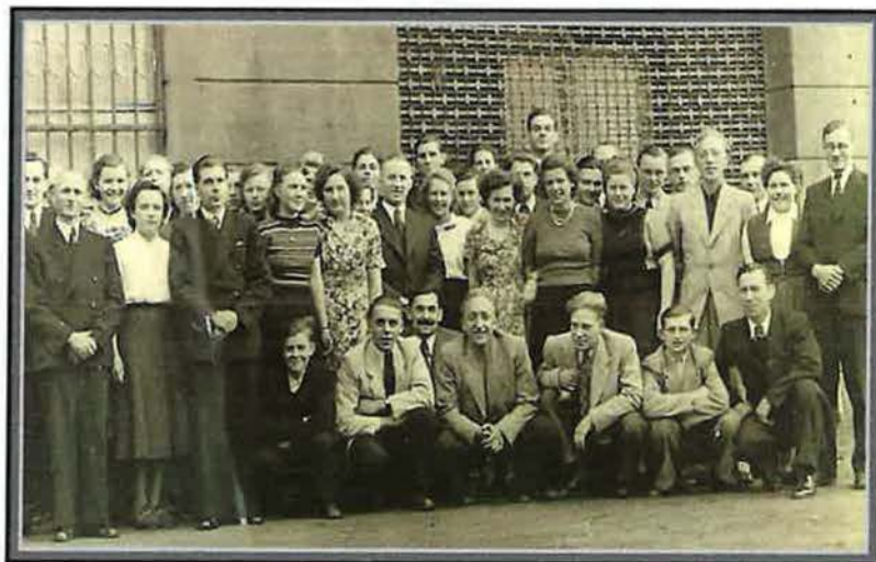
Jugendliche Geschwister vor der Kirche an der Kreisstraße