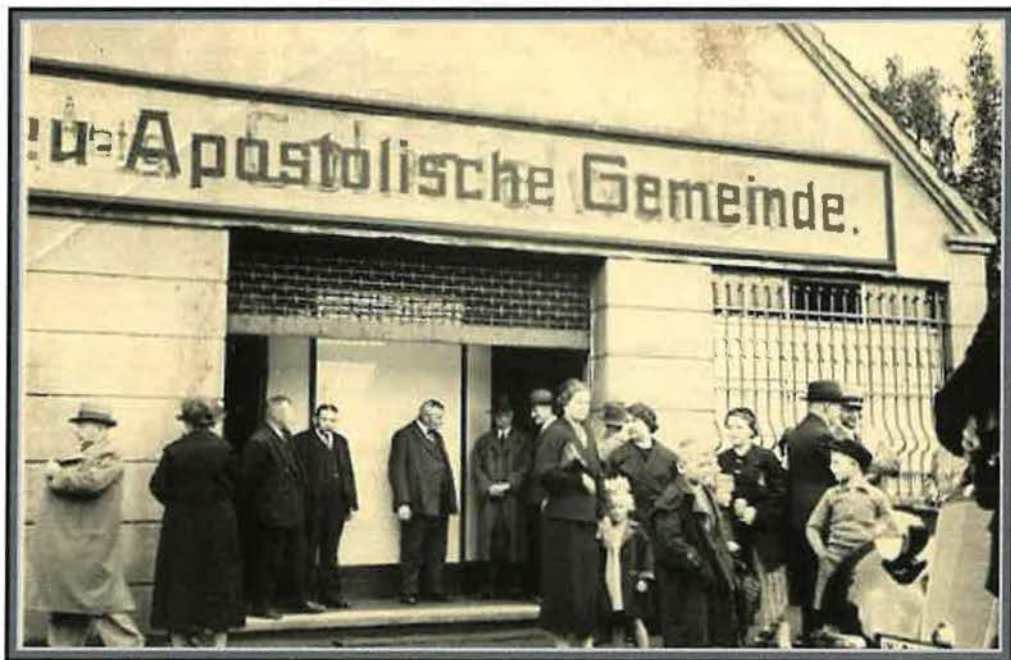
Eingang des Kirchenlokales an der Kreisstraße ( 1928 )

In den Wohnungen der Geschwister reichte bald der Versammlungsplatz nicht mehr aus, so dass man 1928 einen Lagerraum der Konsumgenossenschaft anmietete, der mit freudigem Einsatz der Brüder und Schwestern zu einem würdigen Raum für die Abhaltung der Gottesdienste hergerichtet wurde.