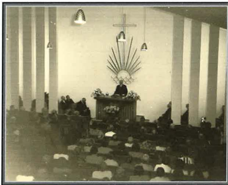
Einweihungsgottesdienst am 17.8.1961