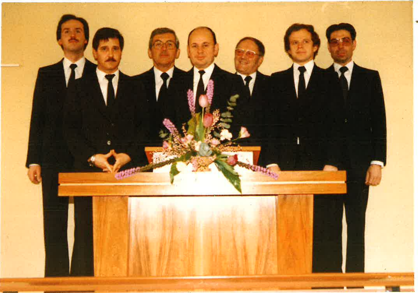
Amtsträger der Gemeinde Schwalbach a. Ts.