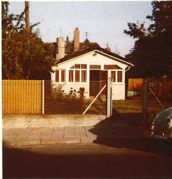
die neue Versammlungsstätte ab Ende 1968