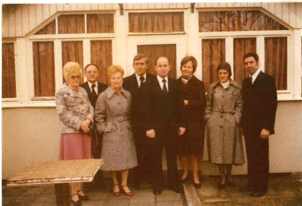
Amtsträger und Frauen der Gemeinde Schwalbach (1975)