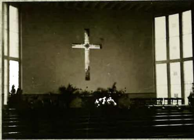
Innenansicht der Kirche im Jahre 1958