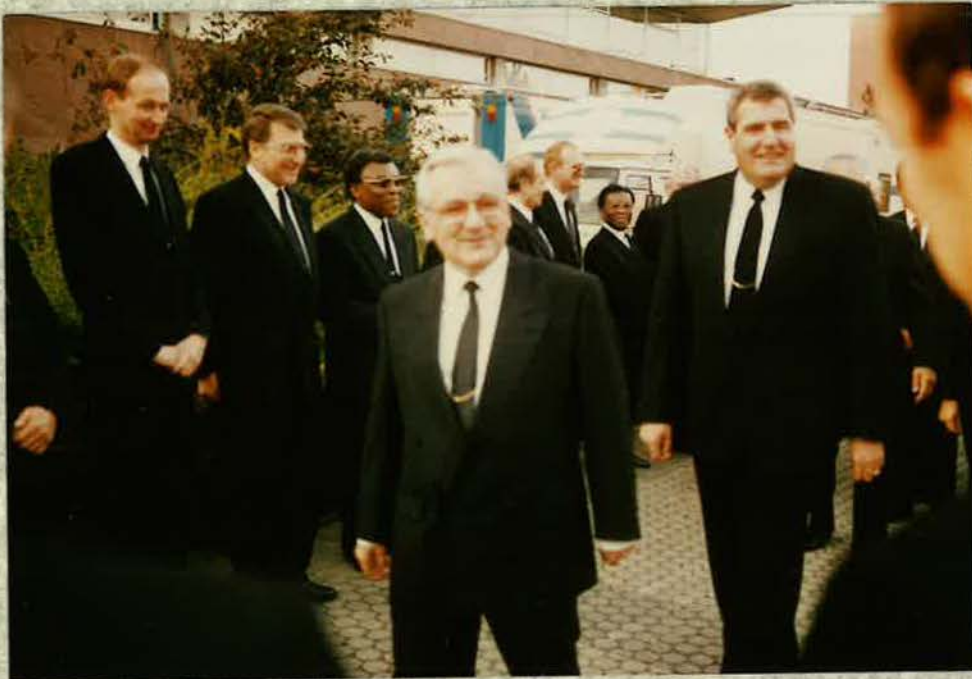
Ankunft von Stammapostel Fehr im September 1989 zum Ämter- gottesdienst in der Walter-Köbel-Halle zu Rüsselsheim