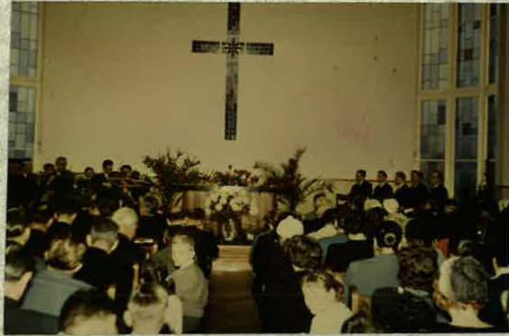
Geschwister vor dem Gottesdienst um das Jahr 1960