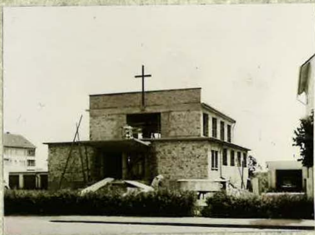
Bau der neuen Kirche in der Breslauer Straße im Jahre 1958