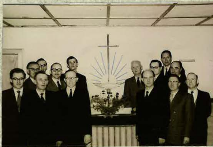
Rüsselsheimer Amtsbrüder um das Jahr 1953