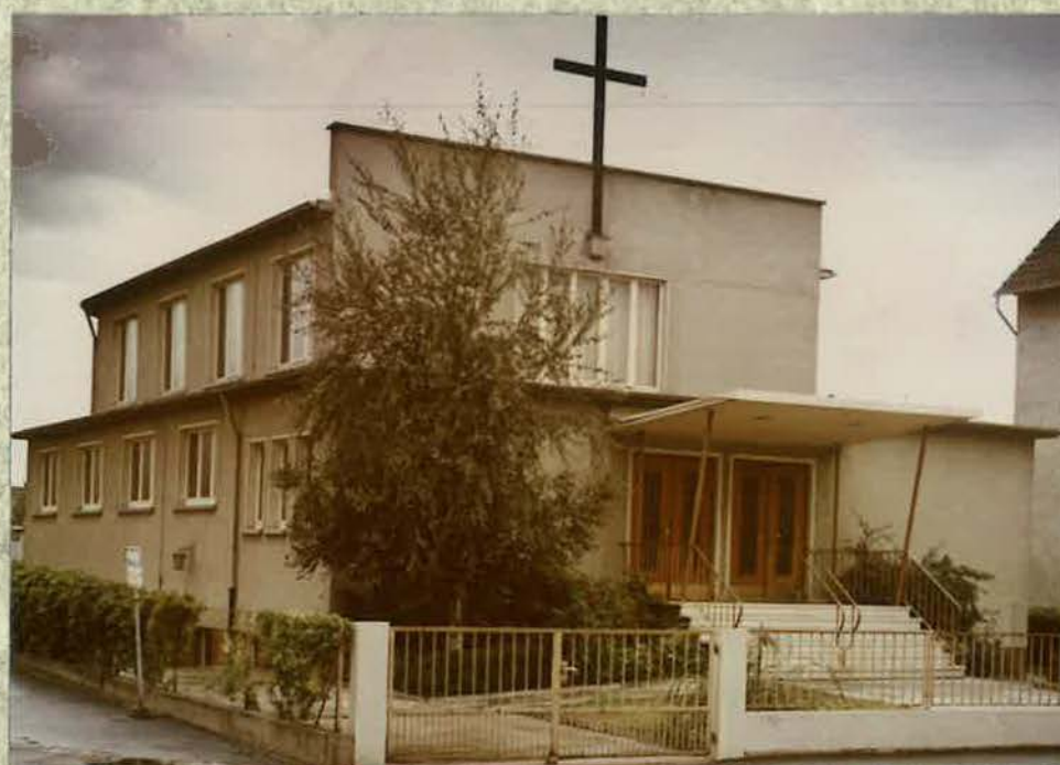
Kirchenansicht um das Jahr 1968