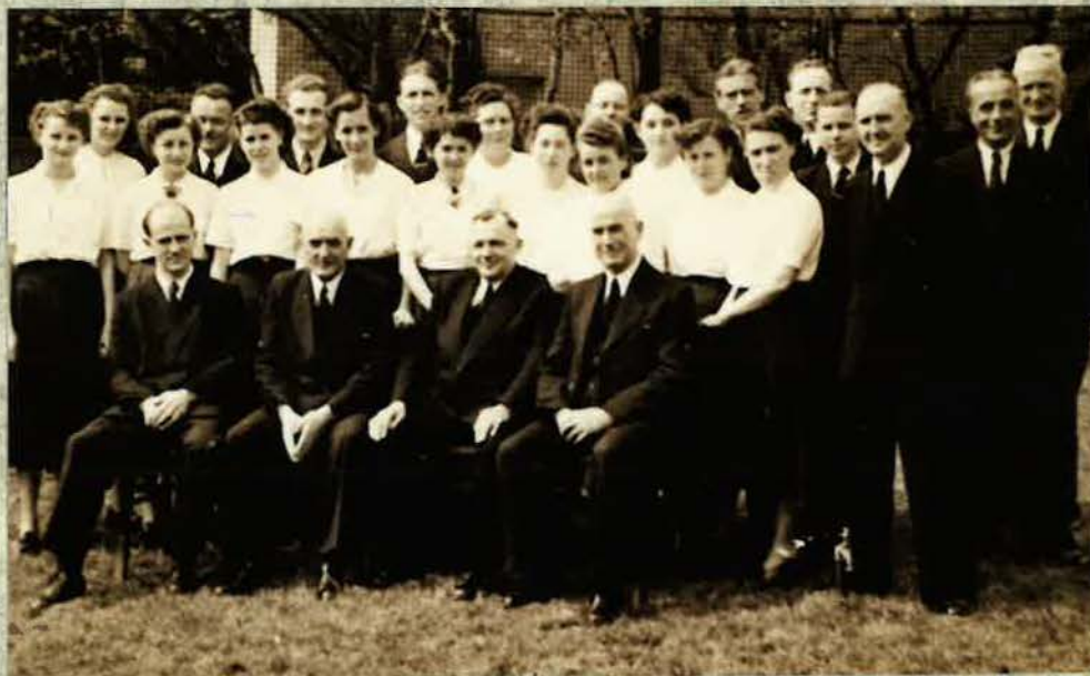
Amtsbrüder mit dem Chor in der Frankfurter Straße um das Jahr 1952