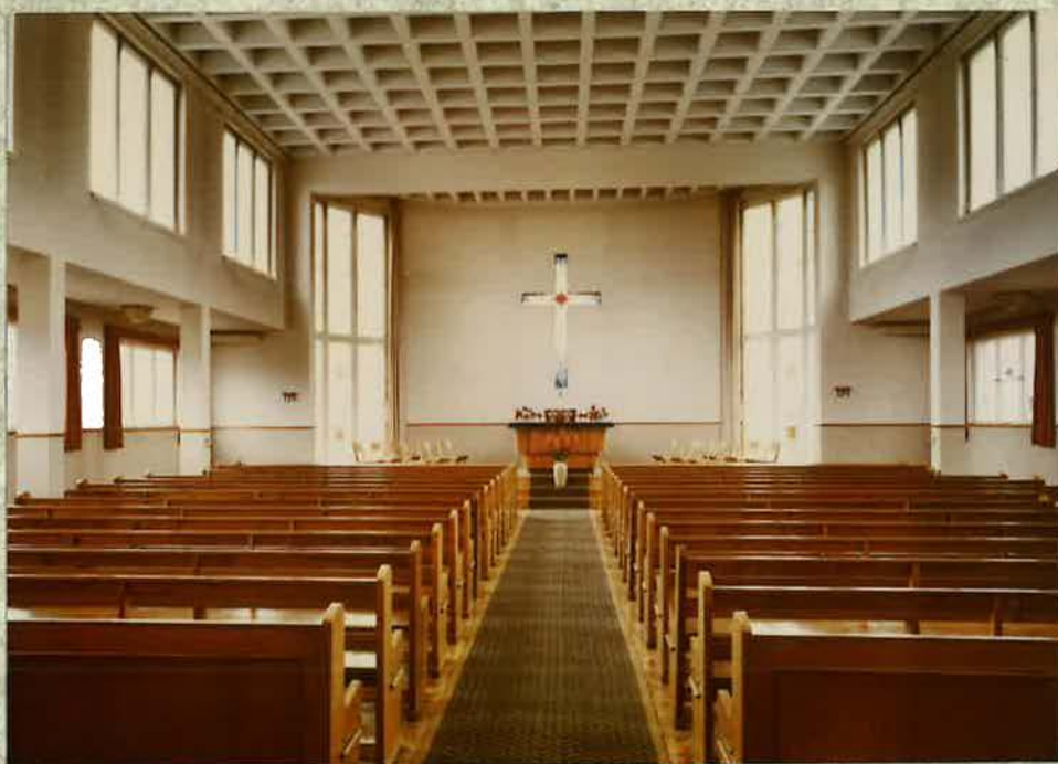
Innenblick der Kirche Rüsselsheim