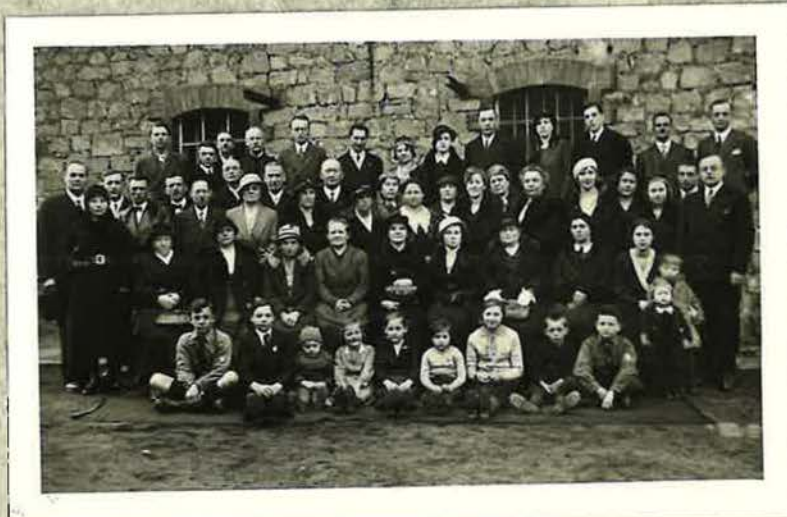
Die Gemeinde Rüsselsheim vor der Versamlungsstätte in der Engelhardt Fabrik um das Jahr 1935