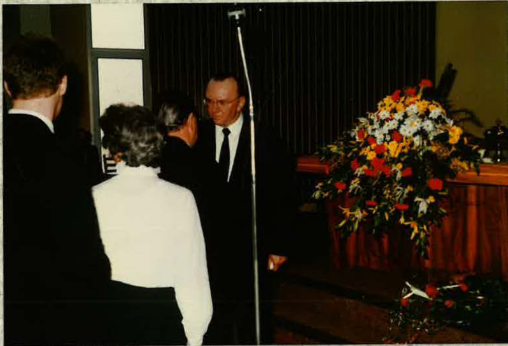
Apostel Freudenberg beim Verabschieden der Geschwister nach dem Gottesdienst am 27. April 1986