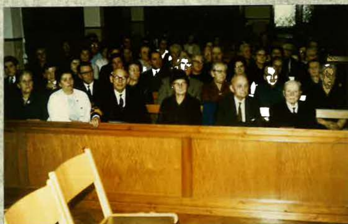
Blick in die Gemeinde im Juni 1966