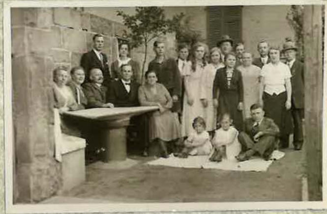
Erstes Gemeindebild aus der Gründerzeit im Garten der späteren Versammlungsstätte in der Frankfurter Straße 1934