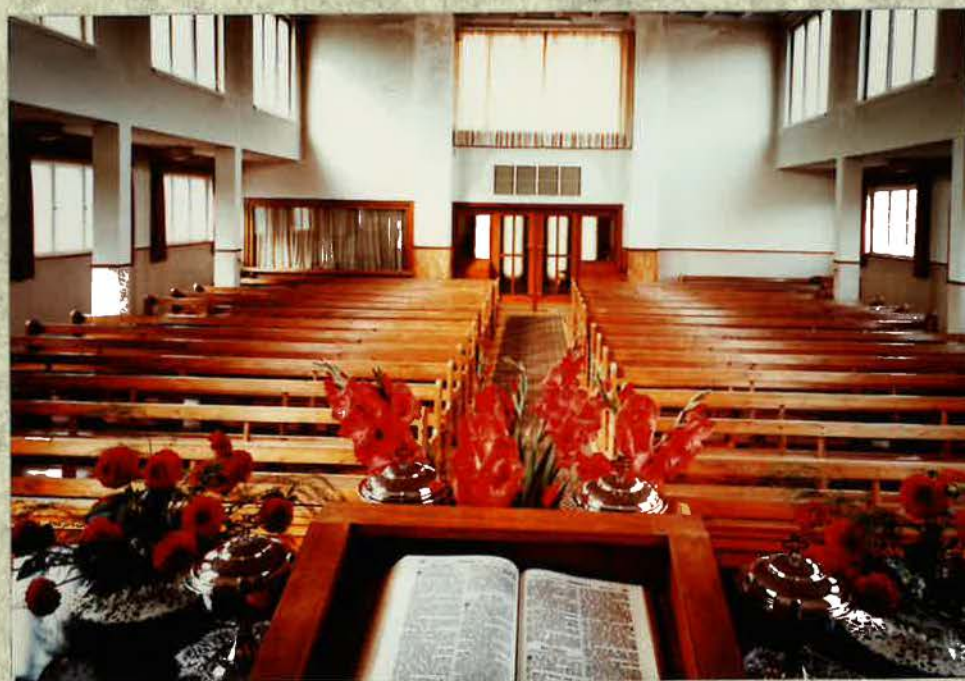
Blick vom Altar in die Gemeinde