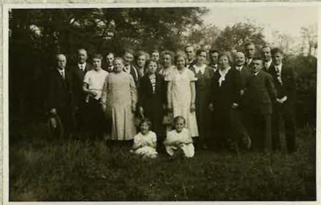
Geschwister bei einem Ausflug zu Himmelfahrt im Jahre 1934