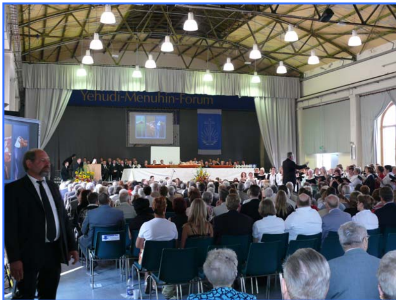
Gottesdienst im Yehudin-Menuhin-Forum in Marl