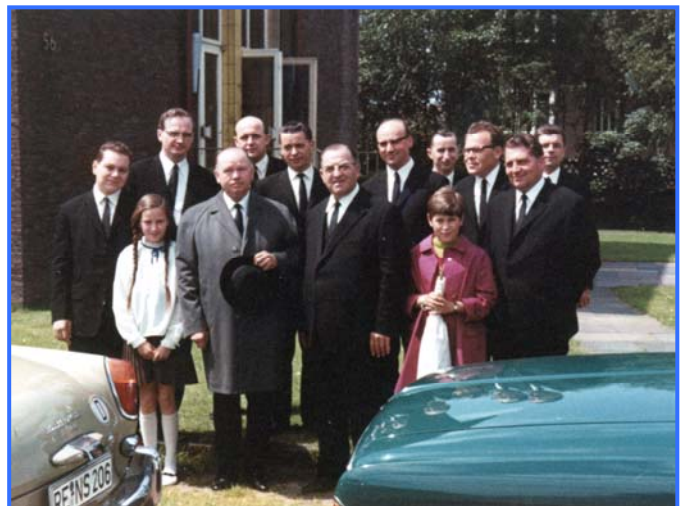
Besuch von Bezirksapostel Schiwy

Aber auch Stammapostel Walter Schmidt durfte am 17. Dezember 1967 in Hochlarmark begrüßt werden. Das war damals ein schönes vorgezogenes Weihnachtsgeschenk für die Geschwister.