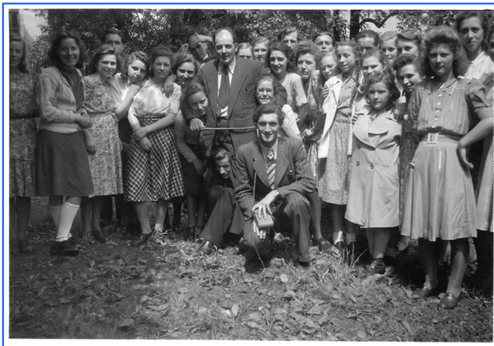
Die Jugendlichen 1949

Am 29. Mai 1949 gab es ein Ereignis, das von allen, die es damals miterlebt hatten, nie vergessen wird: Das erste Jugendtreffen des Bezirkes Westfalen nach dem Krieg.