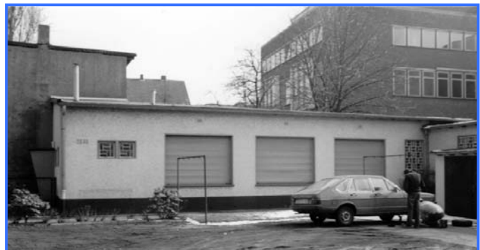
Gebäude auf der Feldstraße

Nach dem Zweiten Weltkrieg vergrößerte sich die Gemeinde zusehends. Bis 1954 hatte sich die Zahl der Gläubigen verdoppelt. Der Platzmangel in dem Gebäude auf der Feldstraße führte nun zu einer Notlösung, da kein anderer geeigneter Versammlungsort gefunden werden konnte: Die Gemeinde wurde geteilt (als Grenze diente die Eisenbahnlinie Essen-Münster) und es mussten sonntags mehrere Gottesdienste gehalten werden. Aber dies konnte natürlich kein Dauerzustand sein.