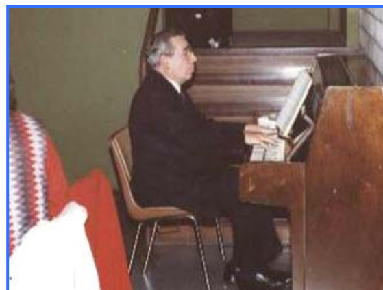
Apostel Magney am Klavier

Das erste Seniorentreffen für den Unterbezirk Recklinghausen fand am 9. Januar 1989 statt. Nach einem gemütlichen Kaffeetrinken, folgte ein schönes Programm mit Musikvorträgen eines kleinen Orchesters sowie eines Männerchores. Die Besuche von Bischof Brückner und Apostel Hermann Magney (1990) sind unvergessen. Der Apostel ließ es sich nicht nehmen, im Männerchor mitzusingen und das Abschlusslied selbst am Klavier zu begleiten.