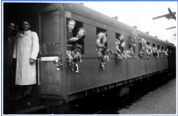
Ein Sonderzug nach Bielefeld