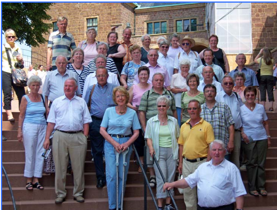
Ausflug der Senioren im Jahr 2008 nach Eisenach

Die Begegnungsstätten in Schöller oder Darfeld waren ebenfalls Ziel für schöne Stunden, in denen die Apostel mal in etwas anderer Atmosphäre als im Gottesdienst erlebt werden konnten.