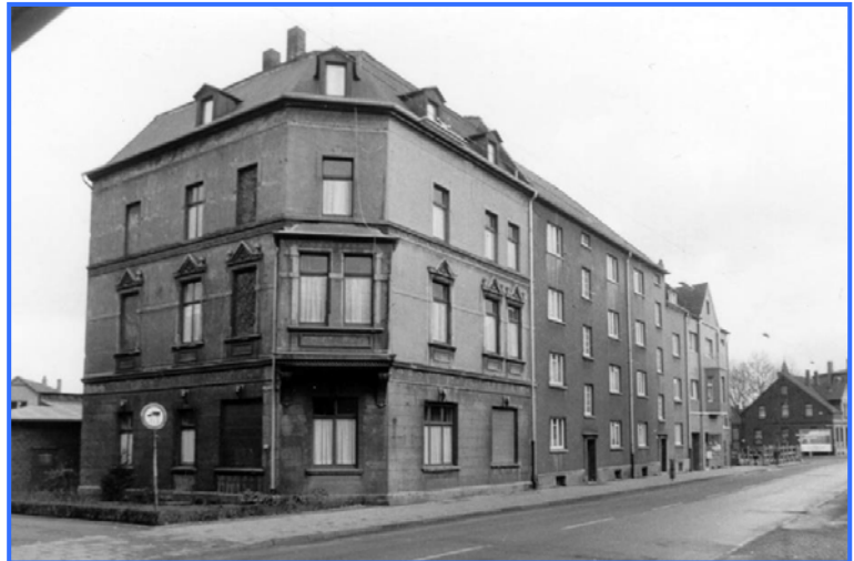
Gebäude auf der Bahnhofstraße

Für die älteren Gemeindemitglieder fanden die Gottesdienste nun in Privatwohnungen statt. Da der Platz jedoch nicht ausreichte, mussten sich alle anderen weiterhin auf den Weg nach Herne machen. Verstärkt wurde daher nach einem geeigneten Versamlungsraum gesucht. Dieser wurde schließlich auf der Bahnhofstraße 2 (heute Hochlarmarkstraße) gefunden und am 8. September 1912 eingeweiht. Priester Adolph wurde die Leitung der inzwischen auf 118 Mitglieder angewachsenen Gemeinde übertragen.