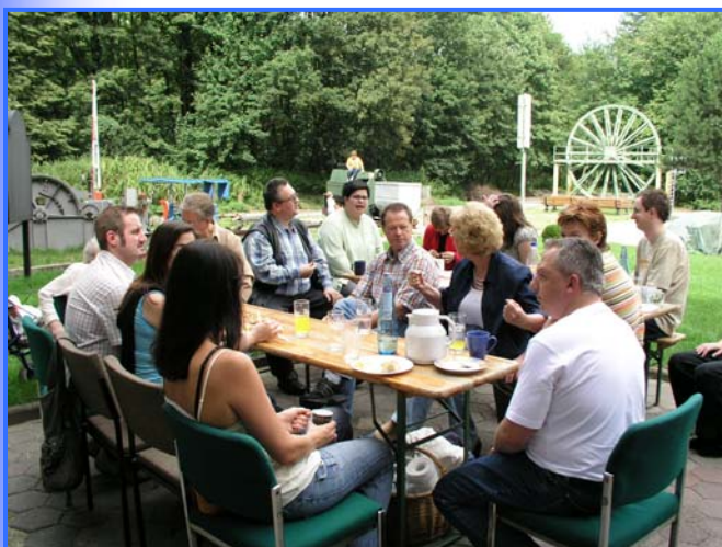
Gemeindefest auf dem Zechengelände in Oer-Erkenschwick im Jahr 2006

Gelegentlich wurden aber auch Orte außerhalb gewählt. So wurde zum Beispiel im Jahr 2000 das Gelände eines Hundevereins Ort des Gemeindefestes. 2006 traf sich die Gemeinde auf dem Zechengelände in Oer-Erkenschwick. Nach einem interessanten Museumsbesuch folgte der gemütliche Teil in einem nachgebauten Stollen. Das Maschinenhaus der ehemaligen Zeche in Hochlarmark war Ausweichpunkt für das Gemeindefrühstück im Jahr 2005, da zu diesem Zeitpunkt das Kirchengebäude umfangreich renoviert wurde.