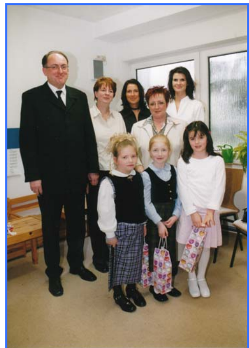
Kinder der Vorsonntagschule 2004

Für einen Sonntag hatte sich die Vorsonntagschullehrerin das Thema „Fußwaschung“ vorgenommen. Um dieses den Kindern anschaulich zu vermitteln, wurde das Ganze „in echt“ durchgeführt. Mitgebrachte Schürzen und eine Schüssel mit Wasser waren die dazu nötigen „Requisiten“. Das gab ein mächtiges Geplantsche, aber es war biblische Geschichte, die auch verstanden wurde.