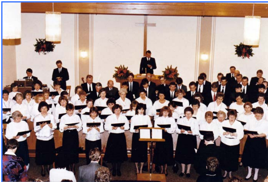
Adventssingen 1987 mit der Gemeinde Recklinghausen-Nord

In den Jahren 1983 bis 1993 fanden fast jährlich zu Beginn der Weihnachtszeit Adventssingen statt. Diese wurden teilweise gemeinsam mit der Gemeinde Recklinghausen-