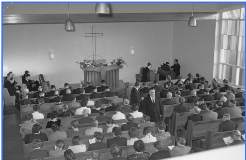
Blick in das Kirchenschiff, 1960

Als die Kirche 1960 eingeweiht wurde, waren die Hochlarmarker glücklich, endlich ein eigenes und ausreichend großes Kirchengebäude als ihr Zuhause nutzen zu können. Neben dem Kirchenschiff gab es eine Empore, ein Ämterzimmer und einen durch eine Falttür abgetrennten Bereich für Mütter mit Kleinkindern. Das Untergeschoss verfügte über eine große Garderobe, Toilettenräume, einen Mehrzweckraum (überwiegend für die Sonntagschule) und Abstellräume.