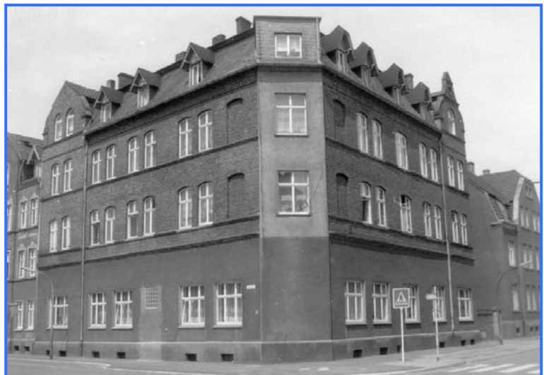
Gebäude auf der Forellstraße

Leider musste der Raum 1918 wieder aufgegeben und die Gottesdienste wieder in Herne besucht werden. Zwei Jahre später, im Oktober 1920 konnte ein Lokal in der Forellstraße 14 in Recklinghausen-Süd angemietet werden, das nun bis 1935 für die Gemeinde das „Zuhause“ bildete. Inzwischen war aber die Mitgliederzahl auf über 200 Seelen angewachsen und die Versamlungsstätte „platzte aus allen Nähten“. Ein neues Gebäude musste also dringend gefunden werden! In einem Hinterhof an der Feldstraße 29 fand man schließlich einen zerstörten Saal. Er wurde für 720,- Mark Jahresmiete am 15. September 1935 angemietet. Durch Eigenleistung schafften die Gläubigen sich eine neue Versamlungsstätte, die nach Aussagen von älteren Gemeindemitgliedern aber mit dem schönen Saal auf der Forellstraße nicht zu vergleichen war. Der Versamlungsort war ein eingeschossiger Flachbau ohne Keller. In einem kleinen Anbau wurde das Ämterzimmer eingerichtet und in dem winzigen Keller darunter konnten Kohlevorräte aufbewahrt werden.