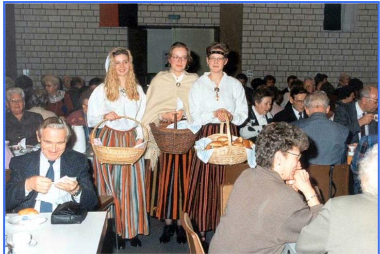
Treffen der Senioren 1994

Das Treffen im Januar 1994 stand unter dem Motto „Russland öffnet sich“. Auf dem Programm standen russische Lieder und Reiseberichte. Einige junge Schwestern in russischer Tracht servierten Blinis, ein typisch russisches Gebäck.