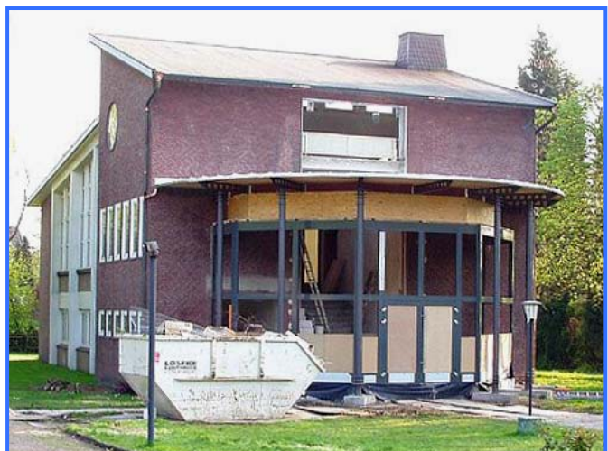
Renovierung, März 2005

Eine richtig große Umbauaktion gab es von Dezember 2004 bis Juni 2005. Auch in dieser Zeit durfte die Gemeinde wieder die Gastfreundschaft der Nachbarn in Recklinghausen-Süd genießen. Derweil wurde in Hochlarmark der Eingangsbereich komplett umgestaltet. Ein moderner lichtdurchfluteter Glasvorbau heißt nun die Besucher willkommen. Der bisherige enge und steile Treppenaufgang ist entschärft worden. Im Innern gab es neue Anstriche für Wände, Decken und Fenster. Ein zeitgemäßer PVC-Belag ersetzte den alten Teppich. Terracottafarbene Bodenfliesen sorgen nun in der Garderobe fast für „mediterranes Flair“. Auch