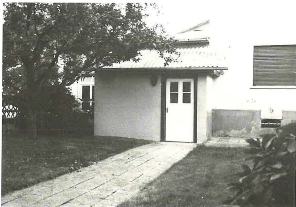
Rodheim seit dem 28. 6. 1979