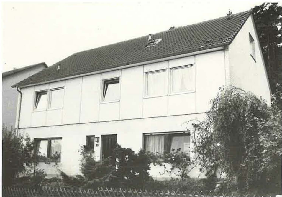
Mammolshain seit dem Jahre 1961