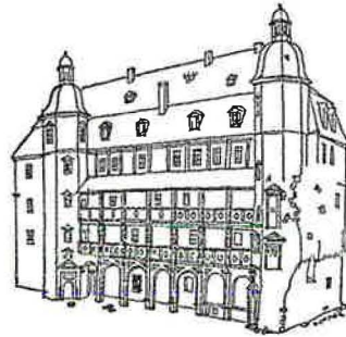
Das Isenburger Schloss

Damit begann die Zeit des Wachstums der Stadt. Zugleich wurde auch der Grundstock zur Industrialisierung