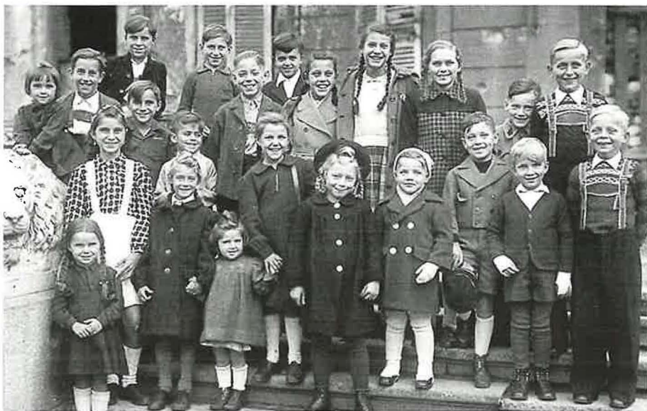
Kinder der Gemeinde im Jahr 1946 – einige davon sind heute Amtsträger