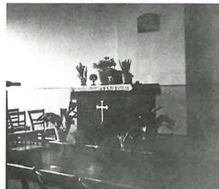
Versammlungsraum in der Karlstraße Der Altar (oben) und Blick auf den Chor mit Dirigent Erich Keil (unten)

Im Februar 1928 wurde für die ständig wachsende Gemeinde eine neue Unterkunft gefunden. In der Karlstraße 58, im Hinterhaus eines Fabrikgebäudes wurde im 2. Stock