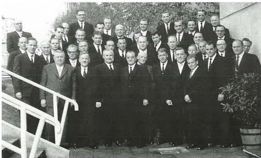
Amtsträger aktiv und in Ruhe aus dem Bereich Offenbach im Jahr 1957