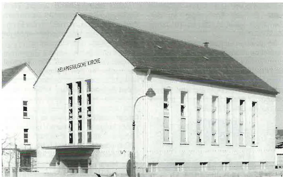
Die neue Kirche in der Tempelseestraße 54 im Jahr 1952

Beim Rückblick auf die weiteren 33 Jahre, die die Gemeinde bis heute in