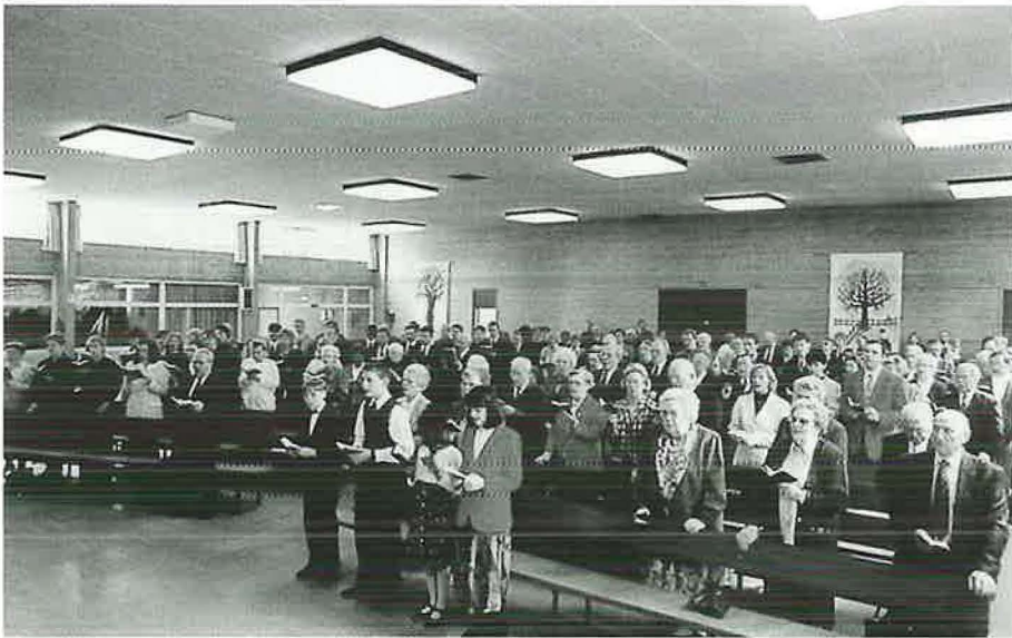
Gottesdienst im Martin-Luther-Haus auf der Rosenhöhe