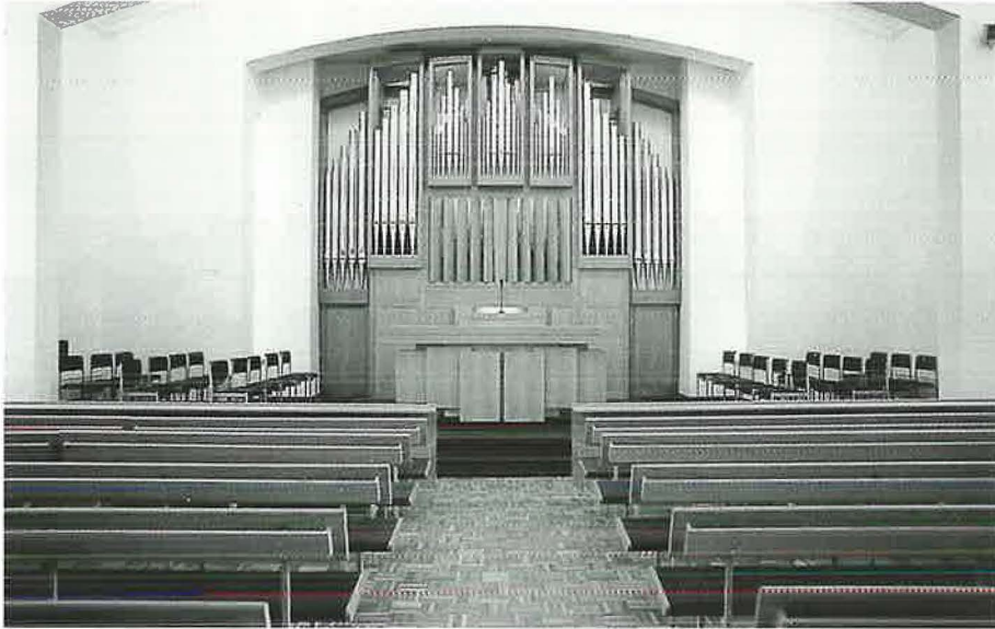
Der neue Innenraum mit Orgel (25 Register, ca. 1500 Pfeifen)