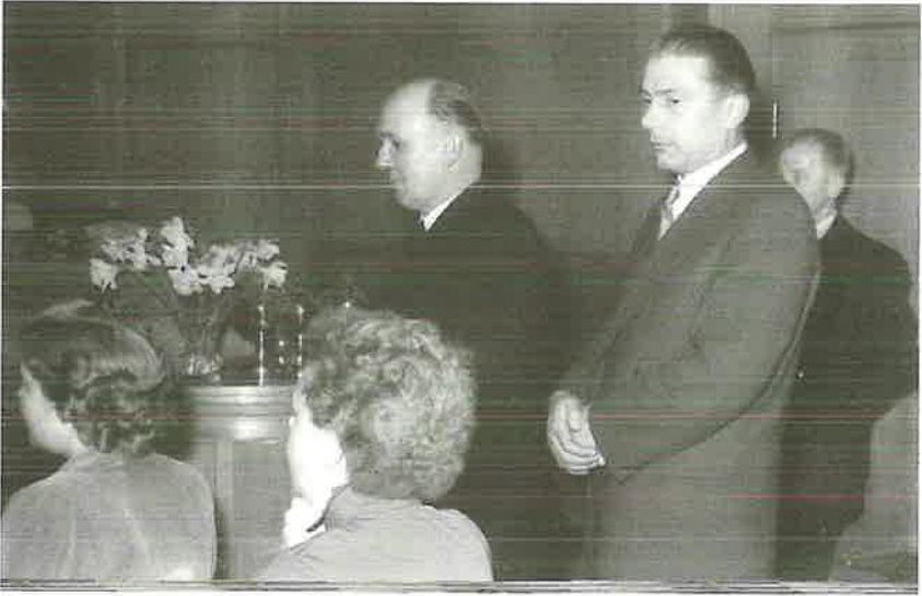
Bischof Franz Moohs