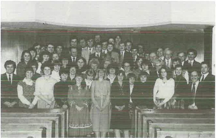
Der Chor 1979