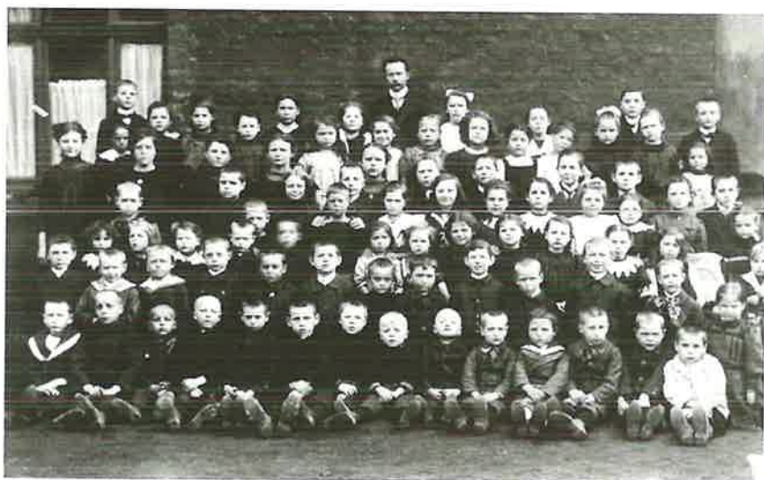
Sonntagschule 1912 Konfirmanden