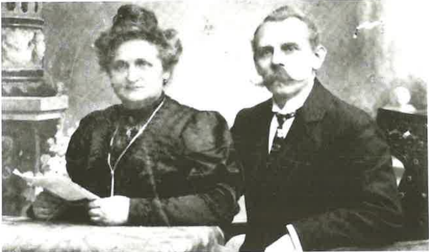
Vorsteher Richter mit seiner Frau