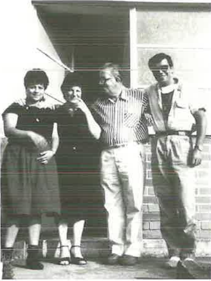
Brüder aus dem Bezirk Oberhausen in Coimbra/Portugal