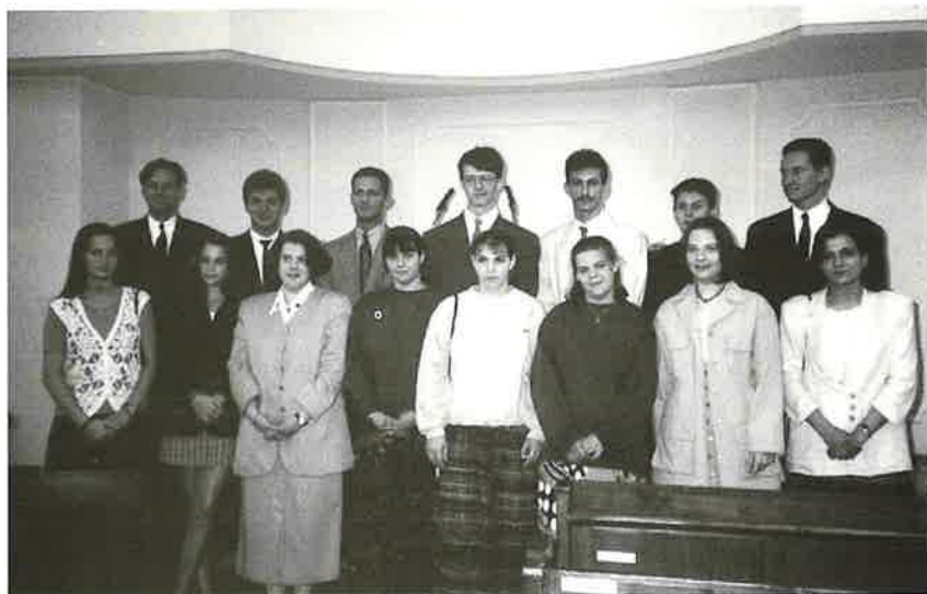
Die Jugend . . .