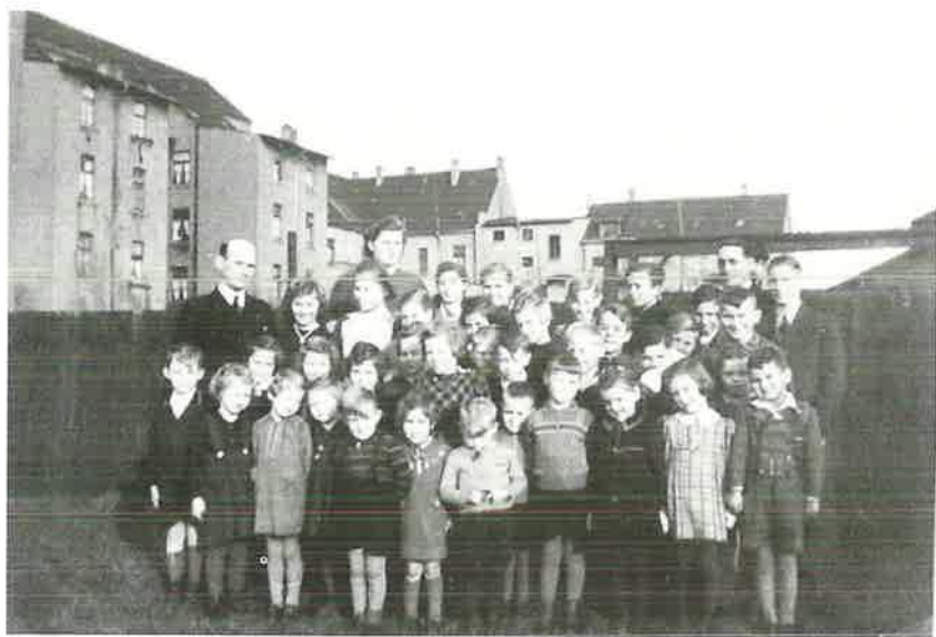
Duisburger Straße etwa 1930 bis 1953