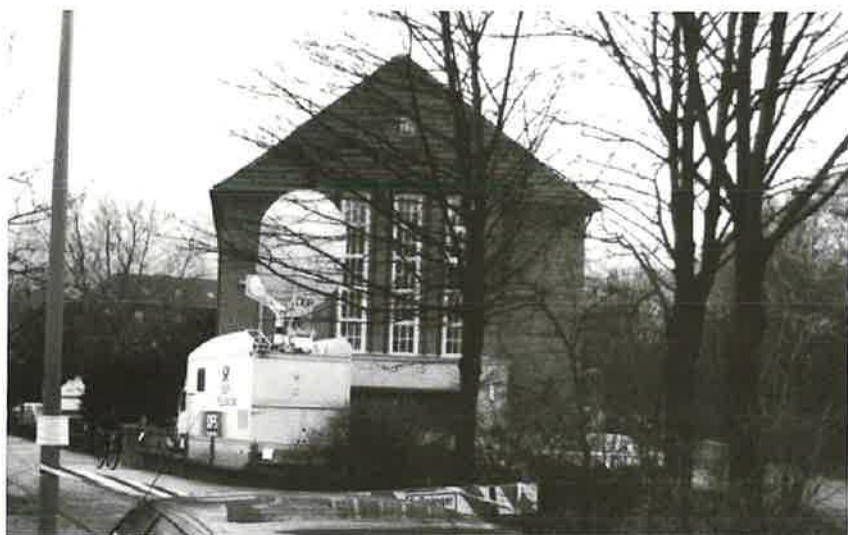
Satellitenübertragung bis nach Litauen . . .