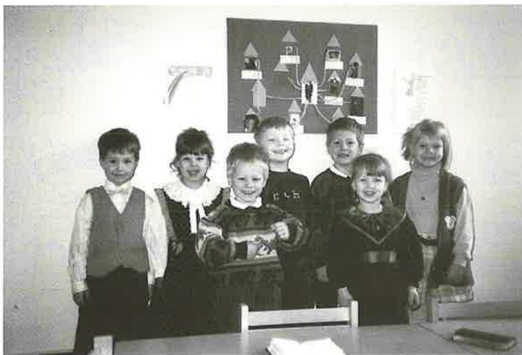
Die Vorsonntagschule ...