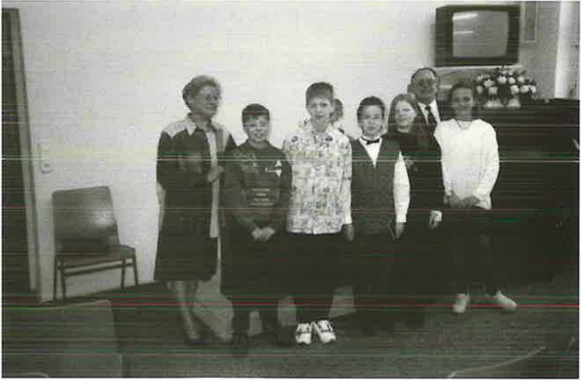
Die Religionskinder ...