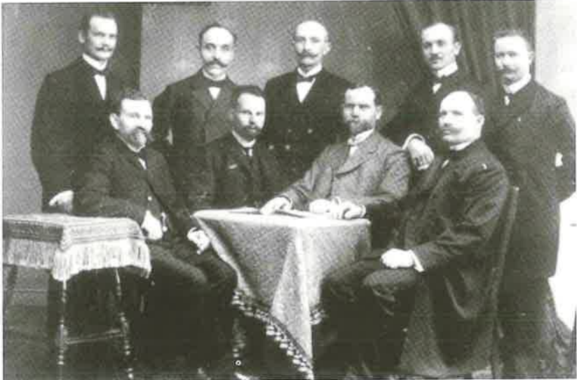
Amtsbrüder aus den Gründerjahren