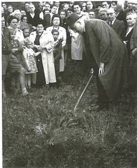
Erster Spatenstich für unsere Kirche 1952