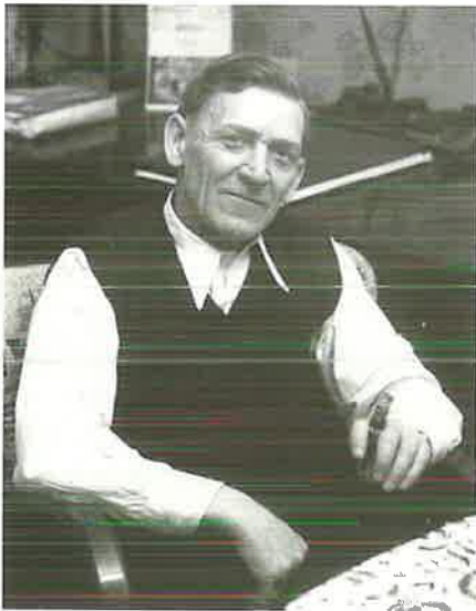
Evangelist Ludwig Fricke