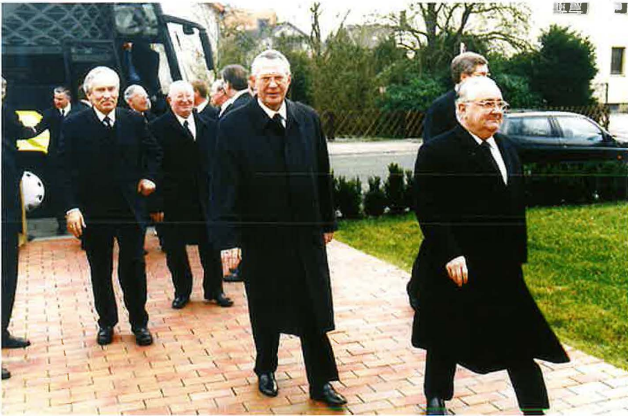
Stammapostel Fehr besuchte am 10. Januar 1999 erstmals den Bezirk Detmold