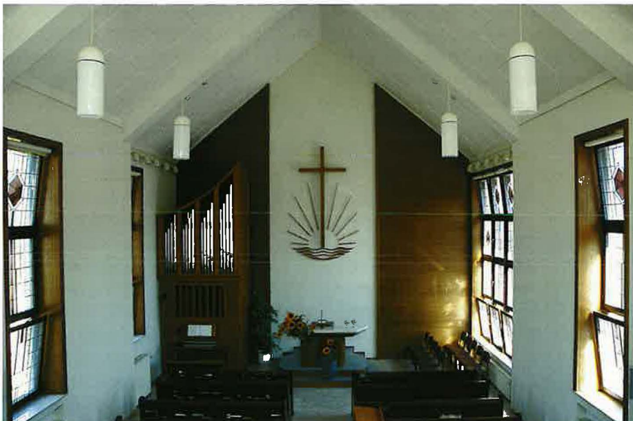
Die neuapostolische Kirche in Paderborn, Josef-Schröder-Straße, erbaut im Jahr 1963, 1992 renoviert und erweitert