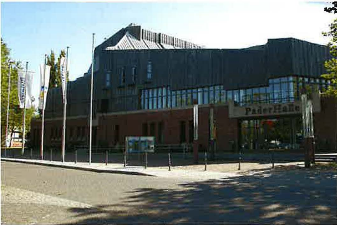
Markante Gebäude in Paderborn: Dom, Paderhalle, Rathaus