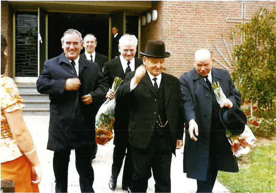
1974: Letzter Besuch des Stammapostels Schmidt in der Gemeinde Detmold