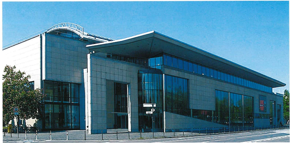
Haus der Geschichte der Bundesrepublik Deutschland

Die Rheinauen sind ein Naherholungsgebiet in Bonn, in dem 1979 die Bundesgartenschau stattfand. Heute werden die Rheinauen regelmäßig für Großveranstaltungen genutzt.