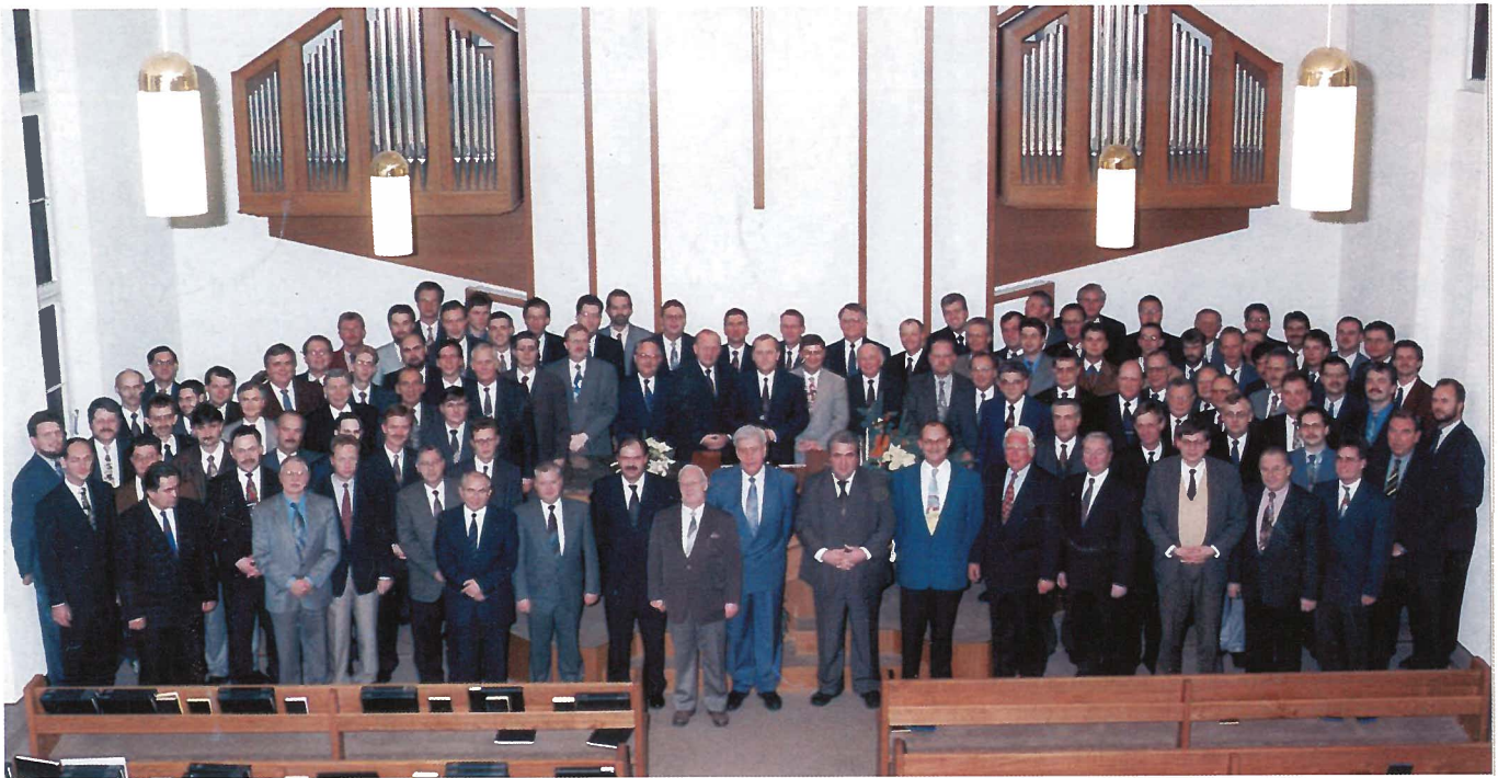
Die Amtsträger des Bezirkes Bonn am 20.12.1996