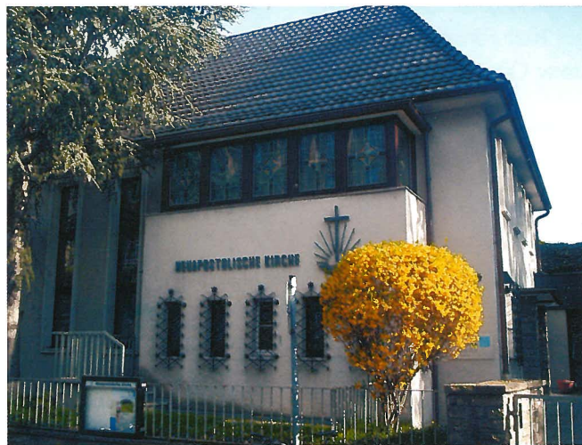
Kirche in Bonn-Mitte

der erste Gottesdienst stattfinden. Nachdem im Jahre 1931 im Haus der Geschwister Rechmann in Bad Godesberg keine Gottesdienste mehr durchgeführt werden konnten, mussten die dortigen Geschwister wieder in der Muttergemeinde Bonn die Segensstunden auskaufen bis zur erneuten Gemeindegründung im Jahre 1946.