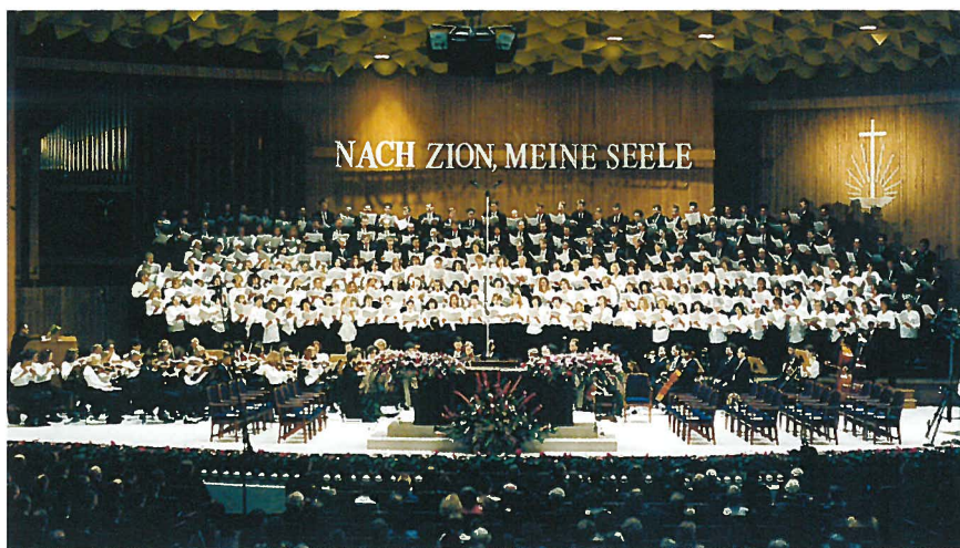
Stammapostelgottesdienst am 1. Januar 1993 in der Beethovenhalle

Der mittlerweile auf 47 Gemeinden angewachsene Bezirk Köln wurde am 3. Mai 1981 in die Bezirke Köln-Nord und Köln-Süd aufgeteilt. Zum Bezirk Köln-Süd gehörten bis auf wenige Ausnahmen alle Gemeinden, die zum heutigen Bezirk Bonn gehören.