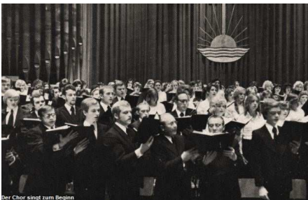
Der Chor singt zum Beginn

Nun kommt ja auch die Frage: Was soll denn durch eine solche vornehme, himmlische Arbeit an uns bewirkt werden? Zuerst wurden wir vom Unglauben in den Glauben hineingeführt. Seither sind wir immer noch tiefer in die Gefilde des Glaubens hineingeleitet worden und haben da die besten Heilsgüter für die Seele gefunden. Und je mehr wir in den Glauben hineindringen, um so wunderbarer wird es. Dann wurden wir Kinder Gottes, daher wurde uns auch wieder gesagt: Fürchte dich nicht, du bist erkaufte aus den Menschen zu einem Eigentum Gott und dem Lamm. Fürchtet euch nicht, ihr seid erkaufte aus den Menschen und seid ein Eigentum Gottes geworden. Die Arbeit geht immer weiter. Durch den empfangenen Heiligen Geist wurde manches in uns geweckt, und das Ziel, das wir jetzt noch vor uns sehen, ist die Würdigkeit auf den Tag des Herrn.