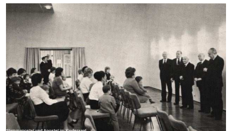
Stammapostel und Apostel im Kinderaal

Und er hatte sieben Sterne in seiner rechten Hand, und aus seinem Munde ging ein scharfes, zweischneidiges Schwert, und sein Angesicht leuchtete wie die Sonne, so heißt es in diesem Schriftwort. Das Schwert ist das Wort Gottes. Und Johannes fiel zu seinen Füßen wie ein Toter. Das ist uns wohl allen im Hause Gottes schon geschehen, daß wir im Geiste unter der Gewalt des Gotteswortes hinfielen und uns nicht mehr regen konnten. Dann ist aber der Herr da, und in seiner göttlichen Art legt er seine rechte Hand auf uns und sagt: Fürchte dich nicht! Auch wenn uns das Wort Gottes deutlich gesagt wurde, oder wenn unsere Fehler aufgedeckt wurden, dann kam doch wieder der Erlöser und sagte: „Steh nur auf, fürchte dich nicht; denn ich bin der Erste und der Letzte und der Lebendige.“